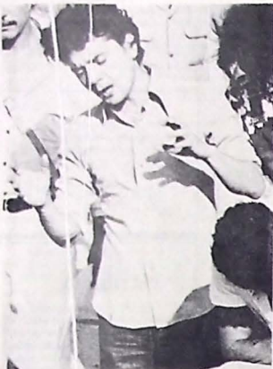
Ipojuca durante as filmagens