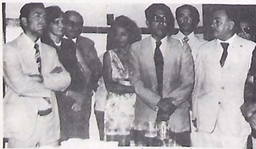
Bronzeado recebeu homenagem dos procuradores do Estado

Entregará também o projeto da capital para liberação de recursos do Fundo Nacional de Saúde; tratará do encontro do GEIN na Paraíba; além de discutir as possibilidades de transformar o encontro materno-infantil, que será realizado ainda no primeiro semestre, em encontro nordestino para discutir a política e a situação da Rede Básica e fará sobre a questão do acompanhamento do Programa Pea Corsane e demais setores do Ministério.