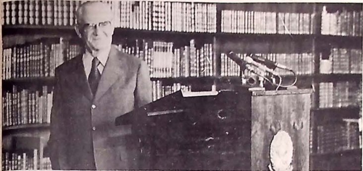
À assinar o livro de fundação do PDS, Ernesto Geisel defendeu a co-gestão nas empresas