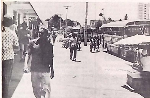
Comerciantes acreditam que ponto de ônibus, no Mercado, favorece ao comércio