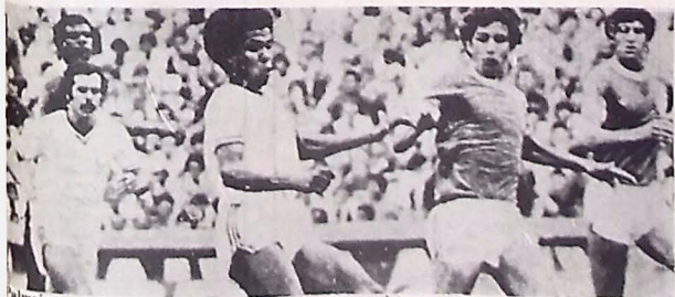
Palmeiras se ofereceu, mas pediu muito alto para amistoso