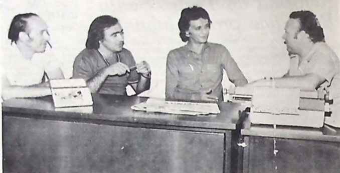
Os bacharéis fizeram críticas ao precário sistema penitenciário de Sousa

Os parabanos temos uma tradição de cultores do Direito, e, não será um breve período, que já está no esquecimento, que vai macular nossa honra e nosso brio. Partamos para dias melhores, mais tranquilos e seguros. Todos somos responsáveis e chegou a vez de darmos um basta ao arbítrio e a violência com conotações oficiais.