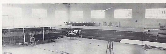
O tema do Assex será o Petróleo, numa alusão a atual política energética do país