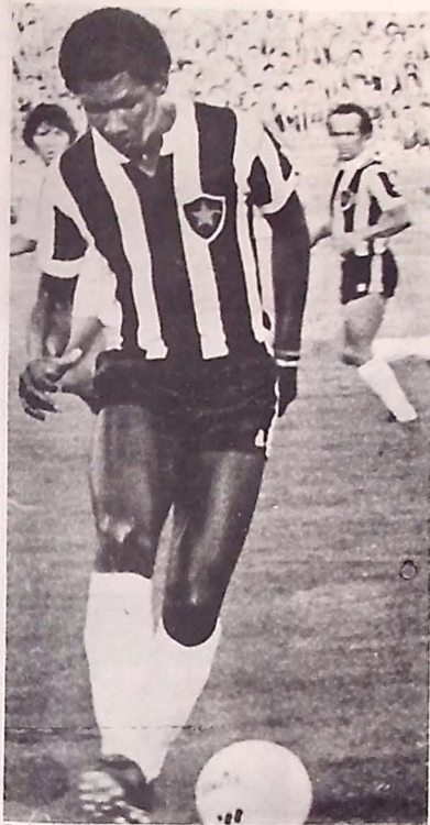
Botafogo joga com o Central amanhã em Caruaru