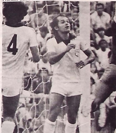
Treze terá mais reforço para sua zaga