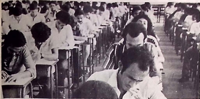
Hoje, em Campina, Sousa e Patos, 3.071 candidatos disputam 300 vagas na UFPP.