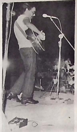
Um som paraibano