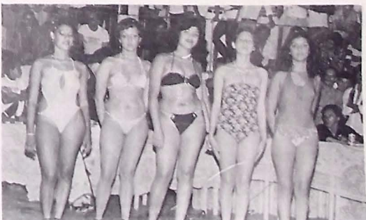
Muitas candidatas disputaram o reinado da folia em Campina