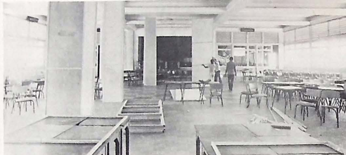
O Astréa vai homenagear a Astrologia, a partir dos 12 signos da tábua zodiacal