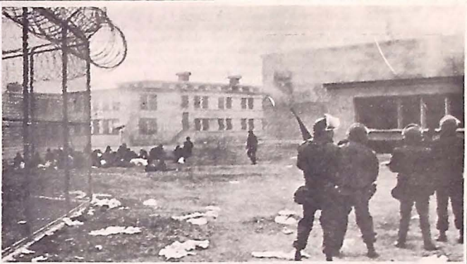
Trinta e dois cadáveres encontrados no interior de presídio no Novo México