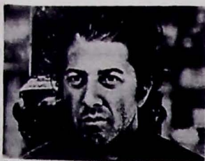
Dustin Hoffman, ator de 'Todos os Homens do Presidente'