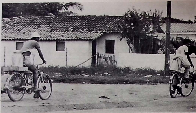
Mesmo proibido, o leite "in natura" é vendido abertamente pelas ruas

Finaliza o documento que as colocações do sr. Governador deixam sob suspeita a atual administração da Universidade, quando foi questionado os processos e critérios de admissão de professores no seu quadro de educadores.