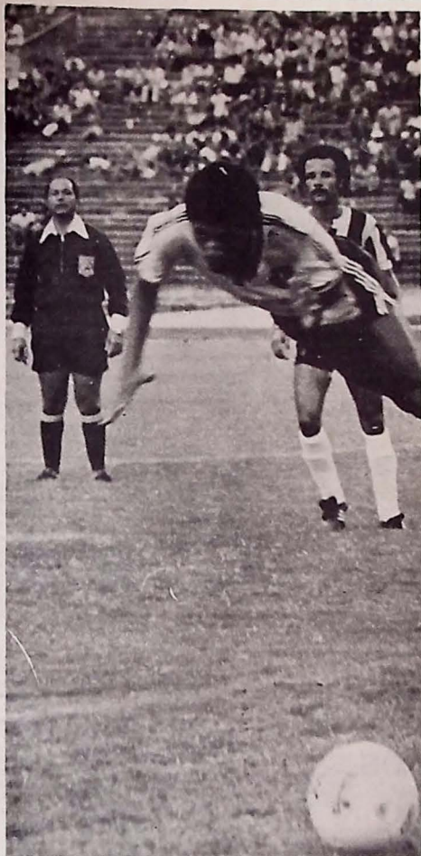
Botafogo propôs jogadores por empréstimo ao tricolor

Para começar a trabalhar é preciso dinheiro, e isso a FPF não tem. Cofre vazio. Onde foi o dinheiro? Onde foi para comprar a grana? Posso entender o que penso? É um ende está... Escrito de qualquer maneira ninguém possa ler, agora, a solução é encontrar para ver se encontra dinheiro. Oh! Quando tem gente que quer indenização o quanto com qual dinheiro das companhias...?