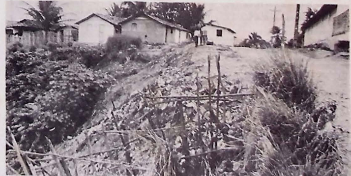
Lixo, fedentina e buracos enormes formam o panorama das ruas do Cristo Redentor