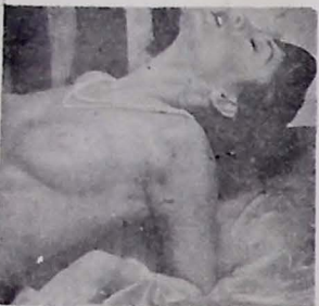
Helena Ramos em "Mulher, Mulher"