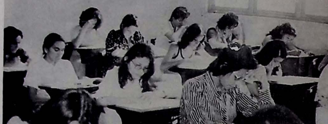
O resultado do Vestibular será divulgado antes do carnaval

Declara, finalmente, que aqui será tentada a plantação da ceringa, como tentada a extração do fundo que prejudica a árvore nativa da região Norte, chamada, a demanda, como fonte de economia e de energia. A tentativa é encaráda como das úldias para o Nordeste e, especialmente para a Paraíba, se a ceringa vier a ser aprovada em nosso meio.