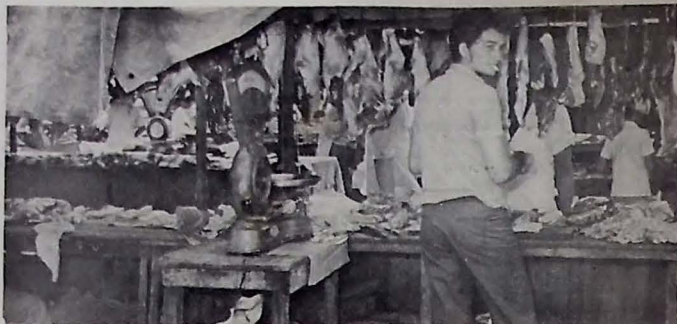
Açougueiros dizem que venda de carne verde continua normal, apesar de boicote

Algumas pessoas que se sentiam prejudicadas, inclusive, no Banco do Brasil, chegaram a sugerir que se pusesse uma caixa ou mais, especialmente para atender os pensionistas do INPS e outras instituições, deixando os demais caixas para o atendimento comum ao público, do contrário, ninguém conseguia ser atendido, havendo pessoas que chegaram na agência varadouro do Banco do Brasil às 9 horas e só conseguiram sair depois das onze.