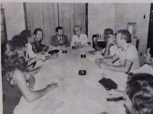
Sunab e dirigentes de clubes fixam preços para bebidas e tira-gosto