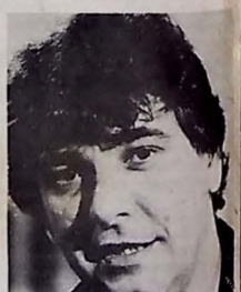
Dolabella vai a Portugal

Na Rede Globo, Rio, o assunto é carnaval. Começam os planos para os festejos moçambicanos. Com quem já bem definido está o pessoal do Planeta dos Homens , pelo menos o seu elenco feminino. Todas sairão numa ala deslumbrante da Escola de Samba Imperatriz Leopoldinense, que tem como carnavalesco o Arlindo Rodrigues, condrôlogo do Sítio do Picapau Amarelo . Além de Imperatriz está decidida a desfilar com toda a pompa. Entre os seus destaques, o casal Gisele e Ricardo Amaral.