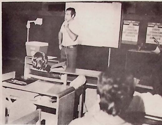
Argentino quer universidade bem administrada

No Colégio Estadual de Cruz das Armas, o mesmo desempenho vem sendo posto em prática pela Diretoria, não faltando amontoados de carteiras que estão sendo consertadas.