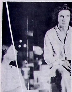
Bye Bye Brasil, no Municipal