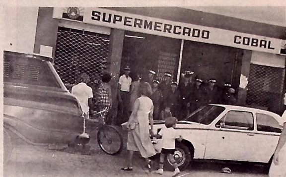
Cem policiais são mobilizados para evitar saques em Patos, inclusive a Cobal

PROVAS. Desde ainda, que existem perspectivas das provas serem realizadas antes da segunda quinzena do mês de julho, quando os candidatos prestarão exames de Direito Penal, Direito Civil, Direito Processual, Direito Administrativo, Direito Judiciário, Direito Trabalhista, entre outras disciplinas.