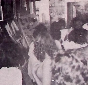
No stand da Telpa, fotos e equipamentos expostos ao público