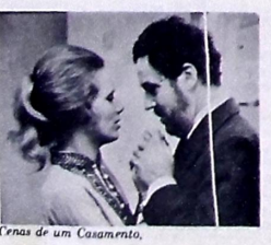
Cenas de um Casamento

Cotações: ruim *** regular *** bom **** muito bom ***** excelente.