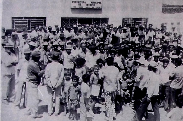
Os agricultores estão trabalhando por conta da Prefeitura, enquanto a emergência não começa