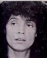
Sônia Braga, a Gely