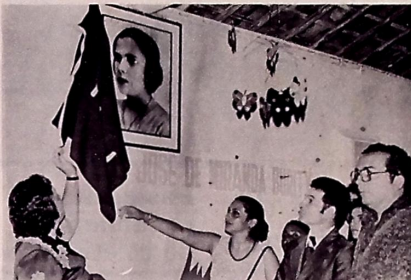
O Governador Tarcísio Burity inaugurou a creche ontem à noite

Para isso, o Ministério de Educação e Cultura já concedeu um adicional de seis milhões de cruzeiros, segundo informou ontem o subsecretário de Educação, Arlindo Delgado.