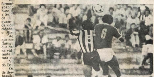
Barauínas viaja hoje para jogar amanhã diante do Barauínas, em Mossoró