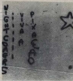
Um dos "slides" de João Artur

Para sua apresentação no Complemento Nacional, em Campina, ele levará também os slides do fotógrafo paraibano João Artur: um ensaio sobre pichações de muros em São Paulo.