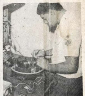
Um Especialista da Força Aérea Brasileira, em plena atividade. Todos os anos mais de mil técnicos nas mais diversas especialidades se incorporam a Força Aérea Brasileira.

A "Corrida das Praias" homenagem ao 16º Aniversário da Revolução Democrática Brasileira de 1964, e ao 1º Ano do Governo Civil de Miranda Burity.