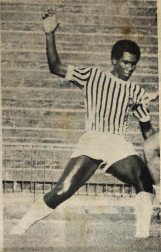
Botafogo tenta hoje no Recife a segunda vitória na Taça de Ouro