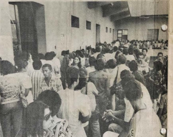
Os candidatos ao Supleti terão que ir buscar seus cartões

O denunciante informou à reportagem ainda que o pão rejeitado tem um aspecto murcho e exala um mau cheiro, que o deixa totalmente em comestível, pois a massa no interior do produto aparece como uma massa quase pastosa e escura, deixando qualquer um com repugnância de utilizá-lo nas refeições. Com este mau atendimento, além dos moradores do conjunto Costa e Silva, os compradores que tinham as suas próprias barracas ou armazinhos e que faziam também a distribuição do pão vendido pela panificadora, deixaram de comprar o produto, alegando má qualidade do mesmo.