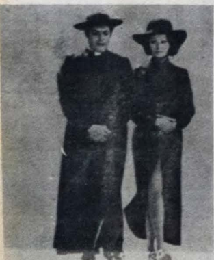
A Mulher do Padre, amanhã no Tambaú

COTAÇÕES: * ruim ** regular *** bom **** muito bom ***** excelente. Eventuais alterações nos programas são da inteira responsabilidade da companhia exibidora.