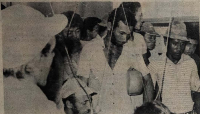
Lixeiros voltaram ao trabalho