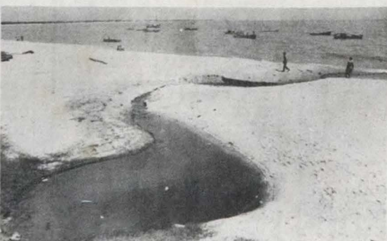
Com o reinício das aulas, os banhistas abandonaram as praias

Ultimamente o apelo maior dos banhistas ainda restantes é quanto à sujeira reinante na praia, a poluição e os picheiros atirados dos navios que muito irritam as pessoas que cuidadosamente estiram suas toalhas na areia para um descanso ou se dirigem ao mar e voltam com seus pés cobertos dele. Sendo proibido os navios atirarem o piche nas praias.