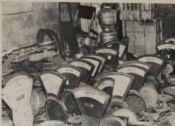
Todas as balanças irregulares serão apreendidas pelo IPEM