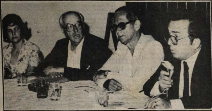
mas não foi impossibilidades físico-climáticas e muito menos humanas, derivadas da mestiçagem do homem nordestino em sua consequente incapacidade para o trabalho.

Então, se o Nordeste chegou ao ponto deplorado por A Paraíba e seus Problemas