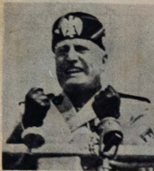
Os Últimos Dias de Mussolini