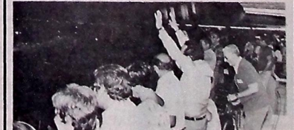
Durante o jogo ele ficou vibrando junto com a galera

O governador Tarciso Burity, segundo os observadores esportivos, está dando motivos de que realmente pretende ajudar o futebol da Paraíba, sobretudo agora, quando ocupa um lugar de destaque no cenário futebolístico nacional. Isso ficou provado com sua presença no jogo Botafogo x Internacional. O governador se uniu aos torcedores e vibrou com a vitória do time paraibano. Logo após o jogo, Burity esteve no estádio do Botafogo e cumprimentou os jogadores e (na foto, apontando a mão do capitão do time, Zé Eduardo), prometeu concluir as obras dos estádios, principalmente completando os lances de arquibancadas, porque ficou provado durante o jogo, que o espaço é pequeno para suportar um grande público.