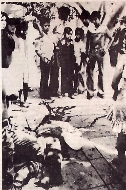
San Salvador. - Ao meio dia de ontem, no centro desta capital foram tomadas duas emissoras de rádio e horas mais tarde quando um outro grupo subversivo tratou de tomar uma das difusoras para transmitir uma mensagem de suas ações, foram repellidos por elementos da segurança resultando um subversivo morto e um oficial da polícia ferido.

O decreto presidencial dá uma definição de produtividade: "o acréscimo de produção que se refere o artigo 3º de § 2º do decreto ao aumento da produção decorrente apenas do melhor desempenho do trabalhador". Cada empresa, percentuais diferentes de taxa de produtividade para os empregados, sendo que, no caso de alguns artigos, poderá ser escalonada, como aliás, tem acontecendo em diversos acordos, geralmente dando-se maior para os que estão nas faixas salariais mais baixas.