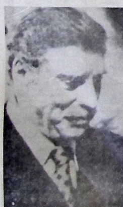
Lancaster, ator de Inferno Sem Saída

Eventuais alterações nos programas são da inteira responsabilidade da companhia exibidora.