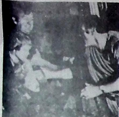
O Destino do Poseidon: no Municipal