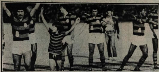
As Campinense, só a vitória interessa no jogo de hoje, em Mossoró, com o Baraúnas

O time santista quer acabar com o cartaz