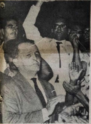
Carlos Prestes em 1945