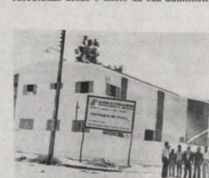
O grupo oferecerá cerca de 10 mil vagas

Além do grupo, o prefeito inaugurará a pavimentação de dezenas de ruas, a sede própria da Câmara Municipal o posto médico de Tambá e outros obras executadas desde o início da sua administração.