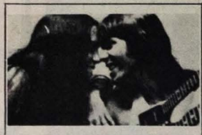
Baby e Pepeu como autores

"E, quando chegar ao auditório, o jurado ganhará uma ficha impressa por computador, com a relação dos concorrentes e espaço para