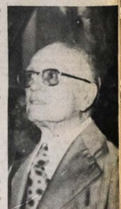
A sessão se realizará às 16 horas