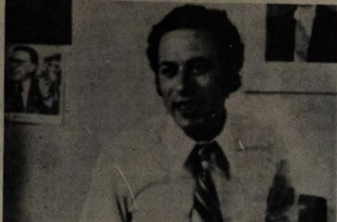
Marchezan pode examinar com Freire o voto distrital