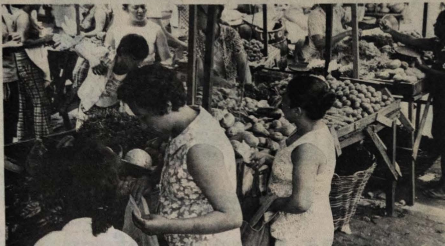
Os produtos hortifrutigranjeiros são vendidos a preços exorbitantes nas feiras livres de João Pessoa

A rua Salvador Batista de Melo, no bairro dos Estados, está invadida pela lama. Sem condições de escoamento, a referida artéria recebe as águas das encostas que ficam paradas, fazendo surgir focos de insalubridade enquanto o lamaçal está em um odor insuportável, que invade as residências e deixa os moradores respirando um ar putrefato e doentio.