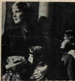
A Noviça Rebelde