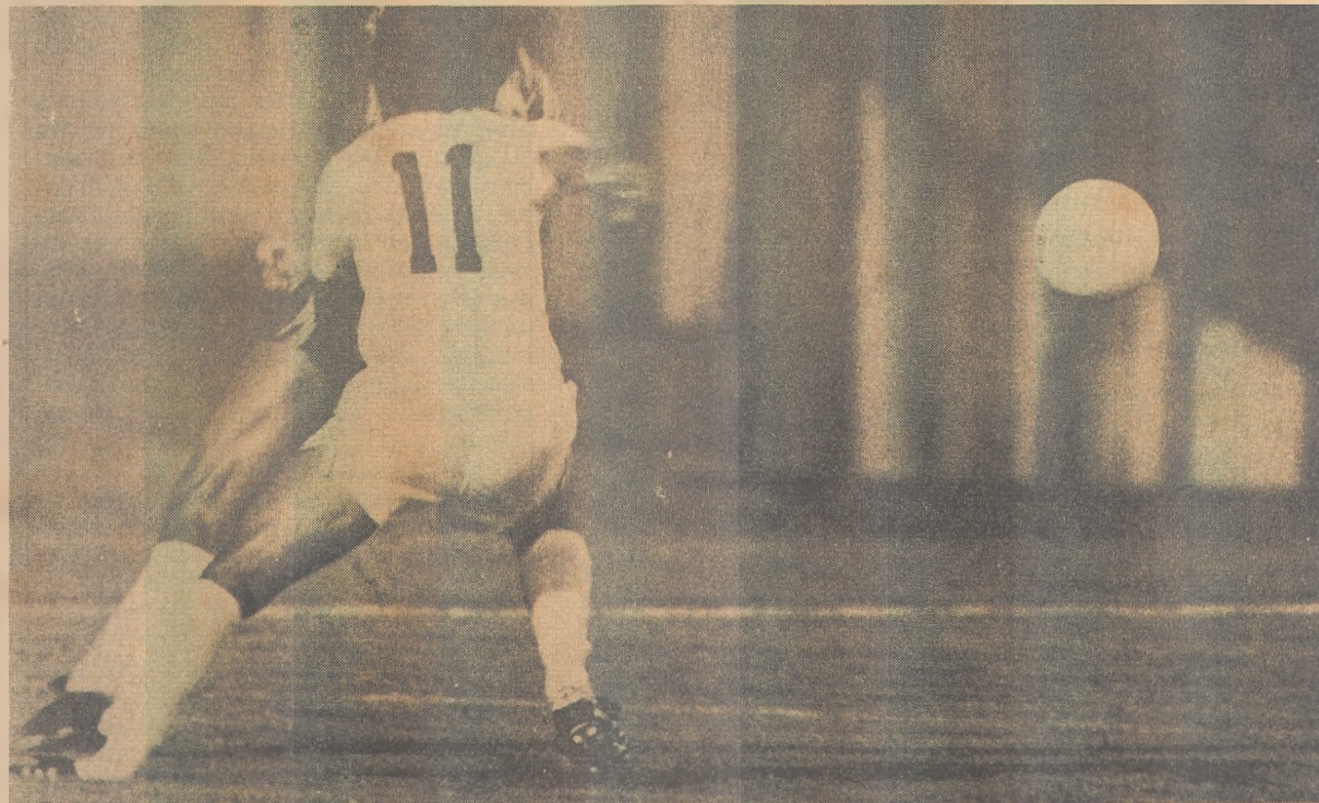
O quadrangular decisivo terminará no próximo domingo com mais duas partidas