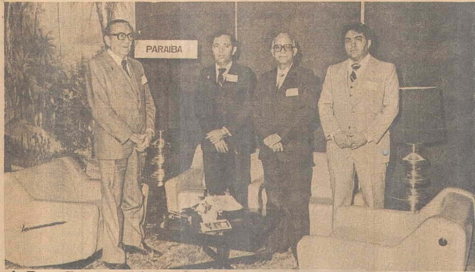
A Paraíba participou do importante Encontro

A inédita competição será iniciada às 07:30 horas, em ponto, do Parque Solon de Lucena e no seguinte percurso: avenidas Getúlio Vargas, Duarte da Silveira e José Américo de Almeida; Cabo Branco, Tamandaré, João Maurício e Flávio Ribeiro, estrada de Cabedelo até a av. Epitácio Pessoa, praça da Independência, av. Maximiliano de Figueiredo e Getúlio Vargas, até o Parque Solon de Lucena.