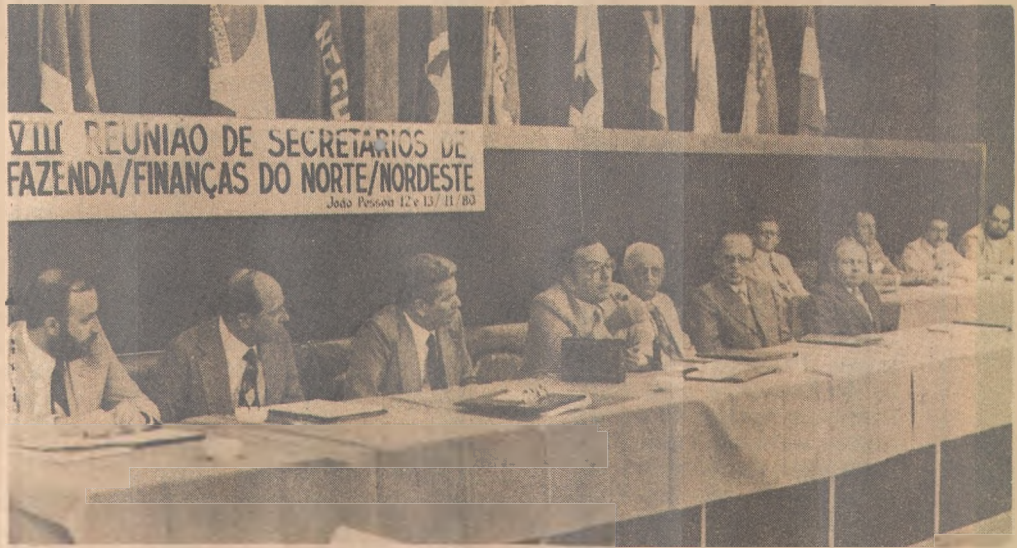
O governador Tarcísio Burity abriu a reunião de secretários

Sobre o atual sistema tributário nacional vigente no País, argumentou o sr. Tarcísio Burity que "entendemos que deva ser reformulado pela experiência que se tem desde 1967 até esta data. Nesses treze anos de vigência - justificou sua posição - está mais do que constatado que o sistema de ICM não atende as necessidades dos Estados". Entre outras alterações na política tributária, defendeu o governador a elevação do Fundo de Participação do Estado e o Fundo Especial de 8% para 15% na Receita Federal, bem como o restabeleci-