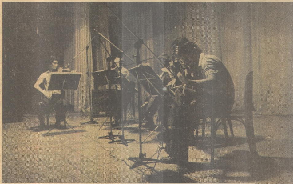
O Quinteto Itacoatiara mostra "Visões Sertanejas" no Campus