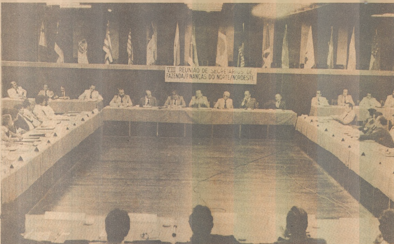
Burity abriu, ontem, no Hotel Tambaú, reunião de secretários de Finanças do Norte/Nordeste