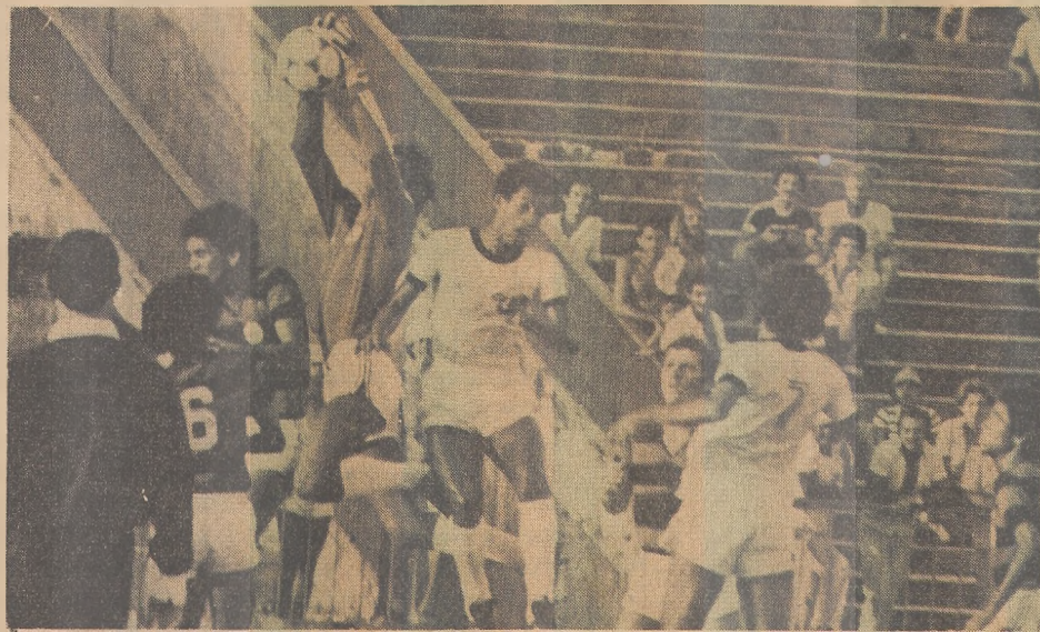
Botafogo e Campinense vão decidir o Campeonato deste ano