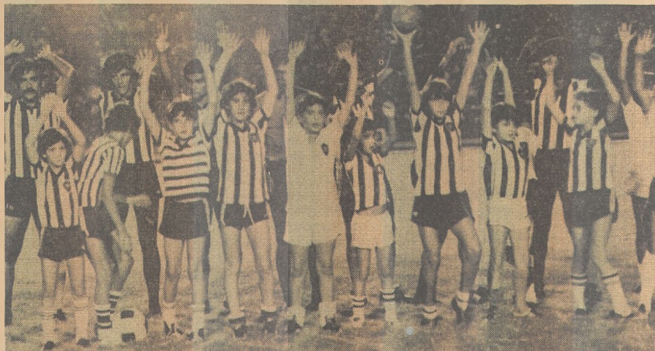
No Botafogo, já não se vê mais alegria. E a decisão vem aí