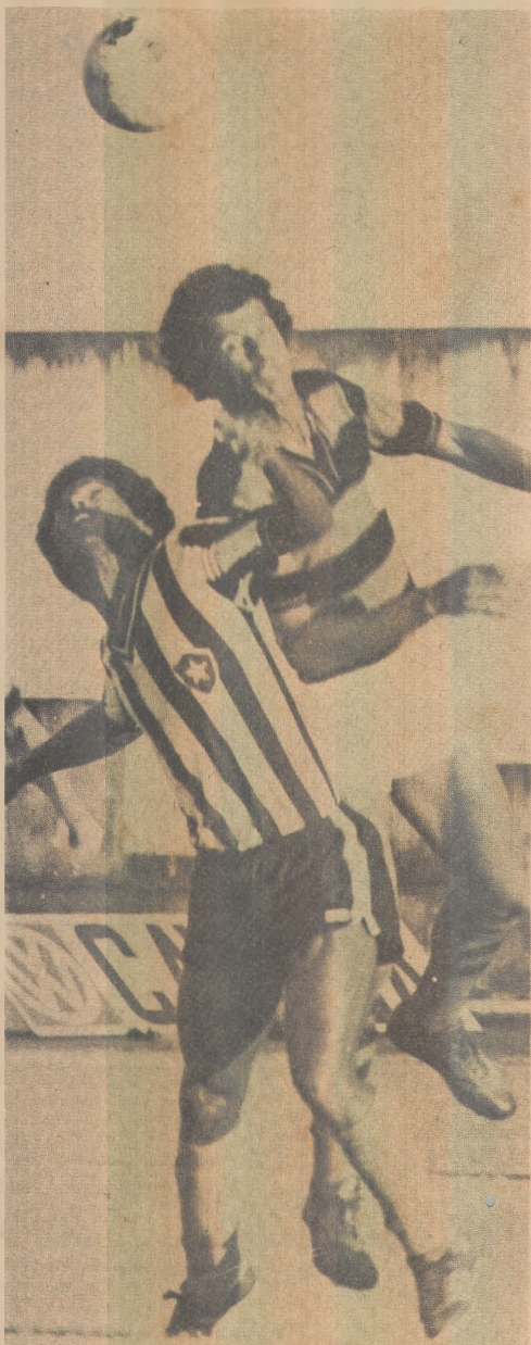
Um desses será o representante no Copão