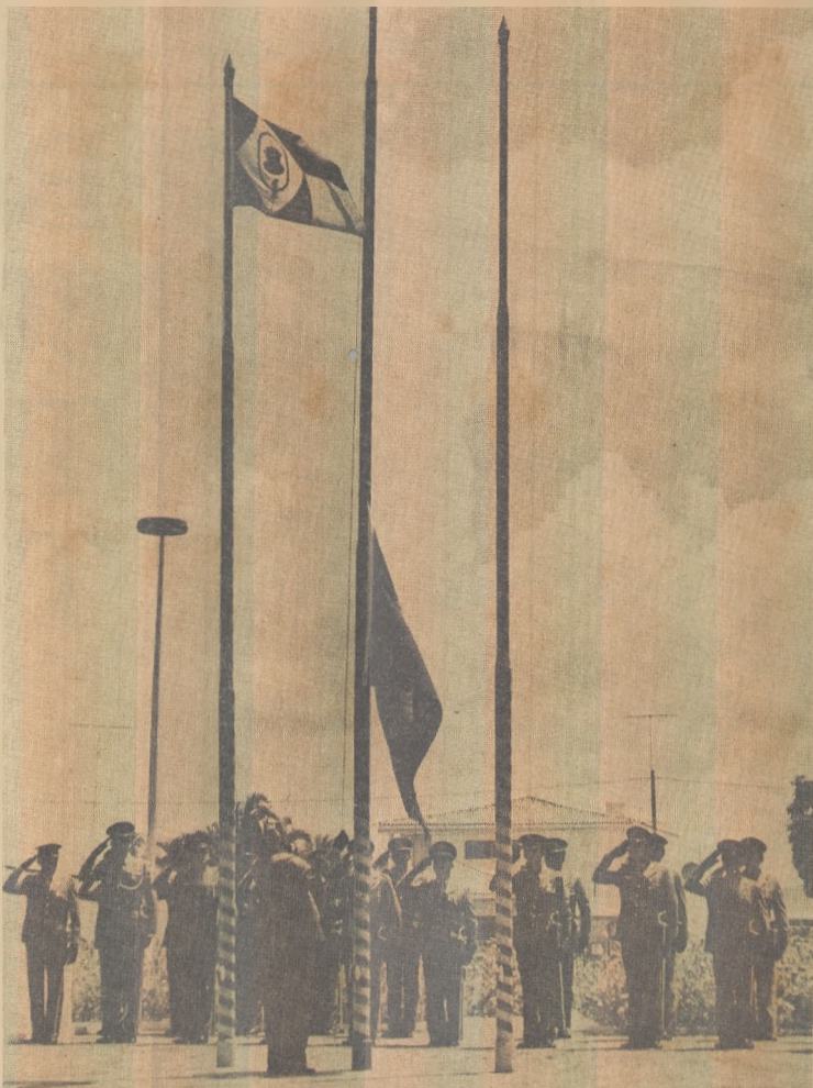
Dia da Bandeira foi marcado com promoção de 4 aspirantes

A promoção é da Coordenação de Cursos e Programas de Extensão da UFPb através da PRAC e Departamento de Fundamentação de Educação, com apoio da Associação dos Orientadores Educacionais do Estado da Paraíba (ASSOREP). Os recursos didáticos serão efetuados com painéis, exposição dialogada, relatos de experiência na área e apresentação de slides sobre desenvolvimento sexual, num total de 24 horas de aula. Poderão participar administradores escolares, orientadores educacionais, psicólogos, psiquiatras, assistentes sociais, professores, religiosos, médicos, pais e demais pessoas interessadas, que podem inscrever-se no citado Departamento ou na Coordenação de Apoio Técnico-pedagógico, no 5º andar do Centro Administrativo, Bloco I.