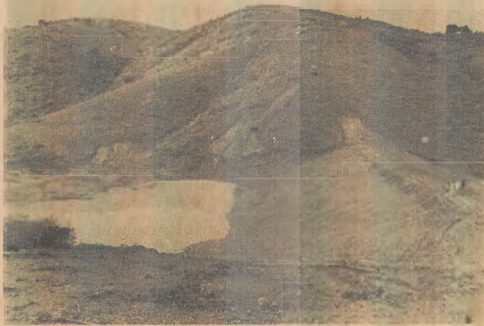
Sudene revela bom acabamento dos açudes paraibanos