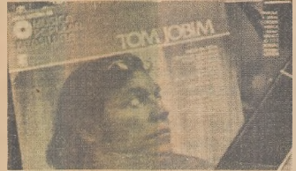
LP's de "Astros da MPB"