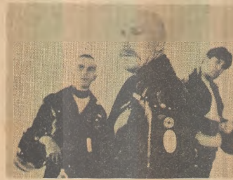
Mad Max, cartaz do Plaza