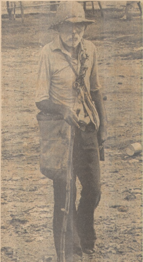
Campanha alerta sobre mendicância