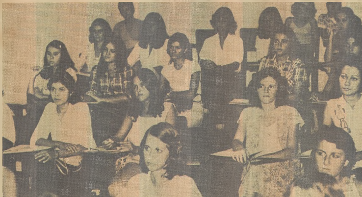
Até o início de dezembro a Pb-Tur prepara os guias turísticos

O encerramento e a entrega dos diplomas, de conclusão do curso será a 13 de dezembro dentro da programação da Semana do Turismo a ser promovida pelo Governo do Estado através da PB-TUR.