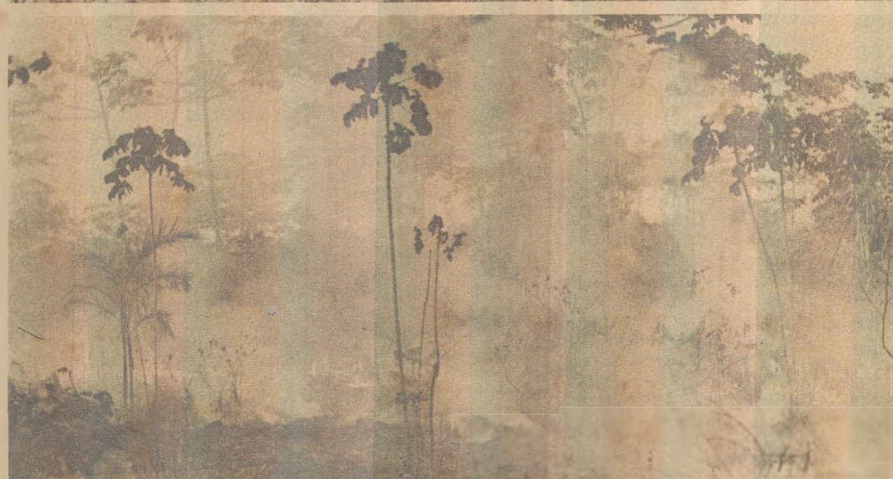
Bombeiros apagaram fogo com foices pois os carros-pipa não passavam pelas cercas