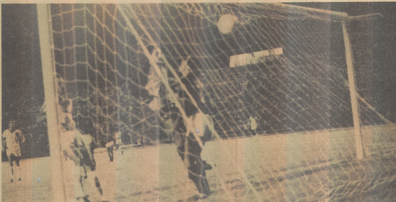
Botafogo foi mais time do que o Campinense, mas não soube aproveitar as chances

Ninguém teve condições de apontar um culpado pelo incêndio, presumindo-se que as chamas se formaram depois que um passageiro soltou alguma ponta de cigarro no capim seco que forrava a terra. Depois do fogo, os dois hectares destruídos pareciam um campo de futebol. Os prejuízos foram mínimos porque não havia um só porco na pocilga.