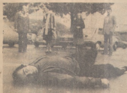
"Sangue e Violência"