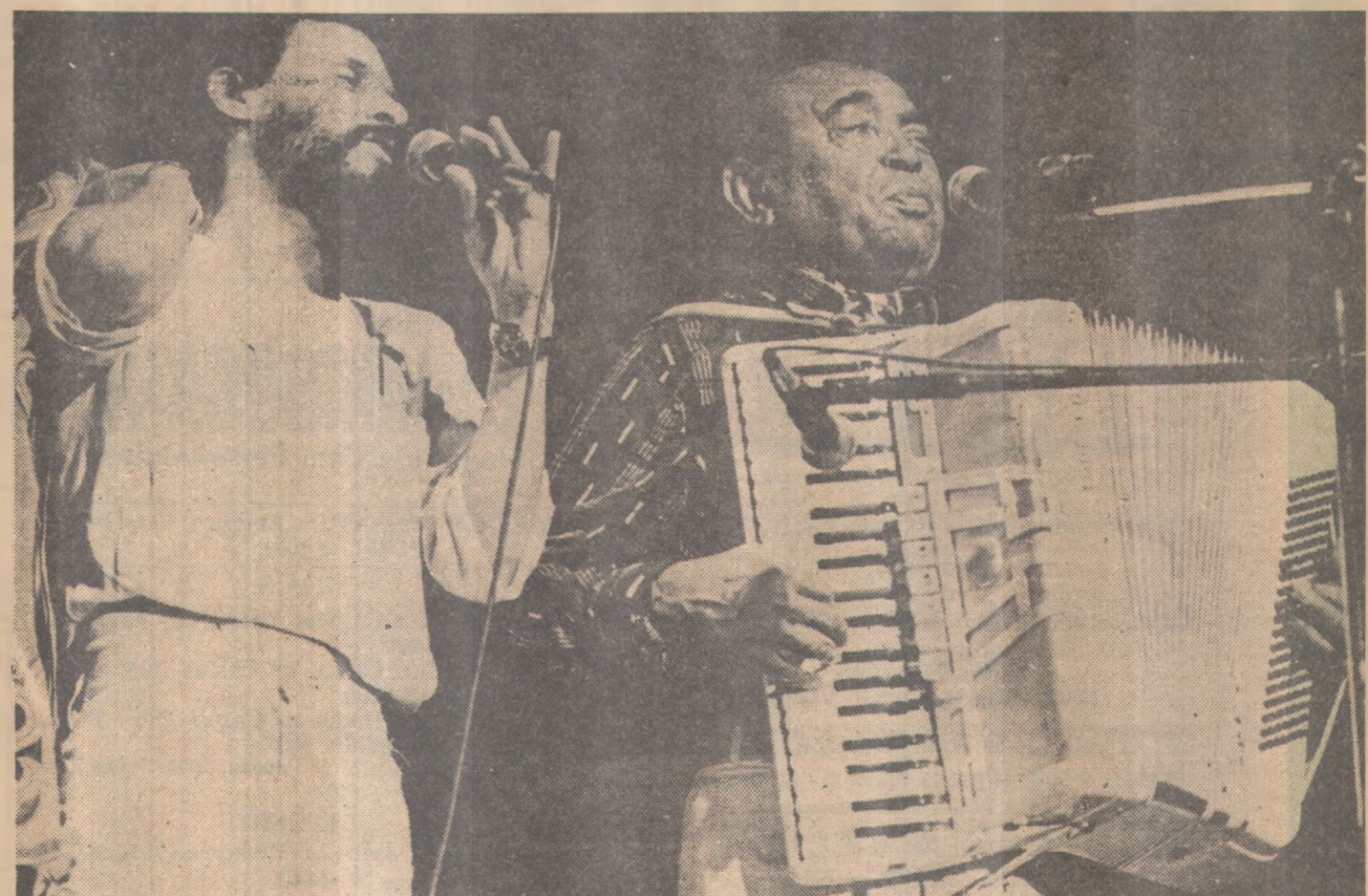
O filho e o pai farão a massa vibrar amanhã à noite em João Pessoa

Com grande êxito, A Vida do Viajante já fez apresentações em várias cidades do sul do país. As últimas foram em Brasília e Belo Horizonte. Amanhã será a vez de João Pessoa, no Astréa, e sábado próximo em Recife.