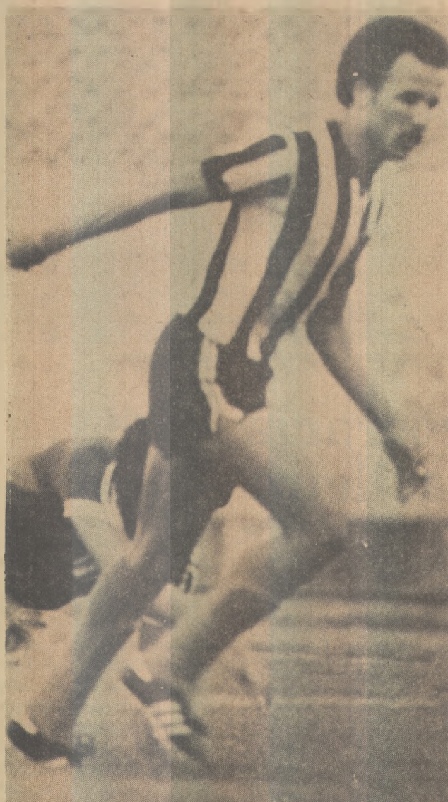
Magno não recebeu mês de setembro

A mesma briga acontecerá no estádio Leonardo da Silveira (Graça), onde o Santos jogará com o Treze. O Galo precisa vencer para se reabilitar dos insucessos anteriores, sendo que ao Santos, somente a vitória interessa, na luta para não ser rebaixado.