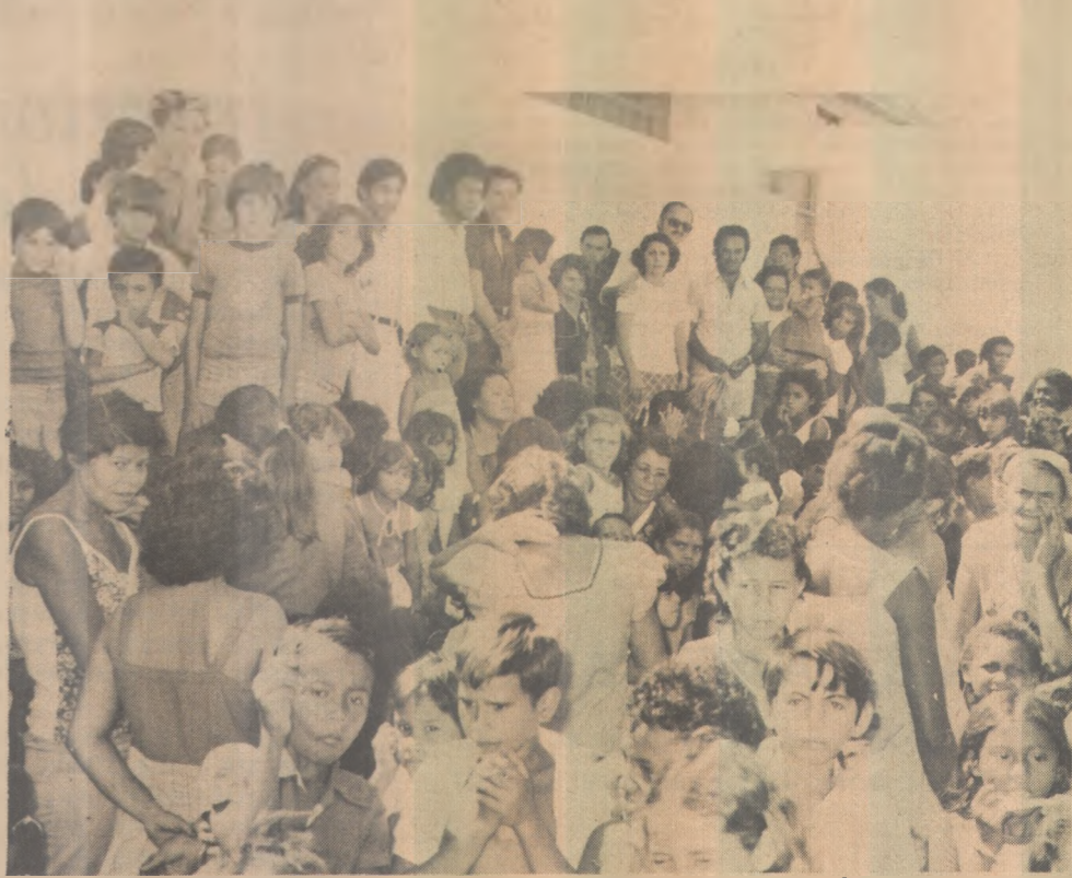
Homenagem ao Dia da Criança no Centro Social Urbano

Dirigiu agradecimento a todos quantos colaboraram para a realização da festinha, principalmente os pais de famílias que ao CSU se fizeram presentes.