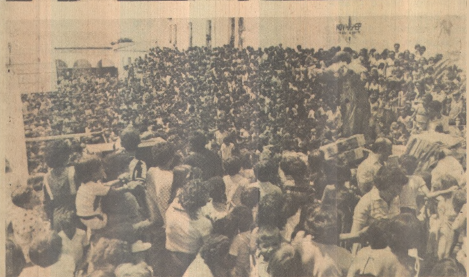
D. Glauce leva campanha em favor do menor a quatro municípios