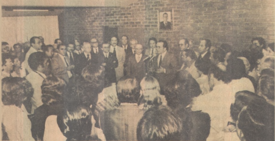
O governador Tarcísio Burity inaugura a Paraiban Imobiliária

Lembrou também que ontem esteve em contato com o ministro do Interior, Mário Andreazza, que, por telefone, assegurou o envio de recursos prometidos e disse que, para evitar a interrupção do preparo da área onde será construído o conjunto, conseguiu 10 milhões de cruzeiros do próprio Estado para que as obras não fujam ao cronograma já determinado.