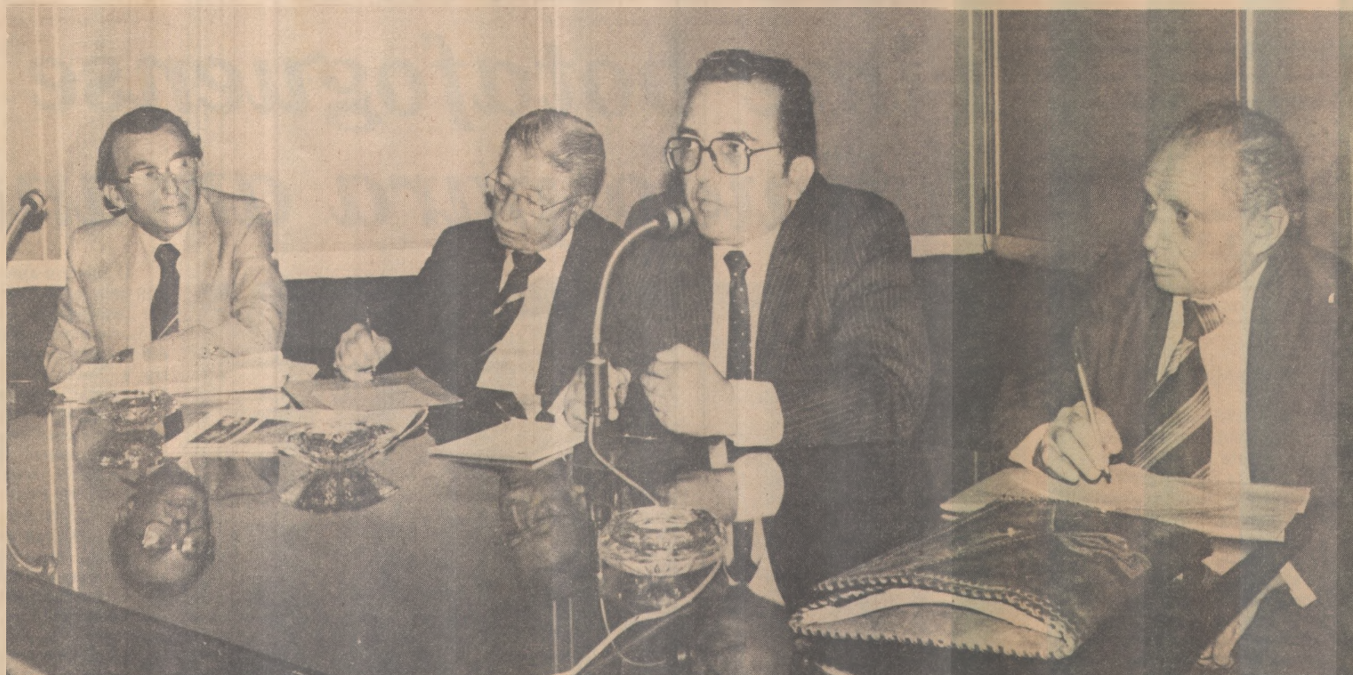
O governador reúne auxiliares e anuncia uma série de medidas destinadas a reduzir os gastos do Estado com combustível

Na entrevista coletiva, o governador Tarcísio Burity anuncia as medidas e explica seus objetivos. Na íntegra, as declarações do Chefe do Executivo: