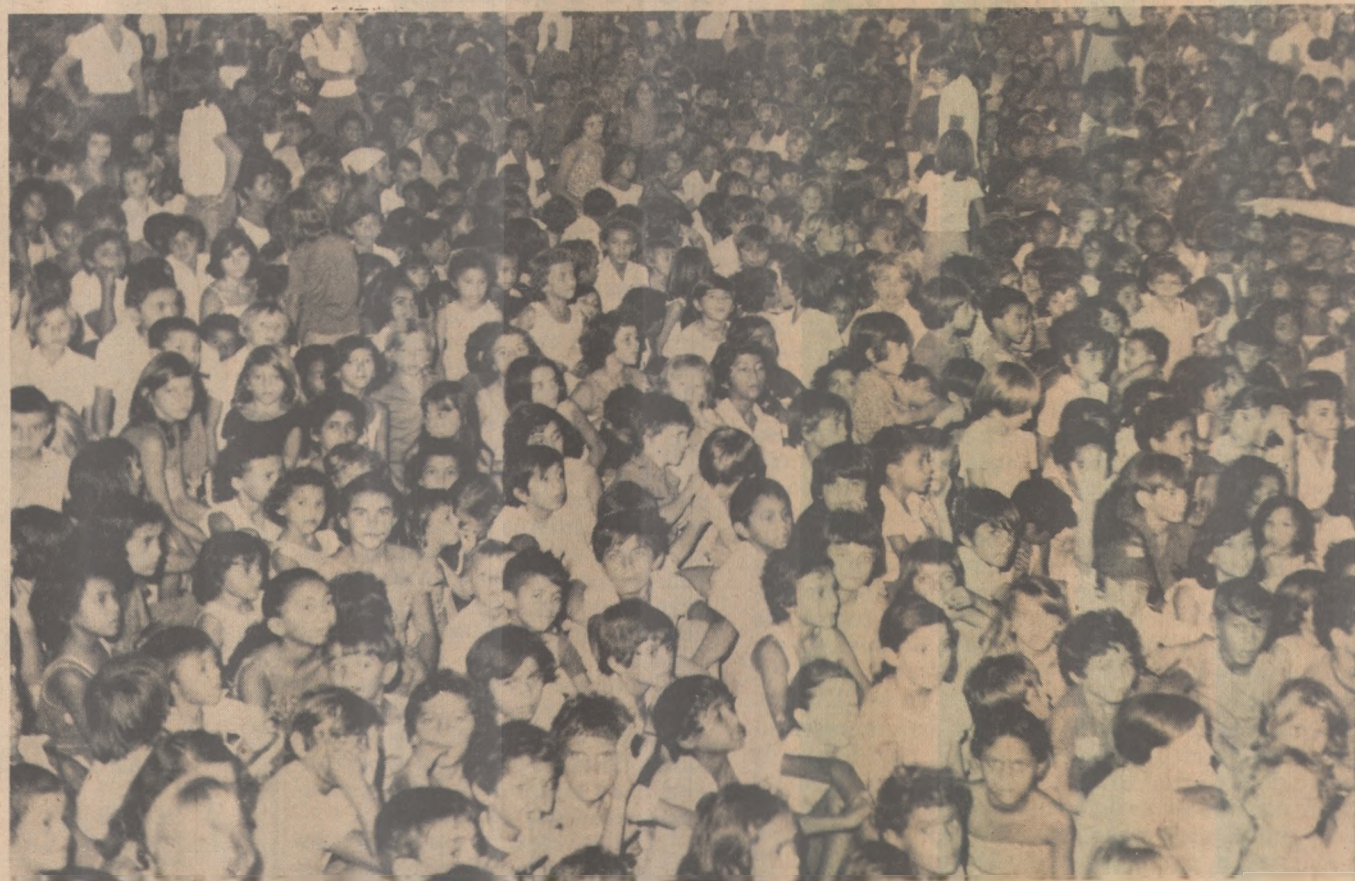
Crianças esperando receber os prêmios da primeira dama do Estado