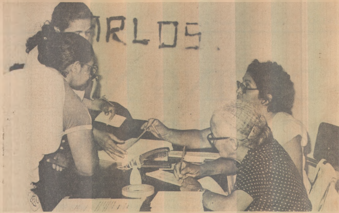
O Lyceu já está inscrevendo os candidatos que serão selecionados para o 2º grau

A Medalha de Distinção poderá ser concedida: Aos Secretários de Estado; aos Magistrados que se tenham notabilizados nos estudos do Direito; aos Membros do Ministério Público e Advogados que militam no foro há mais de 10 anos e que tenham reconhecida cultura jurídica. A Medalha de Bons Serviços poderá ser concedida aos funcionários do Tribunal de Justiça e Serventuários com mais de 10 anos de serviço.