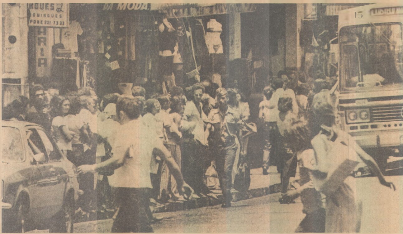
O comércio registra maior movimentação pela manhã, em função do expediente corrido

Para promover a implantação do programa que beneficiará 100 mil famílias de trabalhadores, a Secretaria de Indústria e Comércio, com o apoio da Secretaria do Planejamento, vem desenvolvendo contatos junto à Sudene e destilarias da Paraíba.