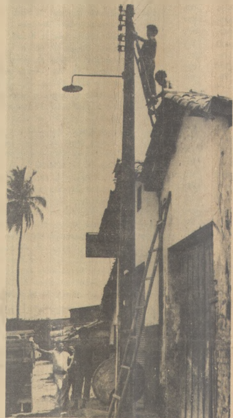
Oficinas mecânicas sem energia

Todas as pessoas que trabalham no Serviço de Apoio ao Migrante fizeram curso preparatório na Sudene, com o objetivo de adquirir subsídios para um melhor entendimento das necessidades mais prementes dos que procuram um meio para evadi-se para outras regiões.