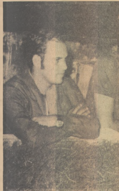
Treze promete pagar bicho alto ao Santa