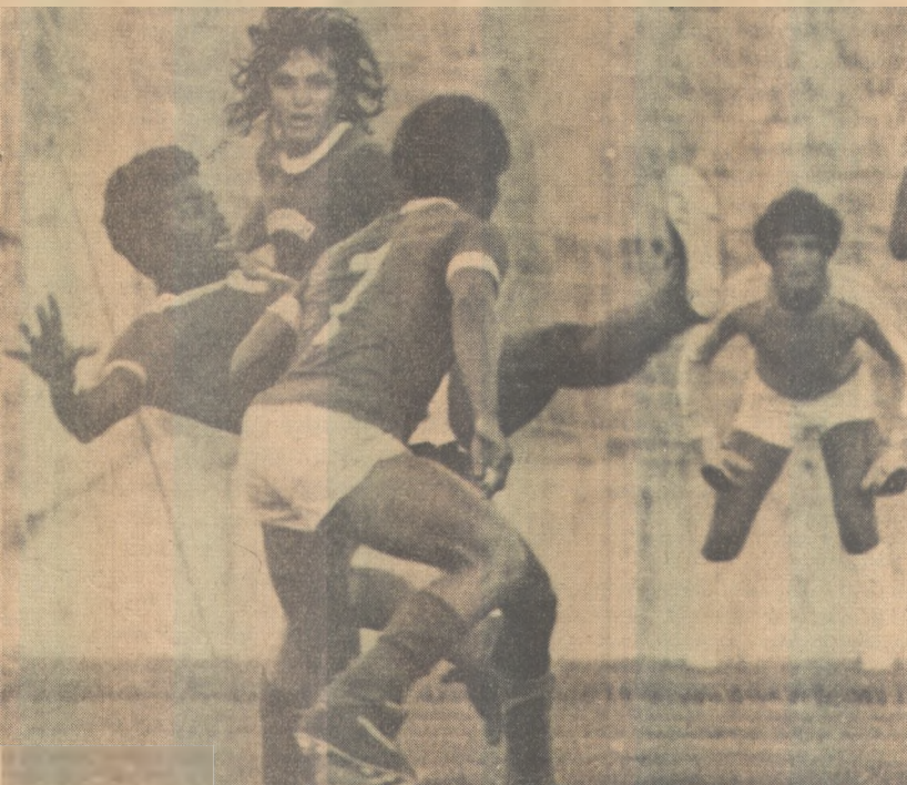
Objetivo do Auto é terminar em 1º lugar