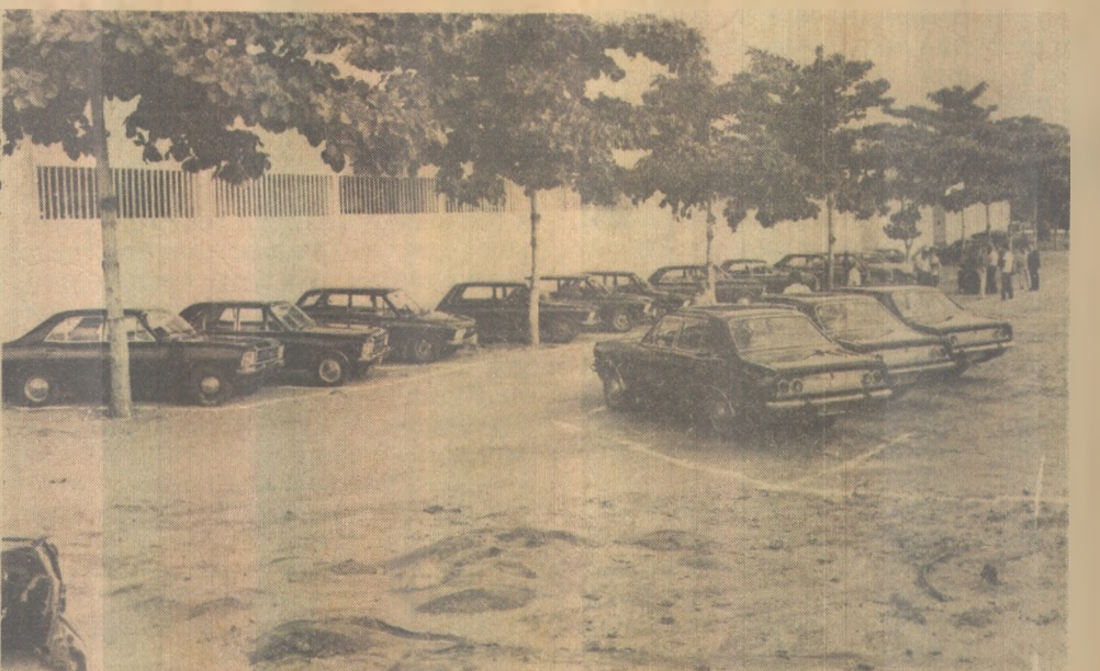
Os veículos do Estado são recolhidos ao quartel dos Bombeiros

Os dois primeiros carros a chegarem ao pátio do Corpo de Bombeiros foram da Pb-Tur e Instituto de Previdência do Estado da Paraíba - Ipep, a partir de 10 horas da manhã, sendo entregues ao tenente Alves, de plantão naquela unidade militar. O fluxo de recolhimento cresceu quando se iniciou o expediente nas repartições públicas - 12 horas.