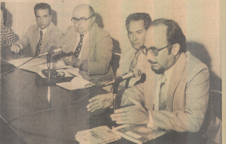
Denari condena alguns requisitos da lei da dívida ativa da União

Ele ainda fez elogios a alguns itens dessa Lei, como a que simplifica o processo de cobrança de Dívida Ativa e, por exemplo, que a citação dos devedores da Fazenda Pública é feita através dos Correios. Mesmo assim, sem querer afirmar se estes seus encontros são a título de incentivar os tributaristas contra a Lei, ele deixou claro que esse fato, de modificá-la, não que não estiver de acordo com a classe, caberá ao Poder Judiciário estudando todos os rigores da Lei nº 6830.