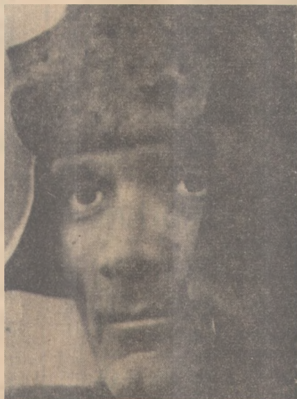
Pasolini, autor e personagem

Bello Horizonte, 20 - "Presidente Oswaldo Aranha - Porto Alegre - Cinco academicos paulistas sahidos de São Paulo no dia 11 para alistar-se em nossas fileiras informam que naquella capital se ignora completamente a marcha dos acontecimentos. Os batalhões perrepietas são formados por operarios desempregados e colonos sem trabalho com promessa de pagamento a 10$000 por dia e permanencia na capital. Depois de alistados são remetidos para o interior. Estudantes e empregados de outras categorias não attendem ao alistamento. No Rio o governo mantém rigoroso sigillo só permitindo noticias redigidas pelo Cattete. Todos receptores de ondas curtas foram apprehendidos. Até a officialidade superior ignora os acontecimentos. O general Tourinho, chegado a Juiz de Fóra conduzindo reforços, ignora completamente a realidade. Temos agora provas de que a resistencia das unidades federaes de Minas foi em grande parte devida ás informações criminosamente falsas do ministro da Guerra. Avioes nossos estão lançando sobre Juiz de Fóra além de boletins com o resumo completo das noticias do movimento. Hoje ocupamos Carinhanhas, tendo fugido a policia bahiana secundada por jagunços. Nossas operações vão bem. Cordiaes Saldações. - Mario Brant".