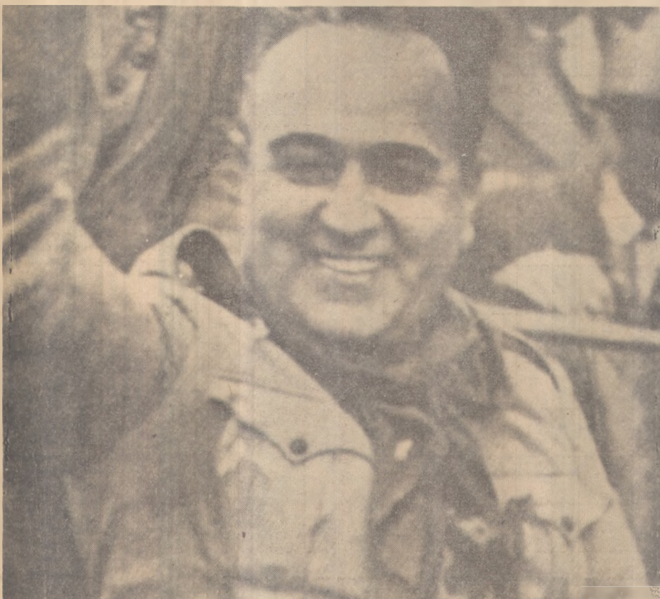
Getúlio Vargas: "A Revolução de 30"