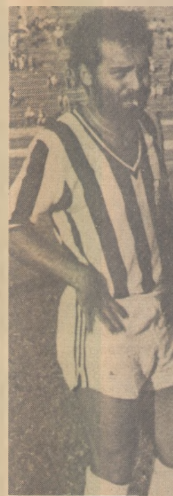
Mozart quer sair

DECEPÇÃO - O Vasco da Gama decepcionou sua torcida ao perder o título do primeiro turno do Campeonato Carioca para o Fluminense. Muito balada e com um time cheio de estrelas, o Vasco acabou sendo superado pela juventude tricolor. O treinador Zagalo que passou a semana toda fazendo mistérios sobre a escalação da equipe a essa altura deve estar lamentando muito a perda da primeira fase e nem a sua famosa estrela conseguiu assustar os meninos do Fluminense.