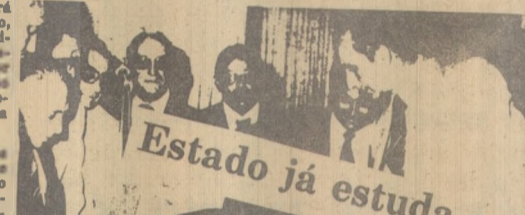
Estado já estuda aumento dos servidores

estudante, os médicos que o Conselho de Ensino e o Conselho de Profissionais de Educação, em reunião com o governador Tarcísio Burity, no dia 27 de setembro, no Palácio do Governo, para discutir o aumento dos salários e a concessão de férias.