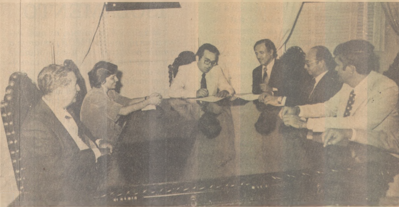
Burity define a construção de casas para novecentas famílias faveladas de João Pessoa