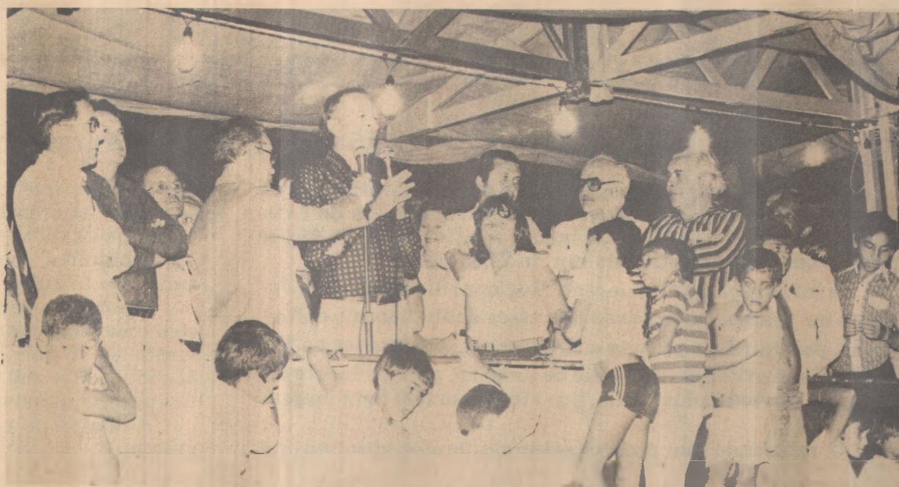
Festa de inauguração do sistema viário de acesso ao conjunto Presidente Médici