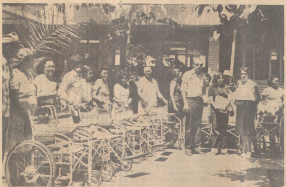
Distribuição das catorze cadeiras de rodas