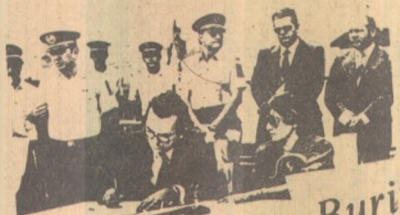
Governador sanciona lei beneficida políca na Paraíba

Nenhum funcionário estadual ficará perdoado, a partir de 1º de setembro, vencimento inferior a 2 mil, 316 cruzeiros, segundo mensagem enviada à Assembleia Legislativa pelo governador Tarcísio Burity, no dia 27 de setembro, no Palácio do Governo.