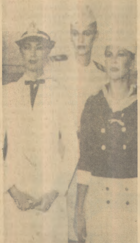
A partir de 1981, moças como essas, estarão envergando os trajes dos modelos acima, como integrantes da Marinha de Guerra do Brasil.

Partindo de quem partiu, demorei acreditar. Mas tudo é possível. Os interesses particulares prevalessem mais do que os de uma comunidade inteira. Aliás isto é muito comum entre as nações. Tadinho do povo.