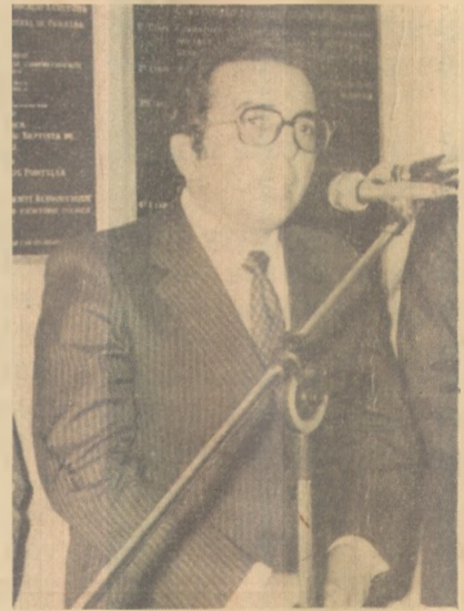
Burity: prioridade para servidor

A preocupação voltada para o bem-estar da classe inclui realizações como aquelas executadas pelo Instituto de Previdência do Estado - a partir dos diferentes serviços oferecidos através das sedes, em João Pessoa e Campina Grande, principalmente. (mais servidor nas Páginas 5 e 12 e Editorial).