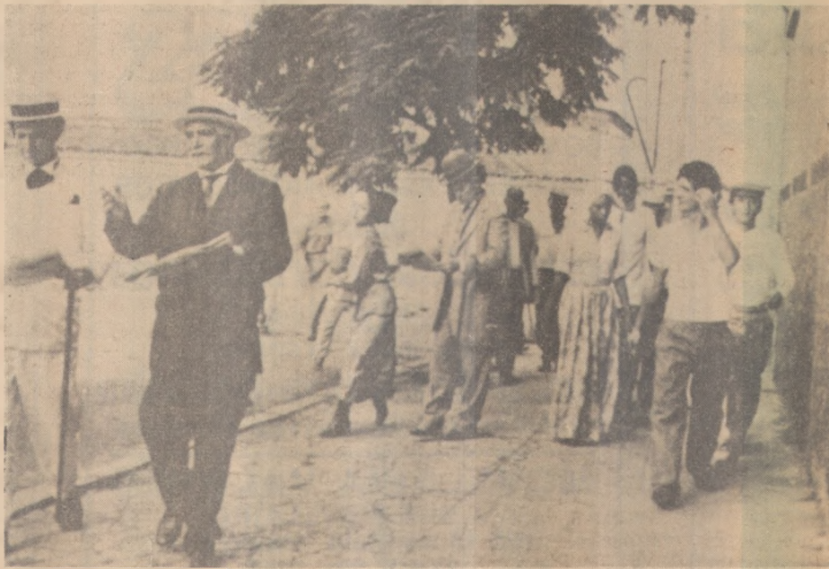
"Gaijin, Caminhos da Liberdade"