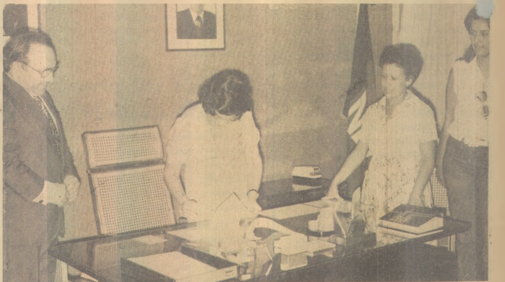
A UFPB firma mais um convênio com a Secretaria de Educação

Quanto à Secretaria da Educação caberá a escolha dos Municípios, além de colocar a disposição da Universidade a rede oficial de Ensino, tomar conhecimento das ações a serem desenvolvidas e repassar à Universidade os recursos provenientes do MEC/SG/PRONASEC/RURAL referentes ao projeto Integração Universidade/Município.