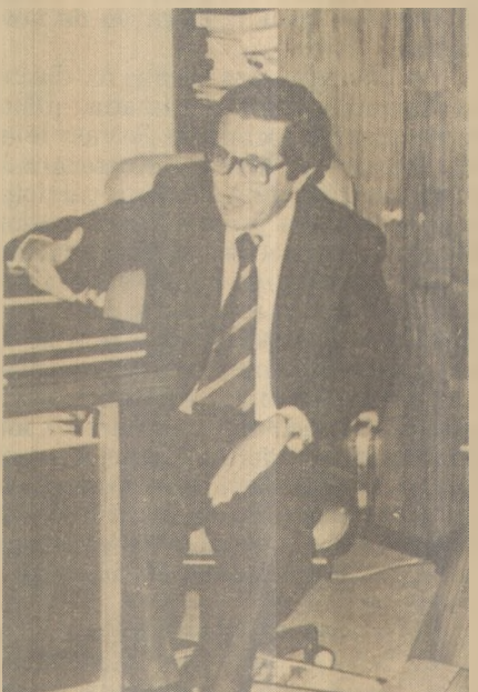
Setor mineral visto por Cabral

De acordo com o artigo 19 da Norma Geral dos Concursos de Prognósticos Esportivos, haverá um prazo de 10 dias, contados a partir desta data para reclamações, as quais deverão ser apresentadas na Av. Camilo de Holanda, 100 - João Pessoa, até o dia 07/11/80. Não serão aceitas reclamações por via postal.