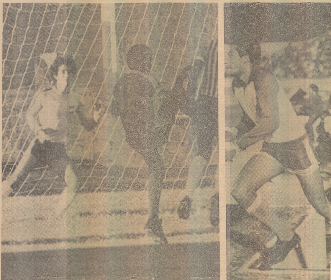
Auto Esporte x Campinense é jogo equilibrado, hoje à noite, no Almeidão

O torcedor pessoense viverá hoje, o início do quadrangular decisivo do segundo turno, com o jogo Auto Esporte e Campinense, às 21 horas, no estádio Almeidão, quando as duas equipes tentarão a primeira vitória nesta nova fase do Campeonato Paraibano, e uma boa arrecadação poderá ser registrada, principalmente pela boa campanha que o Auto vem realizando e sua torcida promete prestigiar-lo.