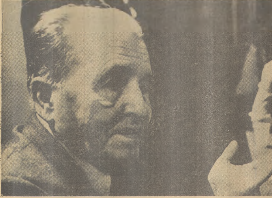
Luiz Carlos Prestes será interrogado pela Polícia Federal