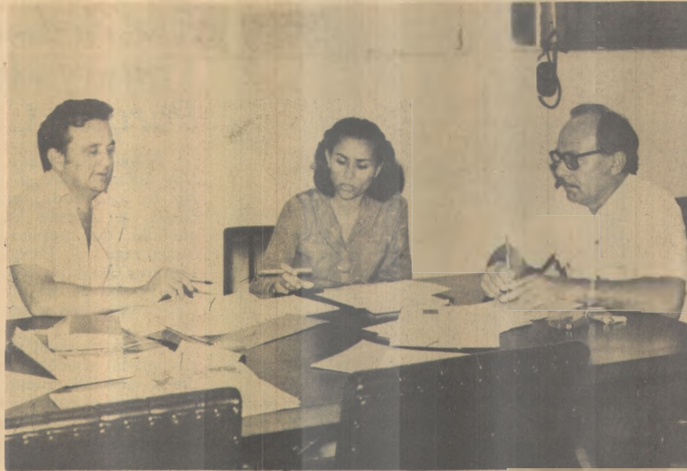
O convênio vai permitir o treinamento de 1.635 trabalhadores

Os empréstimos são do tipo consignação, dentro do programa de empréstimos da Caixa Econômica Federal. Os juros são de 2,6 por cento e as parcelas serão debitadas na folha de pagamento de cada funcionário, junto a instituição onde trabalhe.