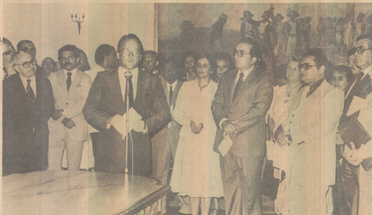
O governador Jorge Bornhausen lança o concurso de poesia Cruz e Souza