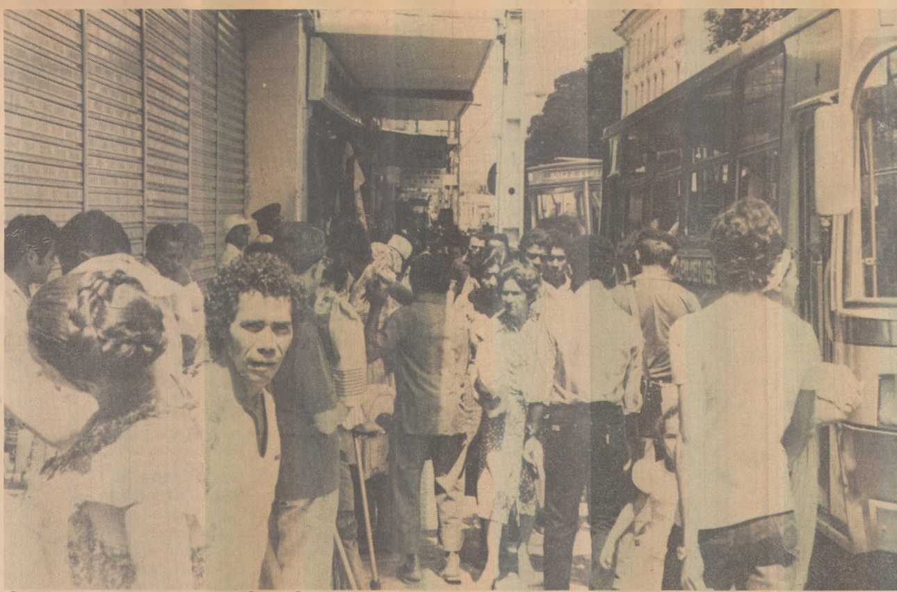
O povo aproveitou a folga do feriado de ontem para fazer compras no comércio