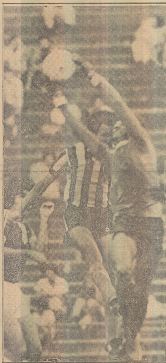
Botafogo confiante numa vitória

O local não poderia ser melhor, uma vez que a Praia de Tambaú é sem dúvida um recanto de vitalidade para os pessoenses os que por aqui aportam. A participação de todos é resultado de um esforço que não visa o lucro, mas sim uma ocupação mais direta dentro desta ótica de compartilhar da alegria da vida. As horas difíceis que enfrentam todos, é ali esquecida pela emoção do esporte.