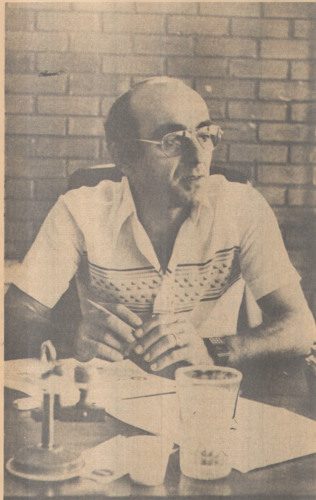
Delmiro vê concorrência desleal de grupos