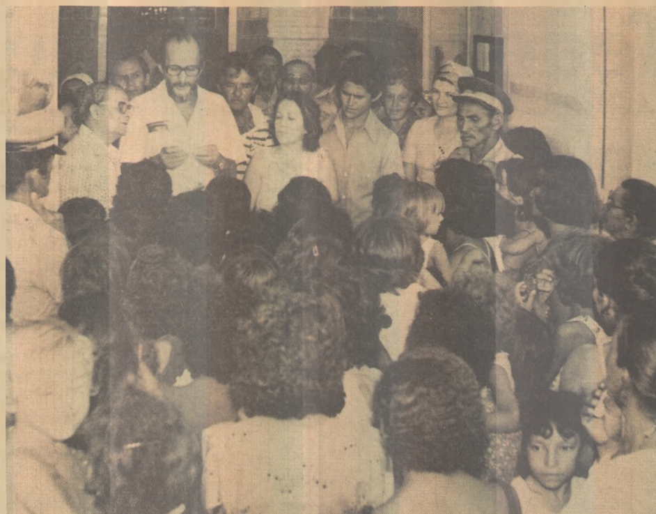
Crianças, pais e autoridades prestigiaram as comemorações

"Fita o Sol acalentando a lama da Terra e compreenderás o ensino claro da natureza que nos determina, sabiamente, entender e servir, abençoar e auxiliar." (EMMANUEL.)