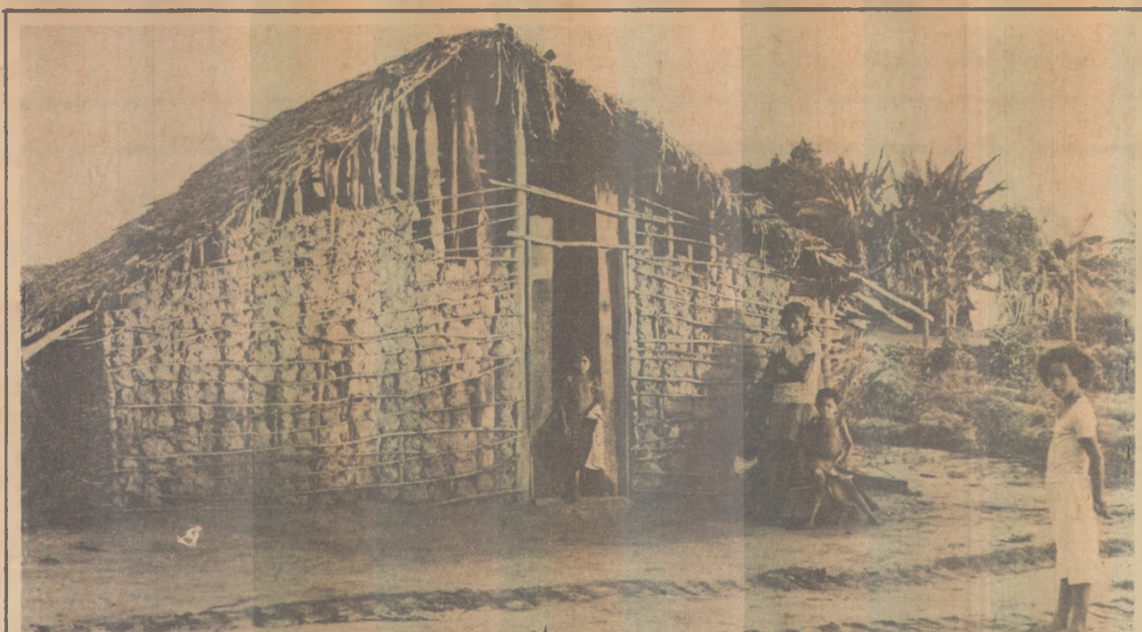
A favela do Grotão será substituída por casas populares, construídas pelo Governo

Para conseguir o cartão o candidato deverá apresentar o comprovante de pagamento da taxa de inscrição, no valor de Cr$ 860, e a Carteira de Identidade. Algumas pessoas que perderam esse comprovante, não serão prejudicadas pois as funcionárias que estão responsáveis pela distribuição dos cartões dispõem de uma lista dos nomes e número dos cartões de cada pessoa que inscreveu-se.