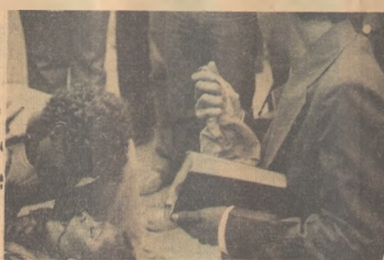
Terror e Extase, cartaz do Plaza