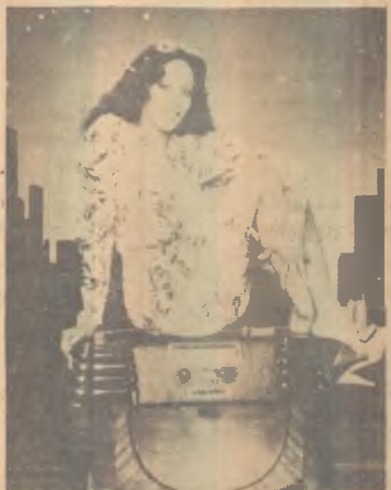
Donna Summer Especial

O INCRÍVEL DRAGÃO VOADOR - Produção dos estúdios de Hong Kong sobre as artes marciais chinesas. Sem referências quanto a enredo, equipe técnica e elenco. A cores. 18 anos. No Rex. 14h30m, 16h30m, 18h30m e 20h30m.