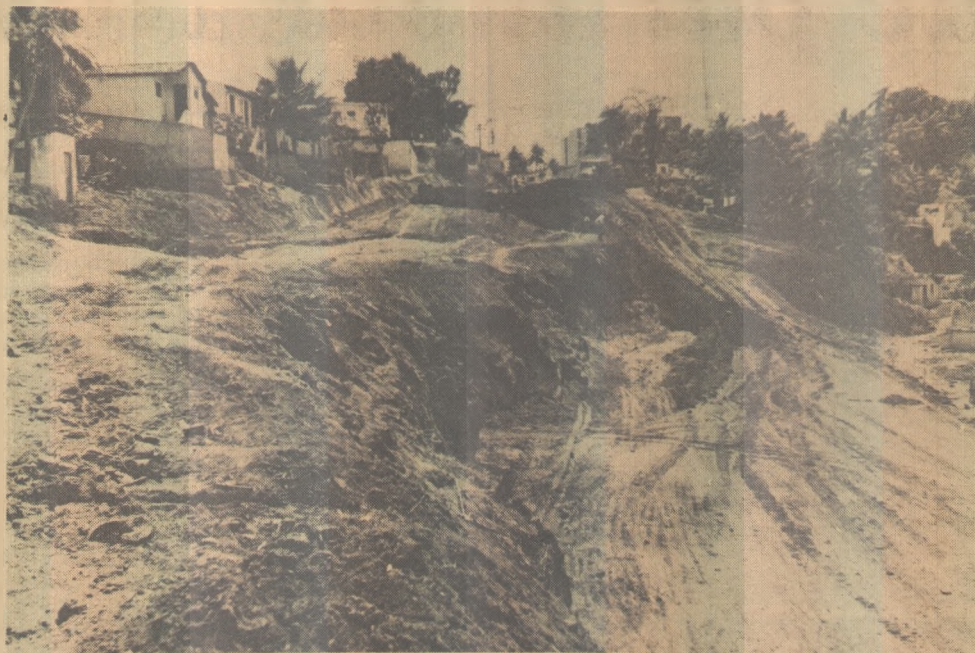
No Cordão Encarnado, casas serão atingidas

Disse, continuando, que na rua João Barreto Filho mora uma viúva mutuária de uma das casas do IPEP, que após investir todas as economias na aquisição da casa própria está impossibilitada de residir devido a total ausência de eletricidade no trecho onde está localizada a sua residência.