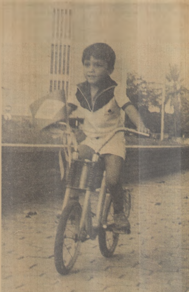
Bosco é um dos melhores ciclistas da capital

Jacaraú, Pedra Lavrada, Cruz do Espírito Santo e Gurinhém, a partir desta semana, também contarão com serviços telefônicos, elevando para oitenta o número de municípios do Estado servidos por telefonia.