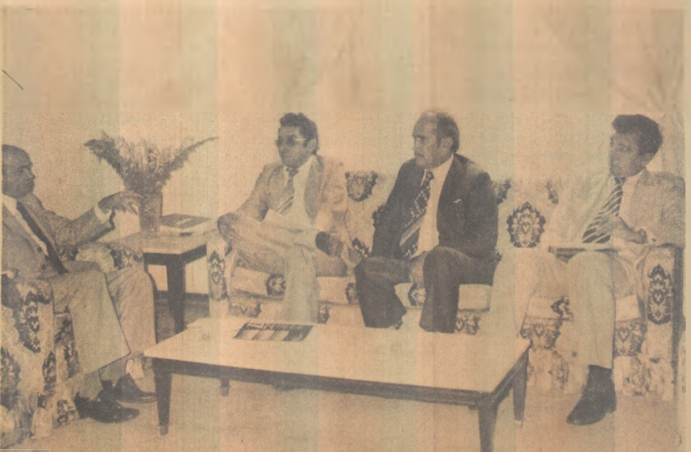
Prefeitos cearenses são recebidos no Palácio da Redenção

Com relação a morte de 7 palmeiras imperiais da praça João Pessoa disse que além de velhas, pois contam mais de cem anos, "foram muito sacrificadas, já que cem longos pregos foram colocados para sustentação da rede elétrica, caiação dos troncos e colocação de cartazes de propaganda em administrações anteriores. Mas com certeza a velhice foi a principal responsável".