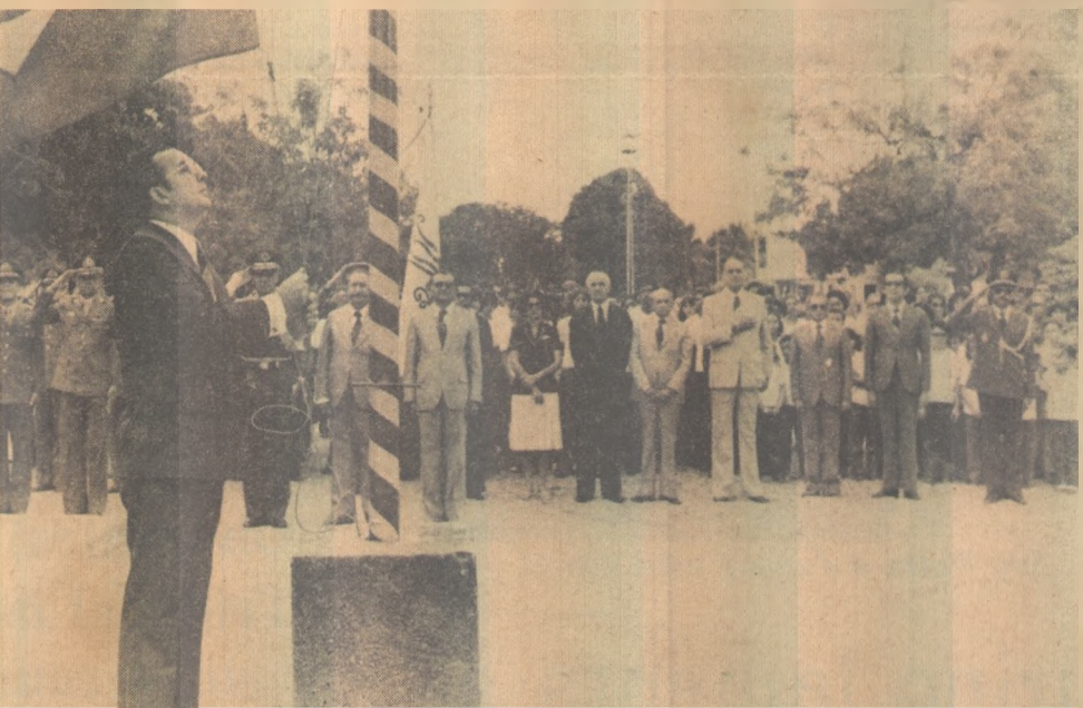
Burity hasteia a Bandeira Nacional na praça da Independência

Ontem, à noite, houve a primeira eliminatória do Concurso de Bandas Marciais, instituído pela Secretaria de Educação, no Dede. A segunda eliminatória será realizada hoje.