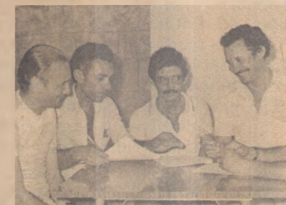
Assinatura do convênio

Sendo assim, os sertanejos vieram para São Paulo, Bahia e outros Estados para se salvarem da fome e da seca, e parece uma coisa ruim, pois nenhuma solução foi encontrada e acredita-se que não será.