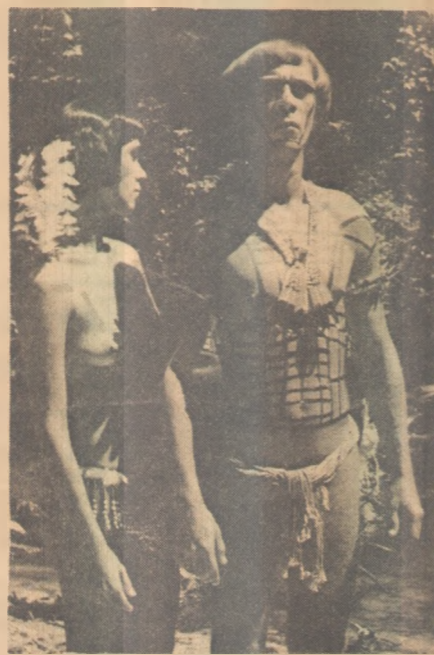
"Uirá", no Lima Penante

SHEET MUSIC , Barry White - Através do selo Epic, é lançado o álbum Sheet Music , onde o famoso maestro, compositor, arranja-