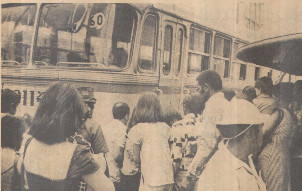
Os usuários reclamam. O sindicato faz a defesa dos cobradores.

O convênio de maior valor foi firmado com a Prefeitura de São Bento, num total de 700 mil cruzeiros, que serão destinados à compra de um trator e demais implementos para apoio da infraestrutura agrícola do Município. Já para a cidade de Emas as verbas no valor de 100 mil cruzeiros se destinam à conclusão de um bloco do Mercado Público, na sede do Município.