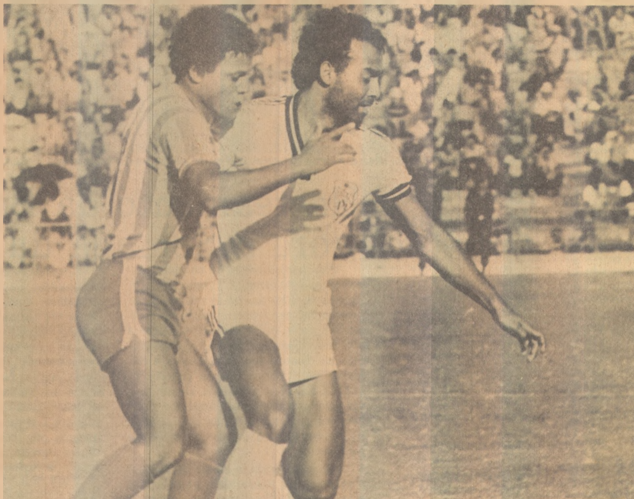
Treze não pode protestar a partida contra o Nacional-P, pois também está ilegal