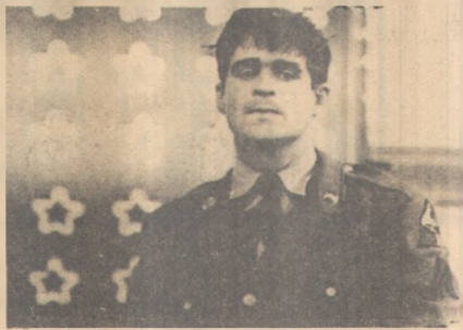
"1941" continua no Municipal