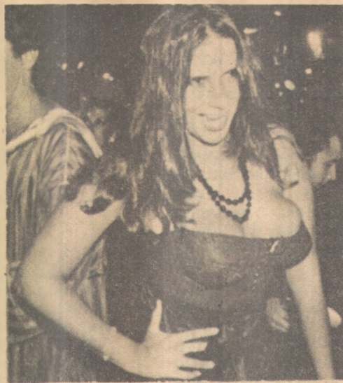
Fafá de Belém