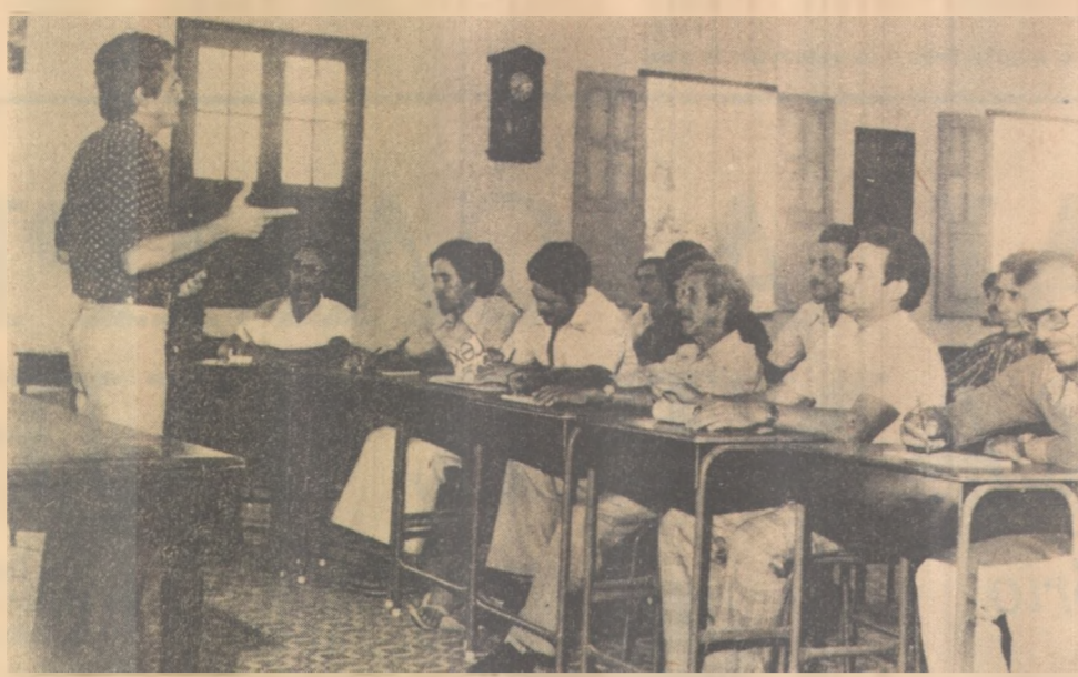
Agricultores participam de curso de treinamento em Lagoa Seca

Os produtores rurais que participaram do treinamento mostraram-se satisfeitos com os ensinamentos transmitidos pelos técnicos da Extensão Rural e se confessaram satisfeitos em poder levar informações úteis a outros agricultores, ajudando assim a promover o desenvolvimento do setor agropecuário.