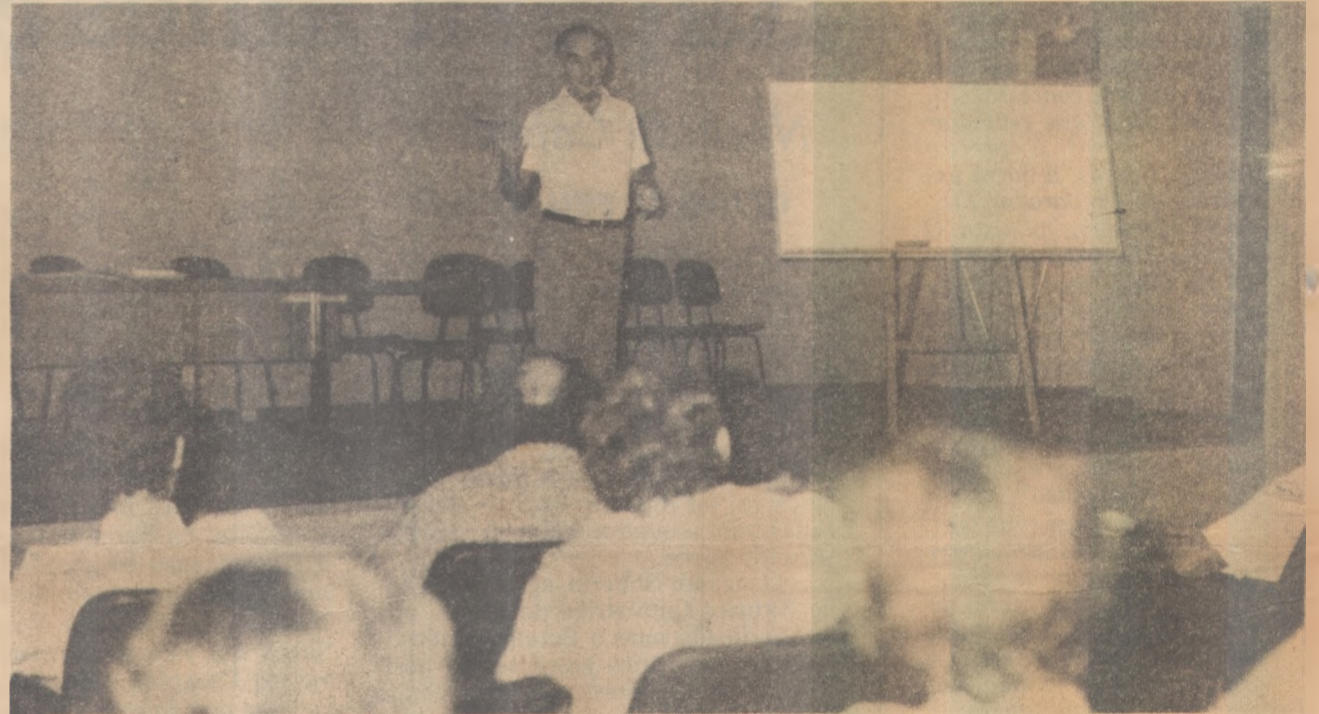
Seminário sobre hotelaria foi aberto ontem no auditório do Senac em João Pessoa