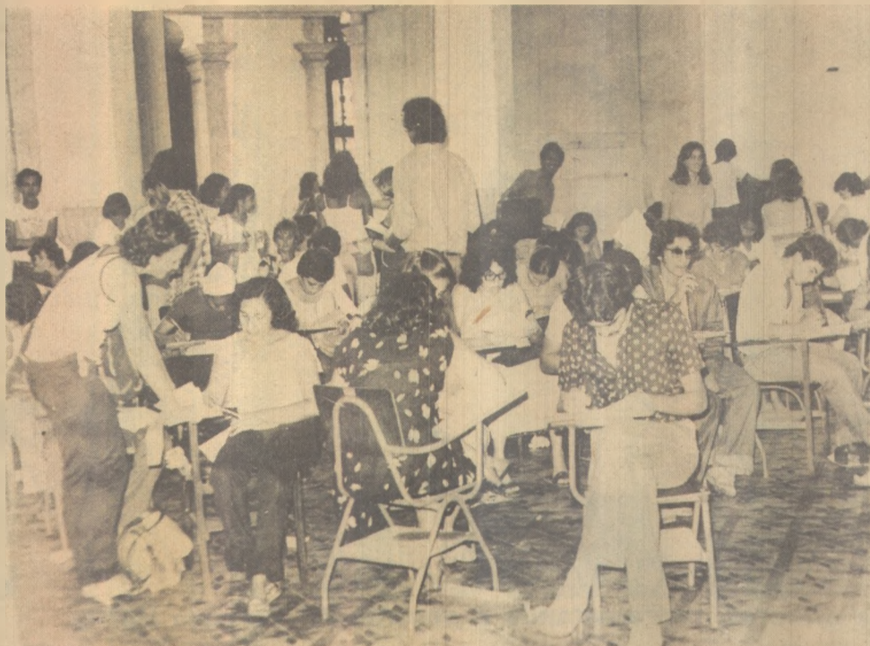
As inscrições para o Vestibular 81 terminarão hoje às 18 horas

Vários animais já se encontram inscritos, segundo informações fornecidas pela Coordenação da mostra, esperando-se que o número de participantes atinja a mil animais.