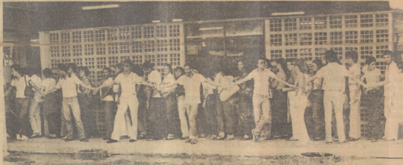
UFPb exige prestação de contas dos estudantes que ocuparam restaurante universitário