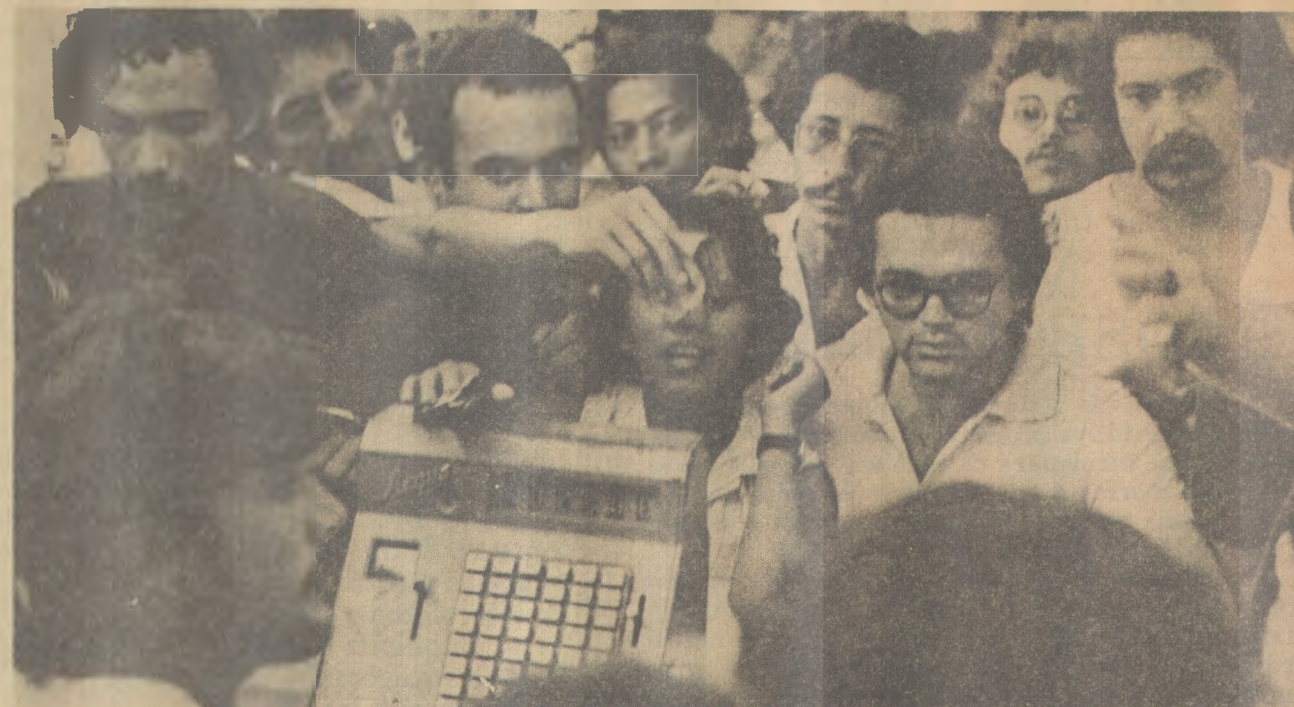
Os universitários voltam a ocupar restaurantes e mantêm os preços das refeições.

Como o guarda é quem fica responsável pela segurança das bicicletas, se uma delas desaparecer, a Escola Técnica é quem pagará ao aluno o prejuízo.