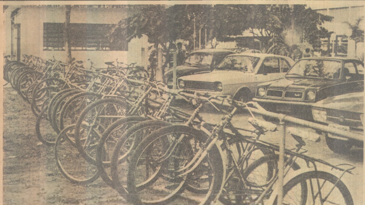
A bicicleta é novo meio de transporte usado pelos estudantes da Escola Técnica