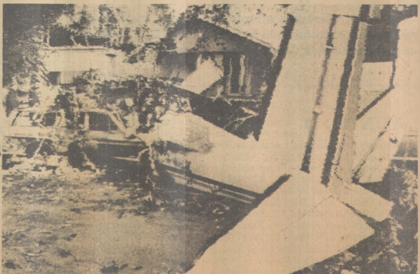
O avião caiu num bairro de Chicago, após levantar voo.