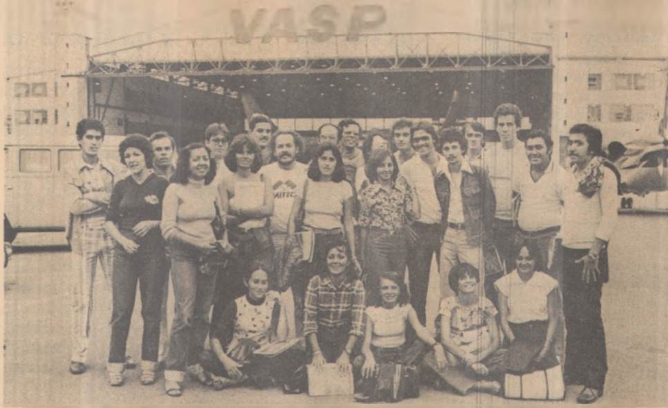
Concluintes de engenharia civil após visita à Vasp