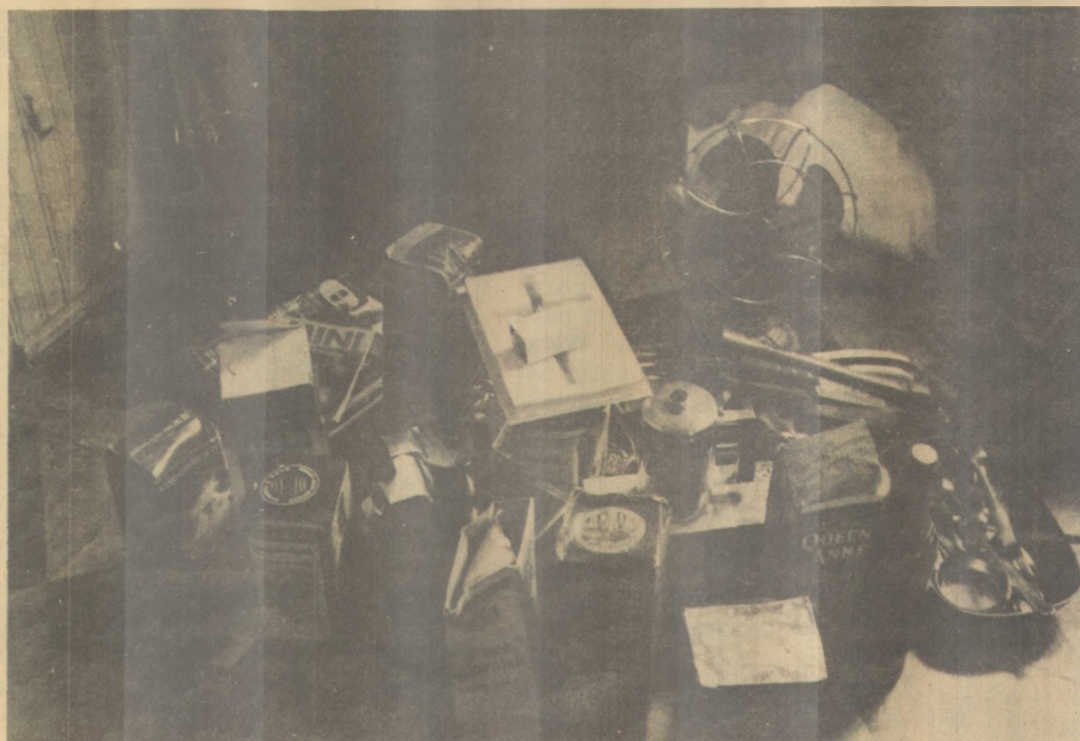
Objetos furtados no Bairro dos Estados apreendidos pela Polícia