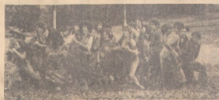
"Hair", a partir de hoje

A BATALHA DOS MÁGICOS - Produção dos estúdios de Hong Kong sobre as artes marciais chinesas. Sem maiores referências. A cores. 18 anos. No Rex. 14h30m, 16h30m, 18h30m e 20h30m.