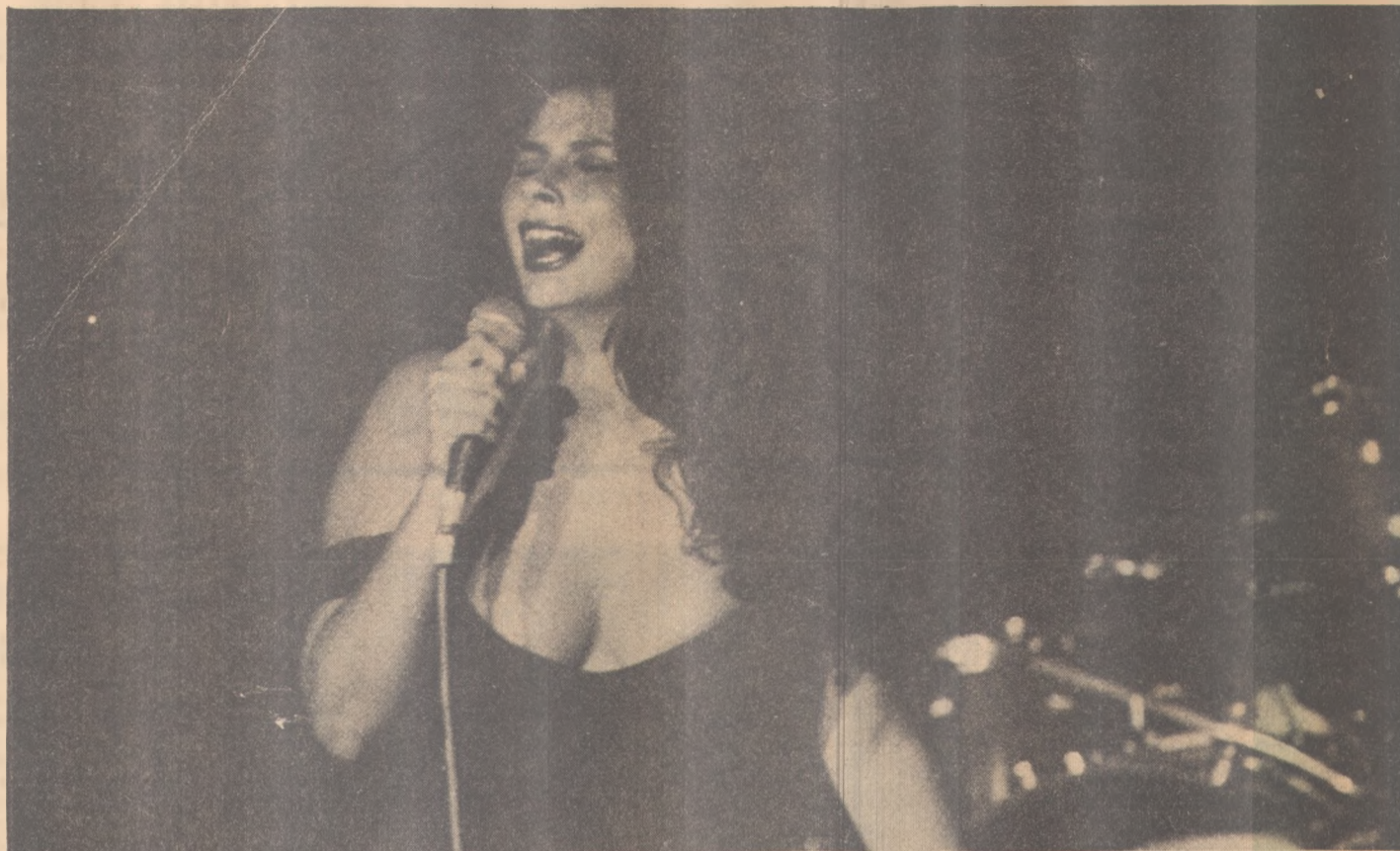
Fafá de Belém está com Estrela Radiante às 21h15m de hoje no Teatro Santa Roza

20 de fevereiro a 20 de março - Período favorável a organização de suas atividades futuras, de forma a alcançar o final do ano, quando tudo será melhor para o pisciano. Coloque em prática sua excepcional capacidade criativa, usando os recursos que por diversas vezes alteraram positivamente sua vida. Dia favorável ao sentimento. Negócios com roupas e móveis beneficentemente influenciados. Evite alimentação demasiadamente condimentada.