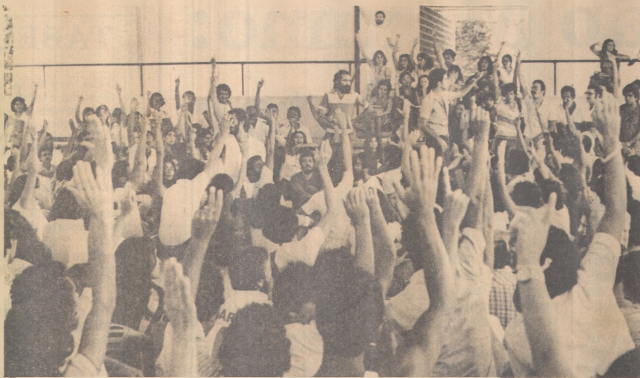
Os estudantes retomam o restaurante universitário e baixam os preços das refeições

O prêmio do primeiro lugar será oferecido pela Federação do Comércio do Estado da Paraíba, o segundo lugar receberá o prêmio do Clube de Diretores Lojistas de João Pessoa, e, para o terceiro lugar será ofertado pelo Sindicato dos Lojistas de Comércio de João Pessoa.