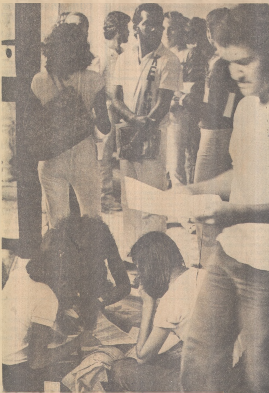
As inscrições para o vestibular terminaram ontem, às 18 horas

Como retribuição, os alunos entoaram várias canções em homenagem ao palestrante, além de improvisarem brincadeiras e jogos. No final um diálogo foi estabelecido, com as crianças querendo saber a função da Marinha e do marinheiro.