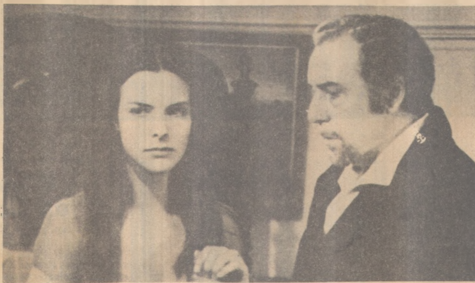
"Esse Obscuro Objeto do Desejo"