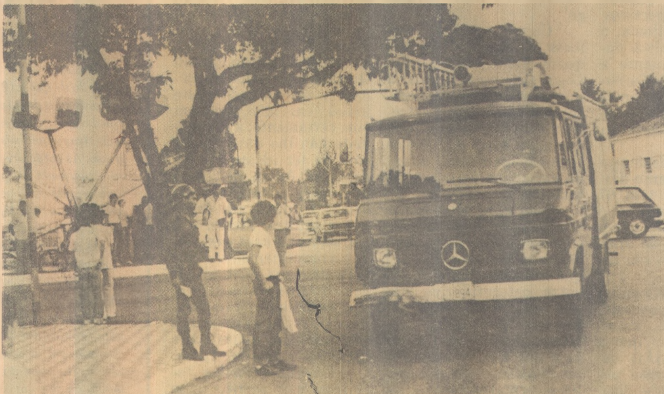
Viatura do Corpo de Bombeiros colide com Volkswagen em cruzamento da Vasco da Gama

Por outro lado, vários processos contra traficantes de maconha estão em andamento na 9ª Vara Criminal de João Pessoa. Eles serão julgados por Joaquim Sérgio Madruga.