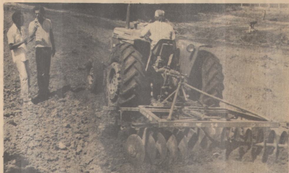
A Secretaria da Agricultura cedeu um trator para o projeto