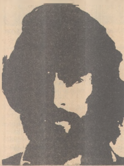
Paulo Ricardo no Fumap