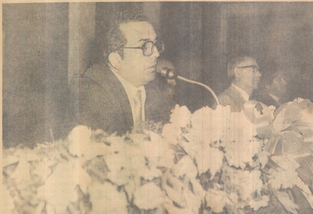
Burty encerra debates que antecedem abertura do Curso de Mineralogia Aplicada