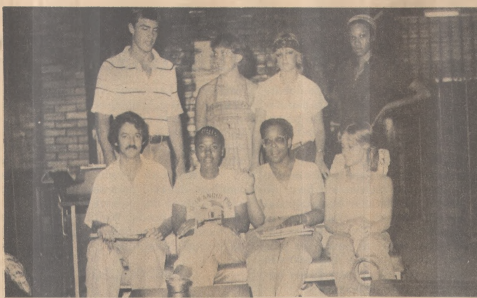
Os estudantes foram recebidos na sala de imprensa do Campus