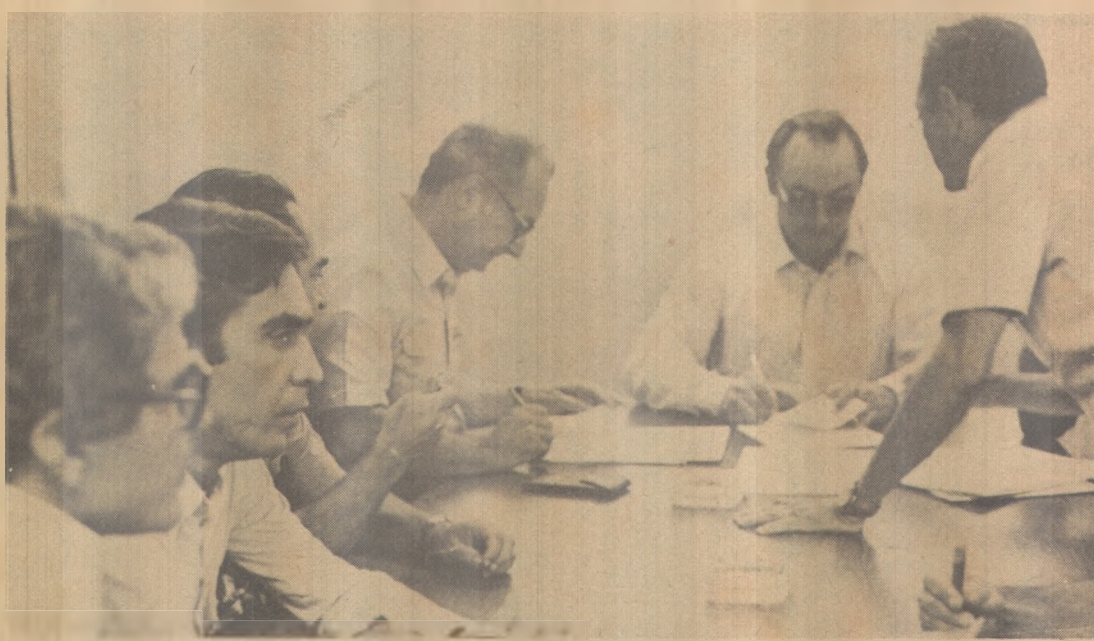
A assinatura dos convênios entre a UFPb e empresas de C. Grande