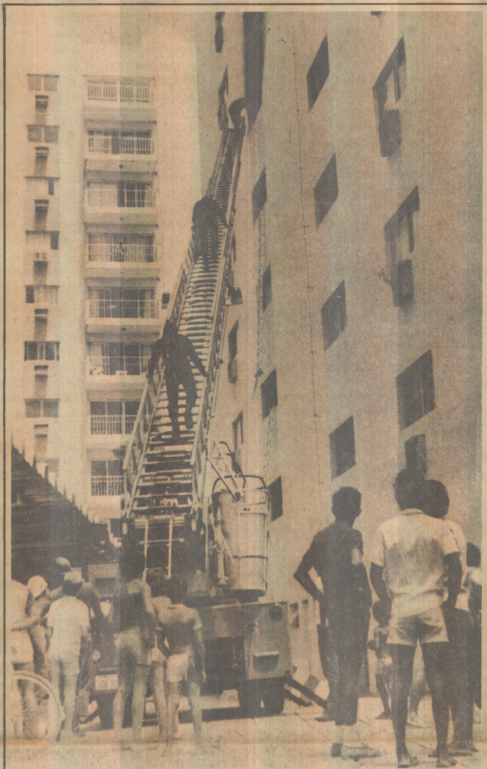
Bombeiros evitaram que incêndio tomasse grandes proporções

Disse que a efemeridade da vida é o principal motivo para que o homem cuide de praticar o bem, "pois ninguém sabe se vive 10, 20 ou 30 anos". E que aqueles que ofenderam a Deus devem cuidar para obter o perdão divino, antes que a escuridão eterna chegue aos olhos".