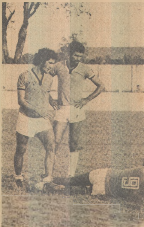
Santa Cruz tenta reabilitar-se

O Campeonato Estadual do Rio de Janeiro tem prosseguimento hoje à noite, com a realização das seguintes partidas: Volta Redonda x Flamengo, na ci-