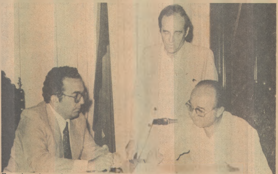
Francisco Arnaud é o agora Secretário de Saneamento e Habitação