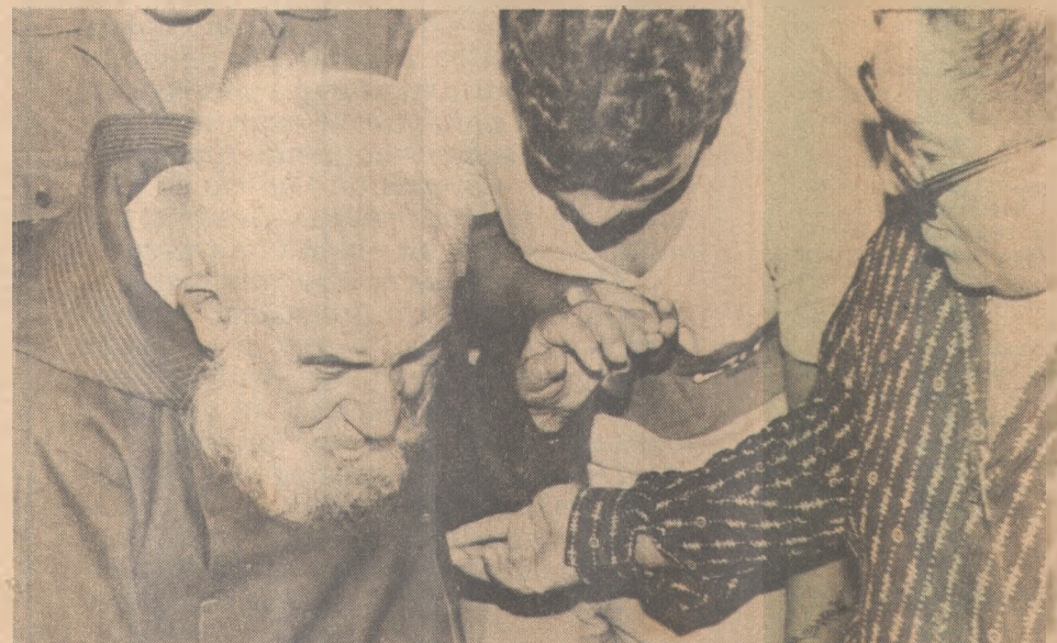
Detentos se curvam diante de Frei Damião na Penitenciária