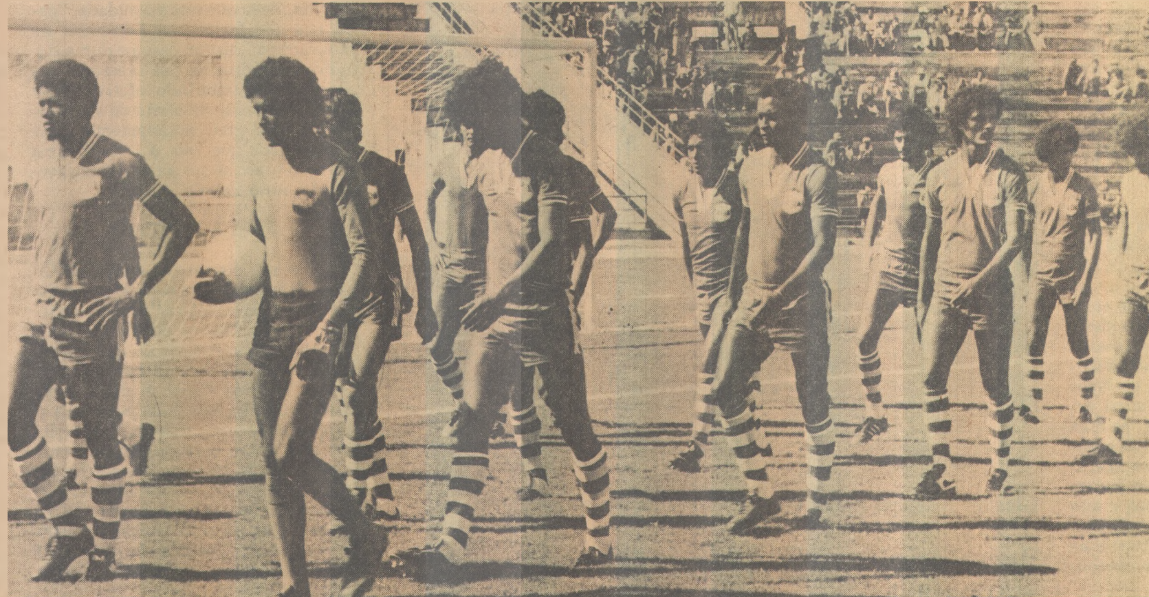
Automobilistas esperam contar com o apoio da torcida no clássico de hoje contra o Campinense, no Almeidão