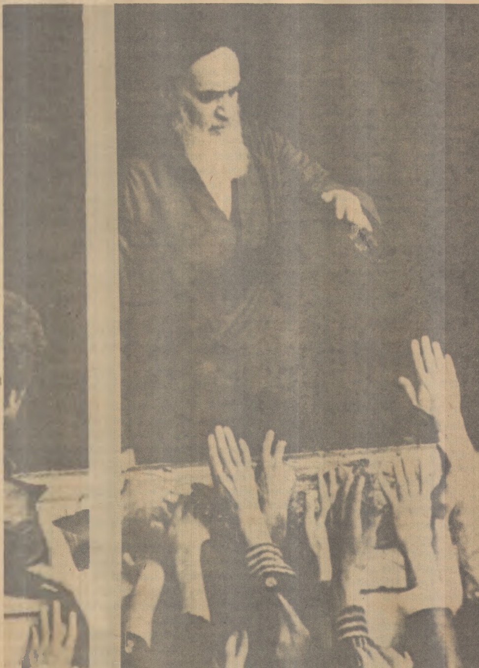
Khomeini é aclamado pelo povo de Teerã

O que interessa é se ter uma ideia mais clara do que as pessoas estão pensando da recessão, o que as pessoas estão pensando do que será a política monetária na Europa, nos Estados Unidos, que se imaginando que vai acontecer com a taxa de juros, o que vai acontecer com a liquidez mundial, o que se imagina que vai acontecer com o preço do petróleo. Este foi, realmente, o objetivo da viagem. Faz-se uma viagem como essa na crença de que as pessoas que estão dentro do mercado tenham uma visão melhor do que nós sobre o que é que vai acontecer - disse o ministro do Planejamento aos jornalistas, ontem em Brasília.