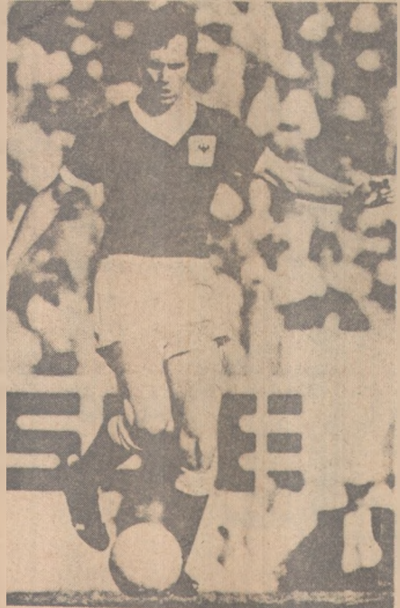
Beckenbauer faz despedida

COSMOS X SELEÇÃO DOS EUA - Uma grande festa esportiva, em Nova Iorque, quando se realizará a partida de futebol entre o time do Cosmos e a Seleção dos Estados Unidos. Este jogo marcará a despedida dos campos americanos de Franz Beckenbauer, que, após a partida, voltará para sua terra natal, onde jogará pelo Hamburgo. Entre as grandes atrações desta noite, a maior certamente será a presença de Pelé, que, em ho-