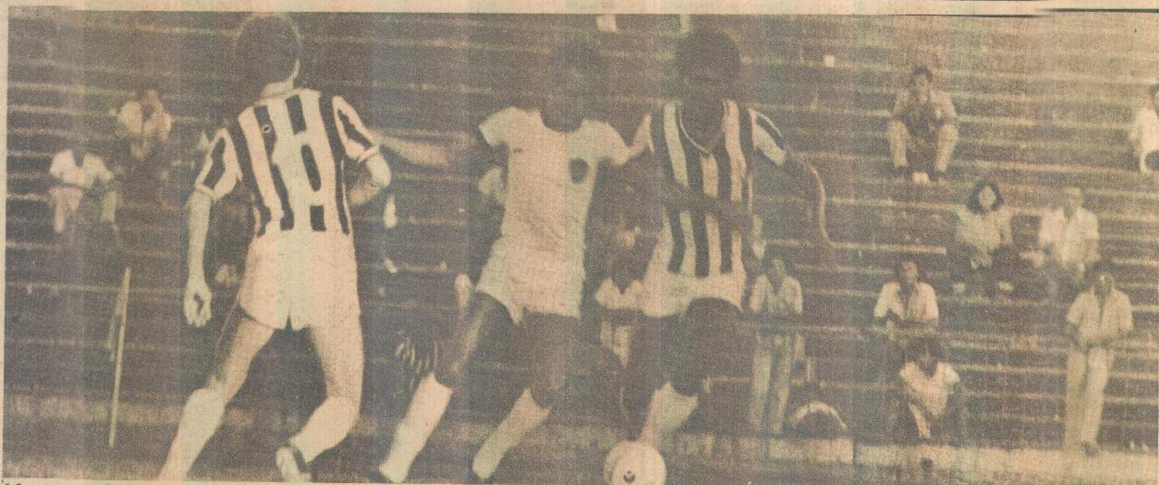
Magno continua sendo sacrificado, enquanto os dirigentes teimam em manter um time fraco para este ano