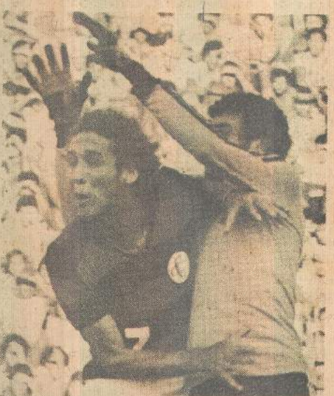
Campinense vem amanhã para ganhar

Beto por sua vez, desde 79, quando foi um dos destaques do Campinense no Campeonato Brasileiro, tem demonstrado desejo de se transferir para outra agremiação, face aos revelados interesses de clubes do Sul pelo seu futebol. Agora, tentando se valorizar, o jogador acha que é tempo de pensar no seu futuro e fazer um bom contrato: "lembram do Neninha?", diz o jogador.