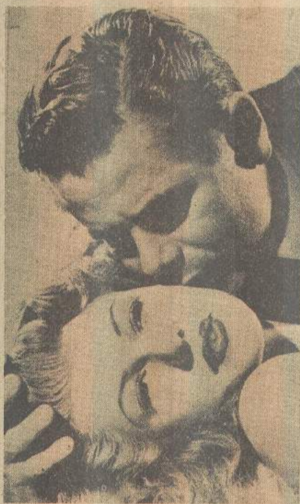
"Gilda", em "Classe A"

GILDA (***) - Produção americana de 1946, com direção de Charles Vidor. Um mis-