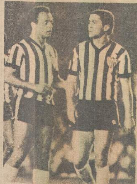
Atlético decide com o Inter

Jamais na história do tricolor aconteceu tamanha decepção, pois ser goleado pelo Bahia, na Ponte Nova por 5 a 0, arrasou toda a equipe e frustrou toda a sua torcida, uma vez que o clube pernambucano fazia uma boa campanha nesta fase.