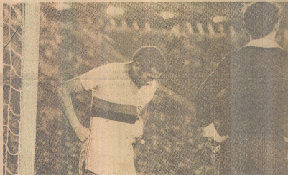
Uma vitória dará o Troféu Juracy Pedro Gomes ao Campinense