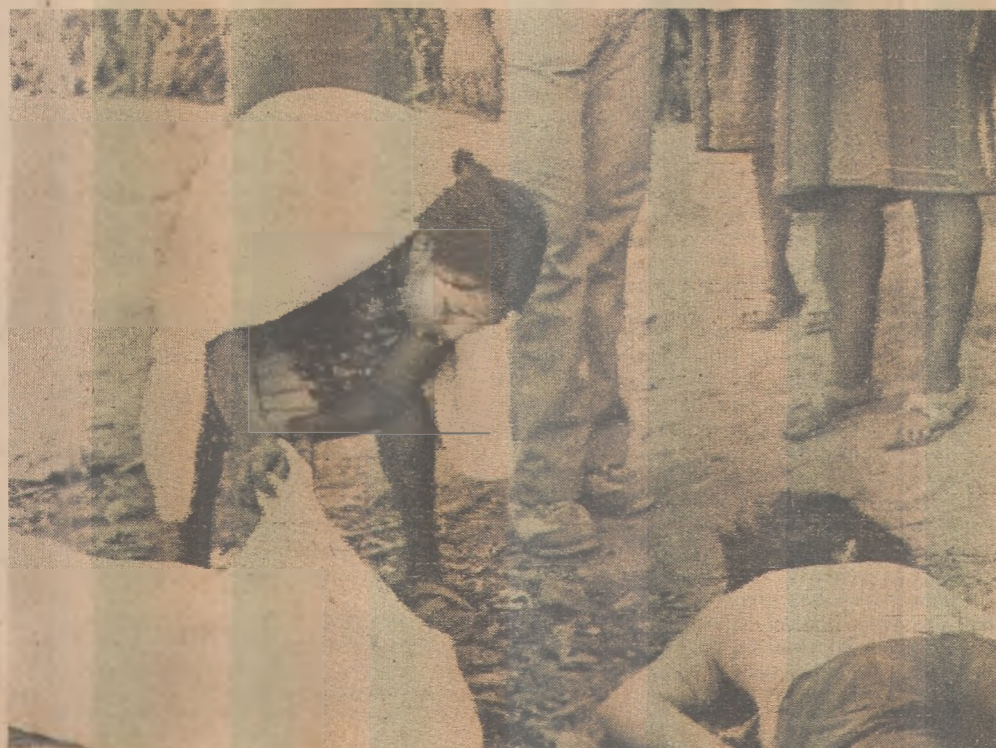
Mais de 24 prisioneiros executados pelas forças de segurança de El Salvador

Todas as vítimas receberam tiros na cabeça e pelo menos seis tinham os olhos vendados e as mãos amarradas nas costas. Os órgãos genitais de um jovem tinham sido cortados e colocados sobre seu peito, disseram os jornalistas.