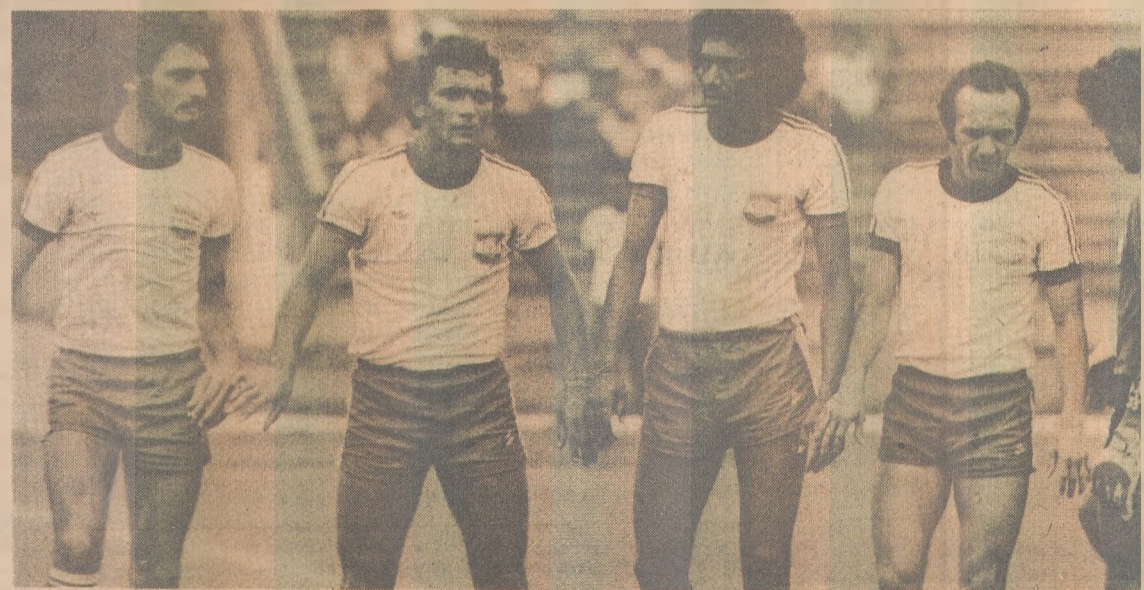
Auto continua intensificando os treinamentos visando o amistoso