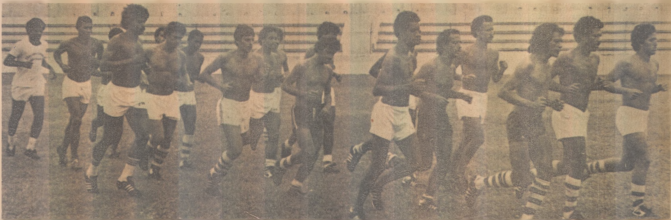
Esse elenco quantitativo, apresentou poucas qualidades e nada promete de bom para o Campeonato Paraibano. Faltam craques