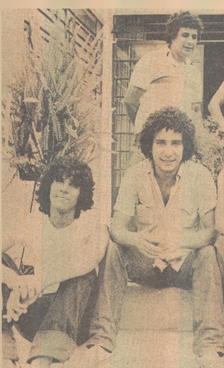
Na foto todos os irmãos Borges, menos Lô