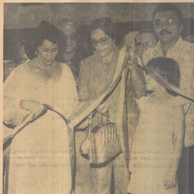
Ato inaugural do supermercado

Ao ato inaugural compareceram várias autoridades no município e de cidades vizinhas. A fita simbólica foi cortada pela 1ª dama do município juntamente com a esposa do empresário. Logo após a solenidade, foi oferecido um coquetel no Clube Recreativo de Solânea.