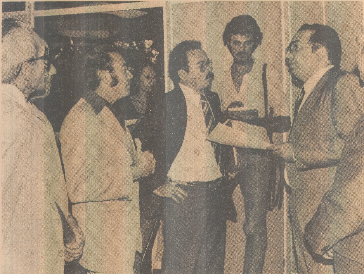
Os oficiais de justiça foram a Burty e pediram melhores condições para classe

Atualmente, o maior salário percebido pelos oficiais de Justiça de terceira entrada que atuam em João Pessoa e Campina, duas maiores cidades do Estado, não ultrapassa a 4.500 cruzeiros. O presidente da AOJE foi levado ao governador pelo deputado Edme Tavares.