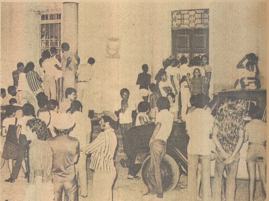
Criminosos atraem a curiosidade do povo de Santa Rita

Infelizmente - disseram - um dos tiros foi atingido o agricultor que nada tinha com a história.