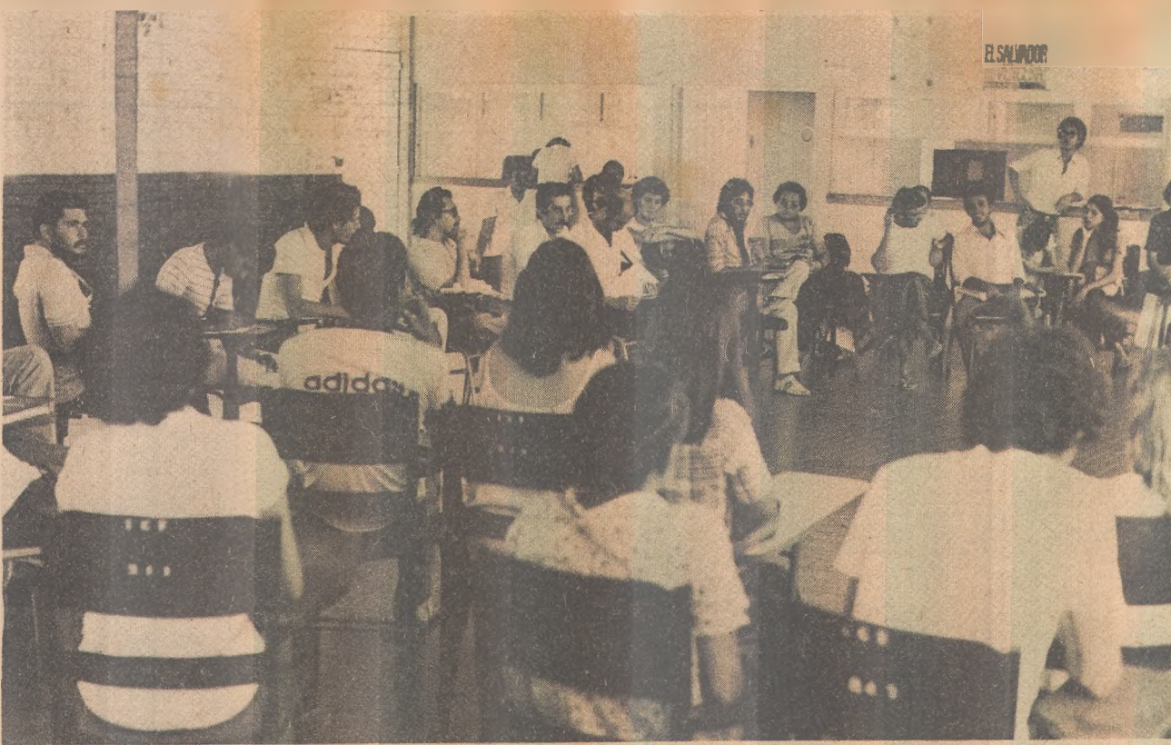
Poucos estudantes acorreram à assembléia convocada pelo Diretório Central da UFPb.