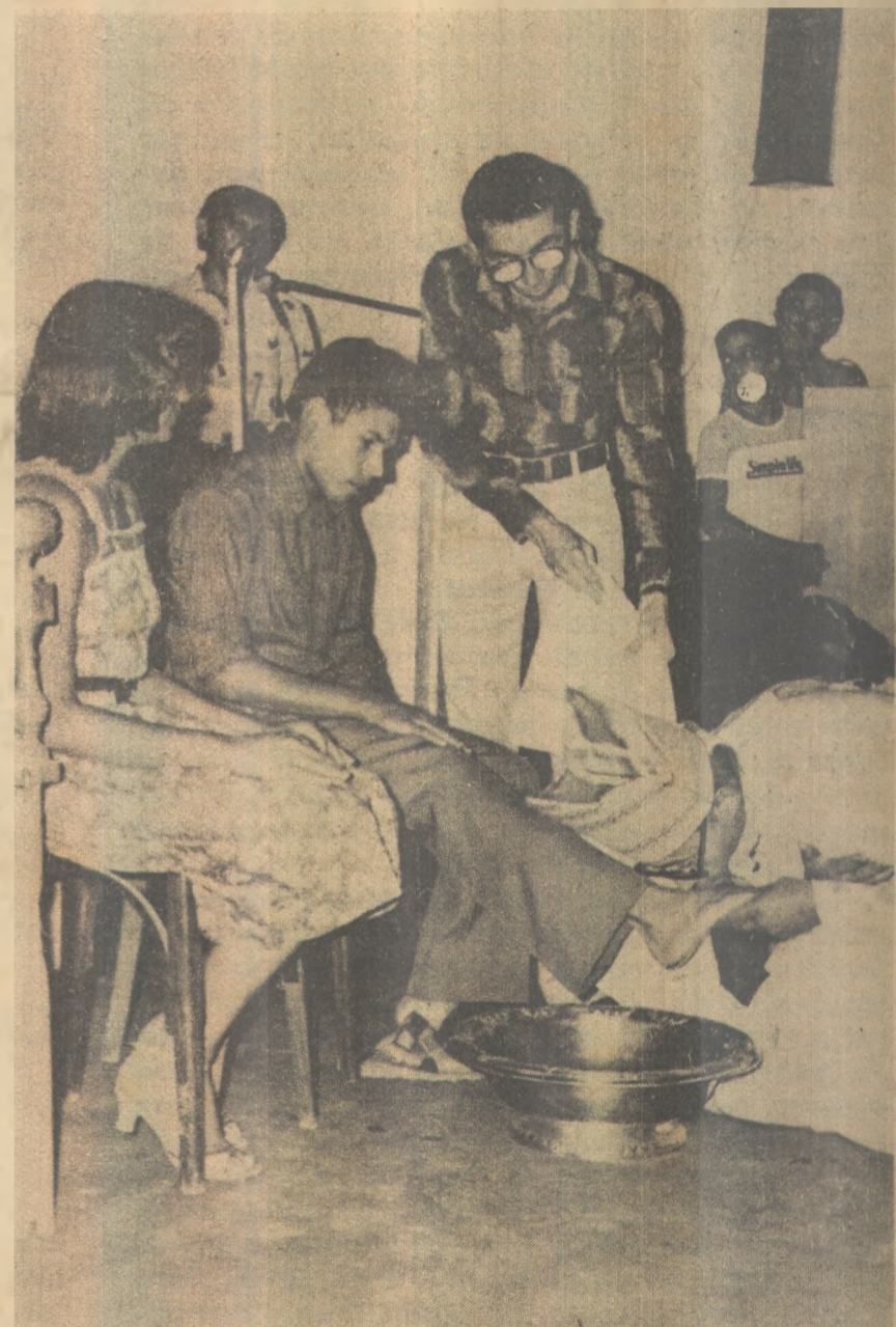
No fim do ato, Dom José lava os pés de um jovem

Finalizando a cerimônia religiosa, o arcebispo chamou um jovem e uma jovem, que haviam participado da Renovação da Ceia do Senhor antes do Lava-Pés, lavou-lhes os pés e beijou-lhes logo em seguida. Após o término da cerimônia, a Igreja ficou aberta para os cristãos que quizessem fazer a Adoração ao Santíssimo Sacramento, até à meia-noite.