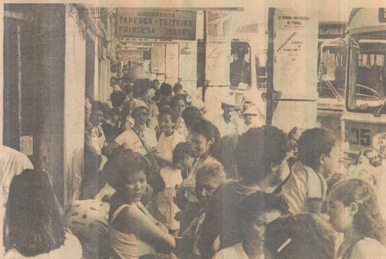
O movimento na rodoviária, ontem, foi um dos maiores já registrados na cidade

O método usado pelo programa do Mobral para o controle da natalidade é o de Billings, baseado na ovulação, extraído do livro A Transmissão da Vida , editado pelo Ministério da Educação e Cultura. O método parte da temperatura do corpo da mulher, detectando seu dia fértil, e não é anti-concepcional. Em seus capítulos, o livro do MEC explica o que a mulher deve fazer para evitar a gravidez sem recorrer a métodos anti-concepcionais prejudiciais à saúde.