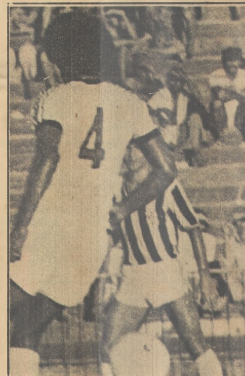
Deca (quatro), uma garantia

Portanto, Brasil x Bulgária, hoje no Ginásio da UFPB, é a grande atração para o desportista pessoense. Até mesmo para aqueles que nunca viram uma partida de volibol.