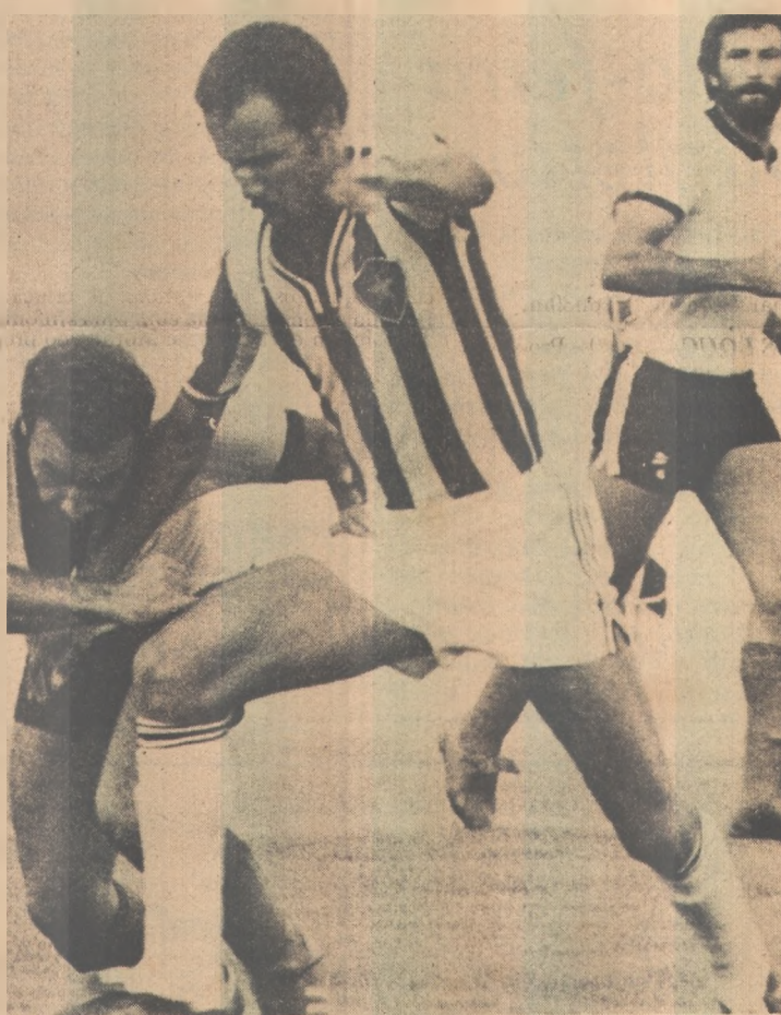
Botafogo será testado pelo Central

O Botafogo retribuirá a visita na próxima quarta-feira, exibindo-se na cidade de Caruaru, no Estádio Pedro Victor de Albuquerque, por 60 mil cruzeiros a mesma quantia que será paga aos pernambucanos neste final de semana.