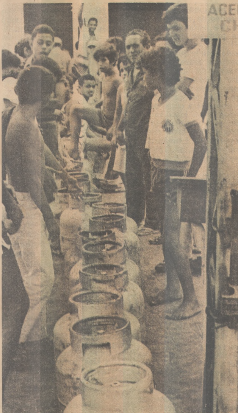
Grandes filas nos postos de revenda de butijões

Esta alteração na estrutura de demanda, segundo ele, está sendo mostrado claramente na indústria automobilística, às voltas com queda nas vendas e, conseqüentemente, diminuição da produção. "Como produzir 1 milhão de veículos? Como é que se importa petróleo para pagar tudo isto? Quem paga a conta? Não há nenhum trouxa do outro lado", acentuou.