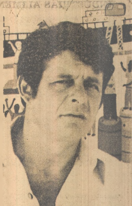
ARTISTA JOSÉ LUCENA