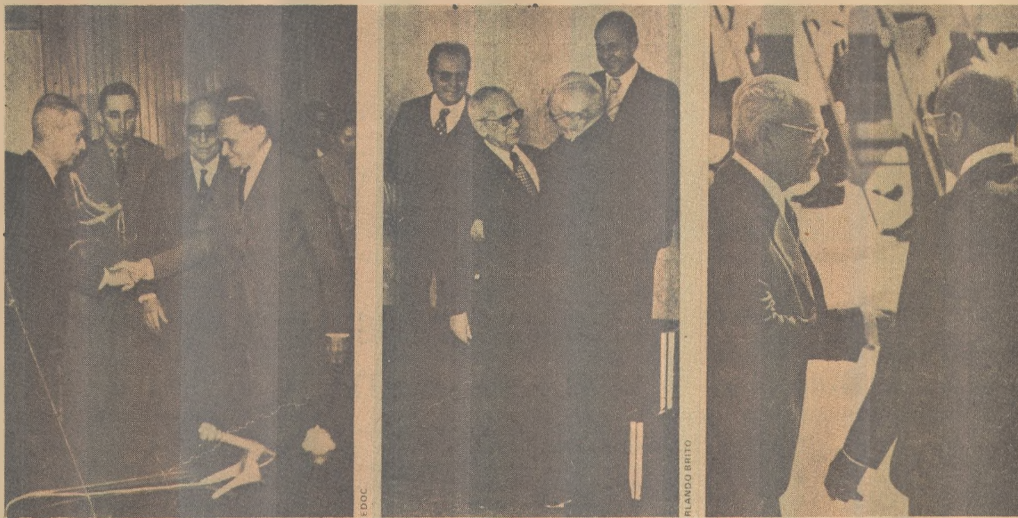
Golbery do Couto e Silva serviu aos governos de Castelo Branco, Ernesto Geisel e Figueiredo

A doutrina e a política de segurança nacional não é absolutamente um instrumento de militares para afundar o Brasil na ditadura nem no militarismo. Dizer que é, constitui mistificação inominável. Ela não possui princípios anti-democráticos, ranço militarista e espírito ditatorial, nego-o com toda a veemência.