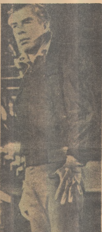
Lee Marvin: "A Queima-Roupa"

doleiro do Oeste é forçado a reassumir o lugar que era de seu pai. Com grande custo, ele cria um complicado plano para casar-se com a filha do governador. Também no elenco, Kathryn, Grayson, Ann Miller, J. Carrol Naish, Ricardo Montalban e Cyd Charisse. A cores. No Canal 10. 14h30m.