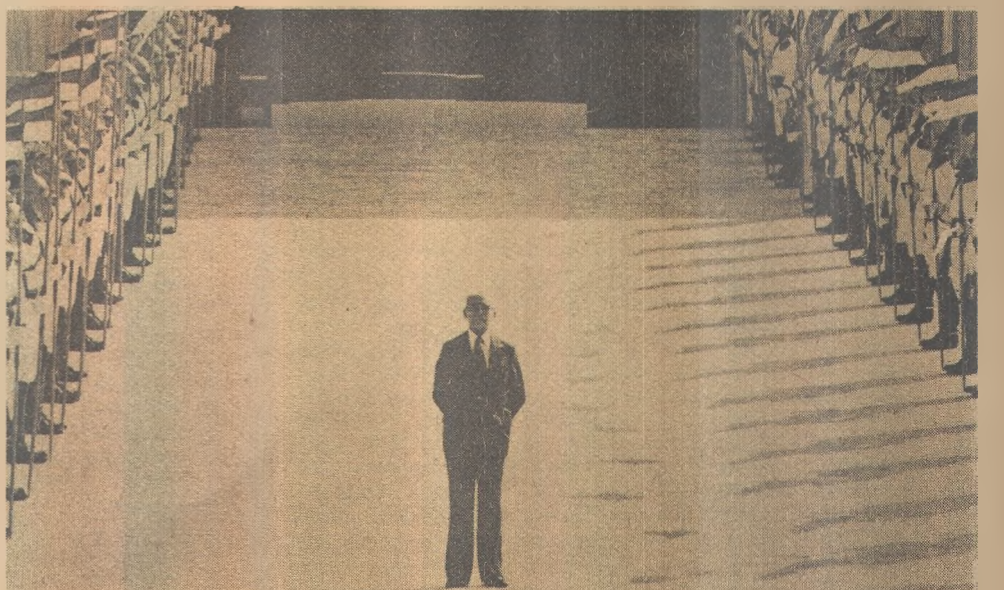
Golbery desceu ontem, pela última vez como ministro, a rampa do Planalto

Falando dos homens fortes da situação, o comentarista esclarece que "os primeiros rumores apontam como novos homens fortes, em nível de poder, o general Otávio Medeiros e o sr. Delfim Neto, que se opuseram tanto à solução preconizada pelo ministro Jair Soares para atender ao déficit da Previdência Social quanto ao projeto do ministro José Carlos Freire, estabelecendo regime estatutário para todo o funcionalismo público, que passaria a ganhar o 13º salário como compensação da perda do FGTS. Os desmentidos saídos do Palácio e do Ministério do Planejamento não teriam passado pelo crivo do general Golbery. Como se sabe, o projeto do Dasp fora por ele aprovado.