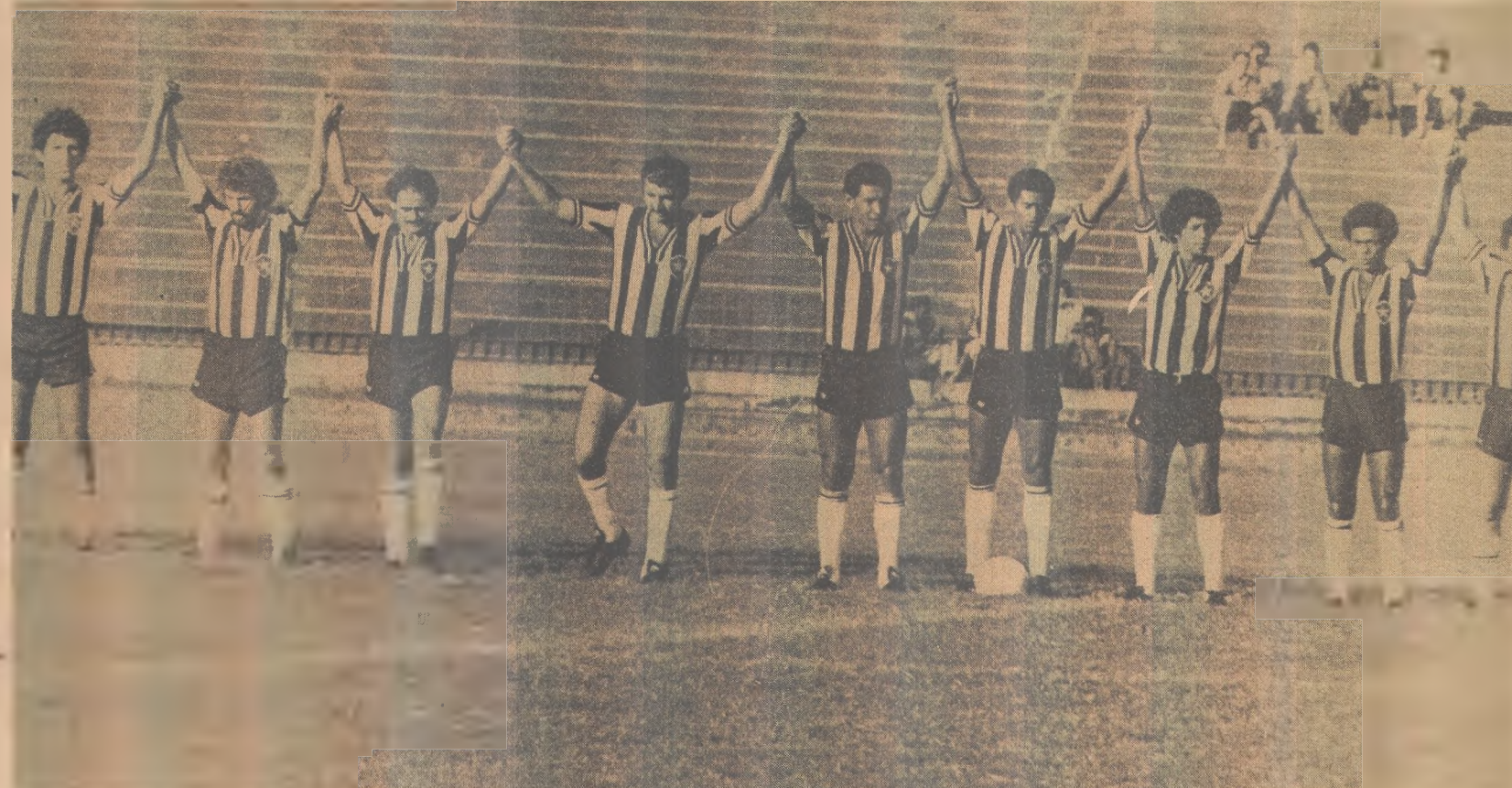
Com cinco pontos ganhos, o Botafogo é o sexto lugar no Campeonato Estadual e pode ficar fora das finais

Com suas fracas atuações, o Botafogo pode ficar de fora do quadrangular e Ibiapino poderá cair