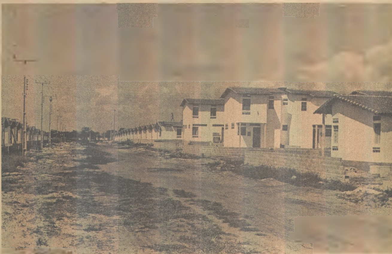
Uma das ruas principais do conjunto de Mangabeira, que está em fase de conclusão

O programa atende outras áreas da Capital com gêneros alimentícios a preço de custo