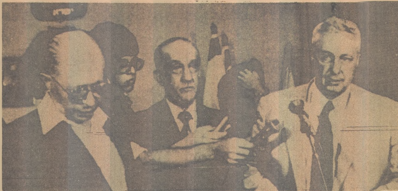
Begin com Ariel Sharon na defesa de seu ministro do Trabalho, em mais um julgamento