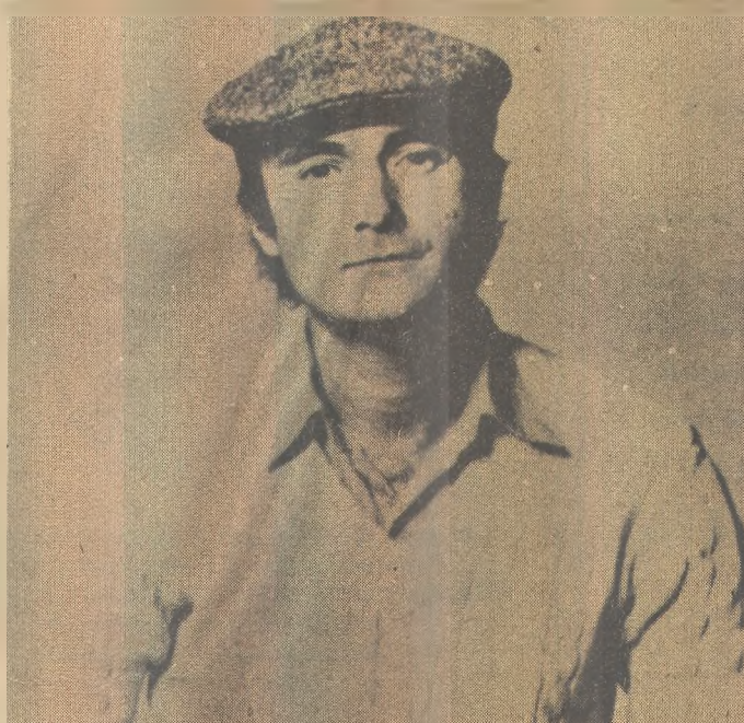
Phil Collins está em 14º lugar na parada.

1. Long Distance Voyager, Moody Blues ; 2. Precious Time, Pat Benatar ; 3. Street Song, Rick James ; 4. 4, Foreigner ; 5. Mistaken Identity, Kim Carnes ; 6. Hard Promises, Tom Petty and the Heartbrakers ; 7. Share your Love, Kenny Rogers ; 8. Hi Infidelity, REO Speedwagon ; 9. Paradise Theatre, Styx ; 10. The One that you Love, Air Supply ; 11. Don't Say No, Billy Squier ; 12. Working Claus, Rick Springfield ; 13. Escape, Journey ; 14. Race Value, Phil Collins ; 15. Kancy Free, Oak Ridge Boys ; 16. Zebop, Santana ; 17. In the Pocket, The Commodores ; 18. Black and White, Ponters Sisters ; 19. Stars on Long Play, Stars on Long Play ; 20. Moving Pictures, Rush .