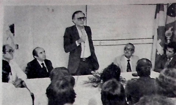
Na solenidade de posse, Enivaldo disse que escolheu o homem certo na hora certa

Saliente o Relator da Comissão que "é realmente legal a transmissão do presente Projeto de Lei. Pois está de conformidade com o que prescreve a Lei Orgânica dos Municípios em seu artigo 9º, II - "L". Apenas lembramos que o quorum é especial, pelo há necessidade de dois terços dos membros da Casa para sua aprovação. Quanto ao mérito da proposta, somos pela rejeição pelo fato de vir conduzir a sua aprovação a um aumento de tributo, com que não concorda a comunidade campinense, fato esse já demonstrado quando da distribuição dos carnês de cobrança de Imposto Predial, anualmente".