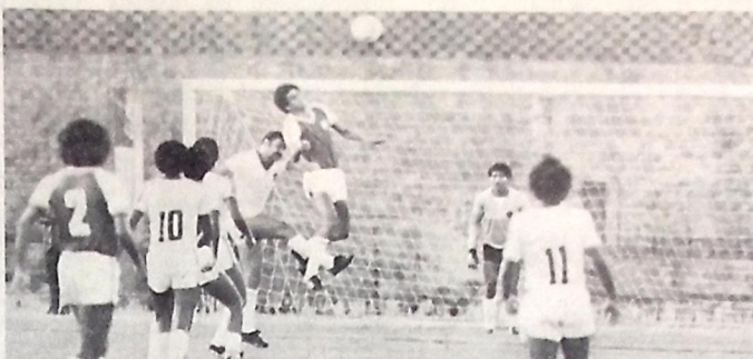
Botafogo continua treinando visando amistoso em Santa Rita, contra a seleção local