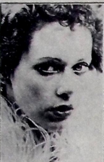
Sylvia Krastel, atriz de Emmanuelle II