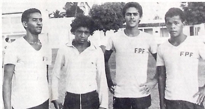
Seleção Juvenil tem que golear Pernambuco hoje para conseguir a classificação

A equipe "ideal": Zoff, Gentile, Babrini, os três do Juventus, Falcão e Pruzzo, do Roma; Collovati, do Milan, Scirea, do Juventus; Casuso do Udinese; Dossena do Torino; Beccalossi, do Inter e Conti do Roma. Junto a Falcão jogam em equipes italianas os renomados Rued Krol, o holandês do Napoli; o argentino Daniel Bertoni, do Fiorentina; o irlandês Liam Brady, do Juventus; e o austriaco Herbet Prohaska, do Inter.