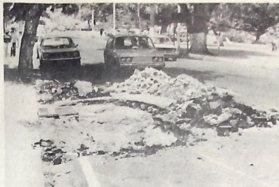
As galerias estão provocando o afundamento da pista no anel da Lagoa

Novos problemas de afundamento estão afetando o asfalto do anel externo da Lagoa, no Parque Solon de Lucena. Em algumas partes, como em frente à casa 142, onde o leito da via afundou, os operários da Prefeitura Municipal já começaram a fazer os reparos.