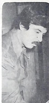
REGIS EXPÔE NA GAMAELA