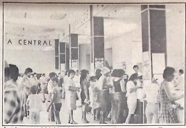
Instalar novos guichês foi a solução para acabar as longas e constantes filas