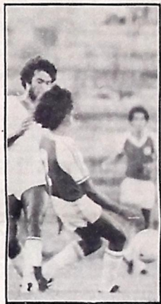
O time do Auto foi convidado

Juracy explicou no entanto, que esse projeto ainda está na fase de estudo, já que tudo somente será decidido após a definição da CBF quanto a indicação de Botafogo ou Campinense para a Taça de Prata. A partir daí é que ele vai apresentar oficialmente o plano à Confederação Brasileira de Futebol, e fazer uma reunião para discutir os detalhes.