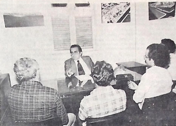
Burity reúne líderes rurais e mostra perigo a que as crianças estão expostas

O primeiro orador a debater o assunto, logo na votação da urgência, foi o senador Marcos Freire, que defendeu a urgência da criação do Estado de Rondônia. Ele afirmou que a urgência é necessária porque a região tem uma população de 1 milhão de habitantes e que precisa ser atendida com o mesmo nível de desenvolvimento que os demais Estados brasileiros.