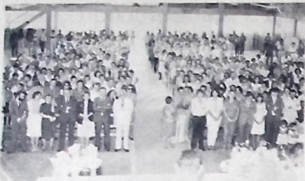
O vice-governador Clóvis Bezerra assistiu a cerimônia

Na edição do próximo domingo de A UNIÃO, será publicada uma reportagem sobre a EMERGÊNCIA que o 1º Grupamento de Engenharia de Construção implantou nos municípios de Cajazeiras, Santa Helena, Cacoeira dos Índios e Bon Jesus, para a construção de açudes, barragens, poços, aproveitando nesses serviços 700 agricultores da região, num trabalho racional, digno e honesto, de fundo humano e comunitário.