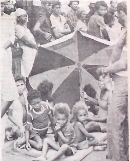
A quem interessar o risco a que estão expostas essas crianças? Ontem, o Governador voltou a fazer um apelo aos líderes do movimento camponês de Camucim, e ao próprio Arcebispo da Paraíba, para que poupem as crianças da promiscuidade e desconforto a que vêm sendo submetidas, fazendo da saúde e da vida uma apelação da gente grande. Por mais forte que seja o apelo, está em jogo a vida de crianças, que deve ser o objetivo de toda luta. Jamais os seus sacrificados.

Indagado por um repórter se era possível a intervenção da Polícia Militar para retirar as crianças por solicitação do juiz, o governador afirmou "violência ninguém vai cometer contra ninguém pois ela já está sendo praticada contra as crianças à vista de toda a comunidade" e contra a legislação em vigor.