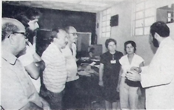
A comissão dos jornalistas foi recebida pelo gerente da agência local da CEF

Garantiu o candidato a Prefeito pelo PMDB Jovem, no próximo pleito, que a grande proposta do seu Partido, no ano vindouro, será a organização do povo fagundense com vistas a que esse mesmo povo tenha toda a assistência nos seus diversos campos, desde o educacional, ao político, ao social, enfim, todo o tipo de assistência.