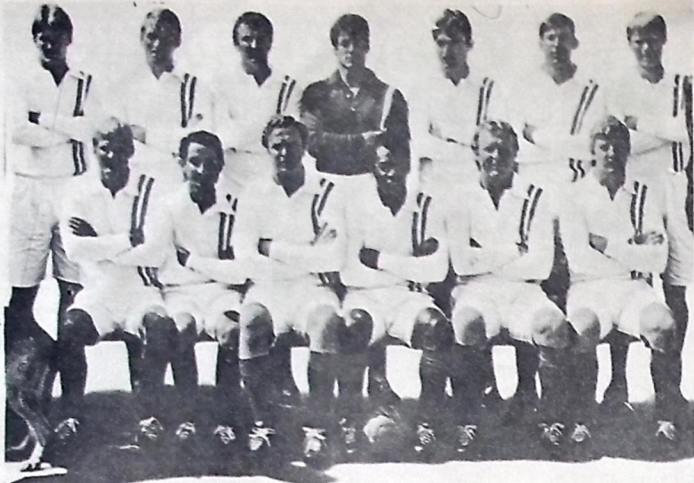
O time de presidiários em Fuga Para a Vitória, o novo filme do mestre John Huston, no Municipal