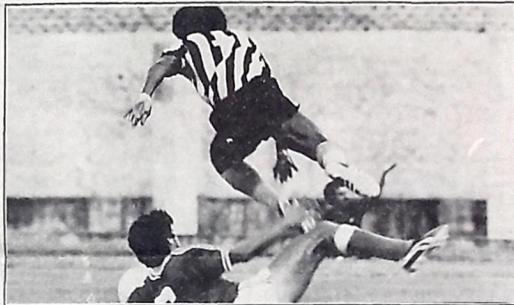
O empréstimo de Jangada termina no dia 31 de dezembro e o Ferrovário vai comprá-lo em definitivo para disputar a Taça de Ouro. O jogador fez uma brilhante campanha no Campeonato Cearense.

A Junta Governativa do Botafogo continua estudando as propostas que vem recebendo de vários clubes, e tem procurado manter em sigilo as conversações.