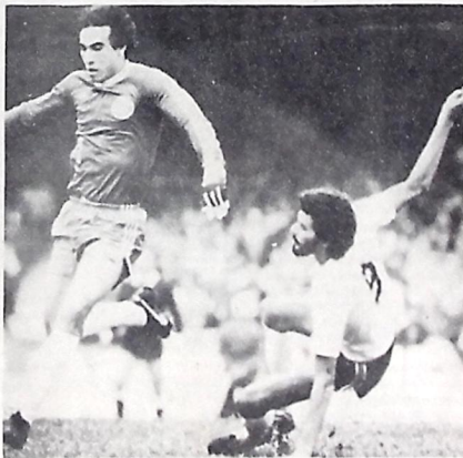
Sócrates, combatendo Gilmar, o sonho dos Espanhóis

São Paulo - Os espanhóis continuam insistindo na aquisição do ponta de lança Sócrates, do Corinthians e para isso, o Barcelona admite pagar mais de 1 bilhão de cruzeiros para ter o jogador na sua equipe. Comenta-se na capital paulista que emissários do Barcelona deverão procurar hoje o atacante que se encontra em Ribeirão Preto gozando férias.