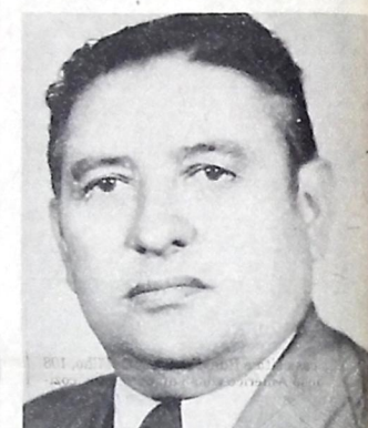
Prefeito em conflito com os vereadores

O Edil disse que o Prefeito deveria cortar os vencimentos dos vereadores se tivesse coragem mas, não investir contra os pobres assalariados. Ele disse que está disposto a votar a cassação do Prefeito. Por outro lado os funcionários prejudicados, afirmaram que irão até o Governador Tarcísio Burity, para resolver este problema, mas não serão prejudicados "pelos gestos desumanos do Prefeito Matias Rolim". Num documento enviado ao Prefeito Matias Rolim os funcionários alertaram que estão sendo usados como pode expiatório numa briga, política entre os vereadores e o Prefeito e que eles não têm nada com isso. Ontem (dia 21) os vereadores enviaram ao Prefeito uma resolução da mesa determinando o pagamento.