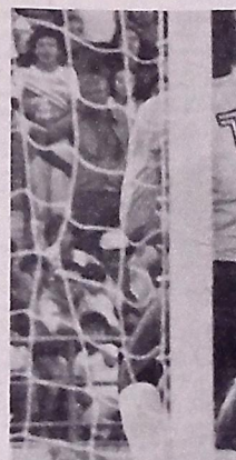
Campinense precisa vencer o São Paulo hoje à noite, no Amigão. Certo!