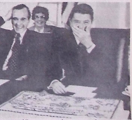
Democratas e republicanos prestam homenagem a Ronald Reagan

A primeira-dama Nancy disse que seu presente de aniversário para o marido é uma árvore para a fazenda dos dois, situada nas montanhas da Califórnia.