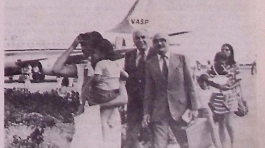
Braga diz que é candidato de qualquer maneira

O repórter quis saber se ele voltava ao Estado para conciliar os grupos existentes no PDS, após o episódio de domingo último. "Volto à Paraíba como presidente da nossa agremiação para zelar pelo fortalecimento do partido".