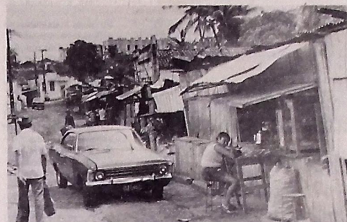
A rua Olímpio Pessoa será totalmente recuperada pela Seur