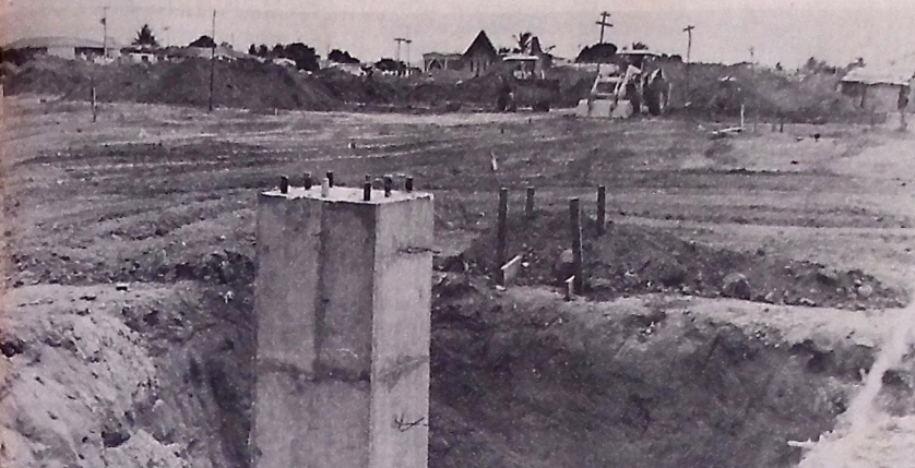
O Espaço Cultural deverá se constituir numa das principais realizações de Burity