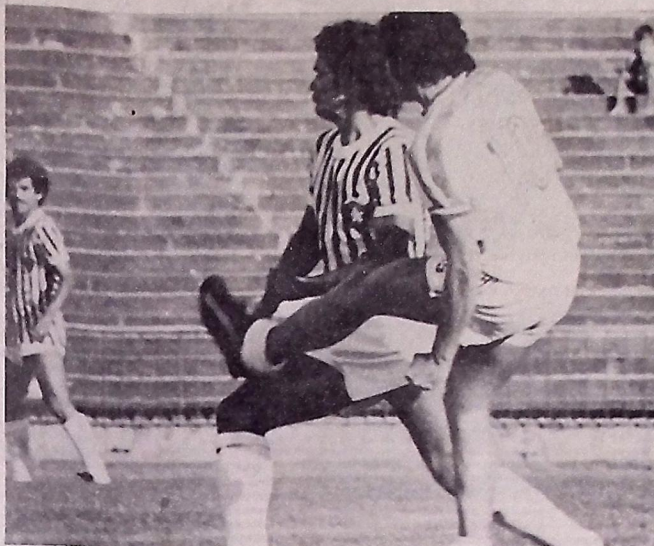
Nelson só joga hoje contra o Remo se o seu contrato for renovado