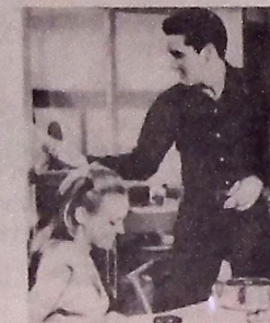
"O Seresteiro de Acapulco"

- Pernalonga. As voltas com suas cenouras, como não podia deixar de ser, está nesta estória assinada por Francisco Rodrigues, em compacto simples. Teclados e dire-