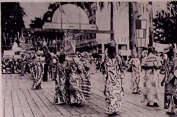
O bloco "Os 25 Bichos" abrirá, no domingo, os desfiles carnavalescos

A perspectiva de público em cada baile do Astréa é de pelo menos cinco mil pessoas, devendo duplicar essa massa no último dia. A garantia é de que haverá espaço suficiente para todos, pois este ano, o clube conta com três áreas para dança e salão oficiais, a área reservada construída (que abrigará o restaurante, posteriormente) e o espaço ao lado da piscina. Por outro lado, a segurança dos foliões será garantida por um contingente de 50 homens.