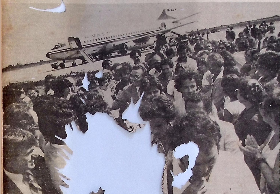
O governador Tarcísio Burity