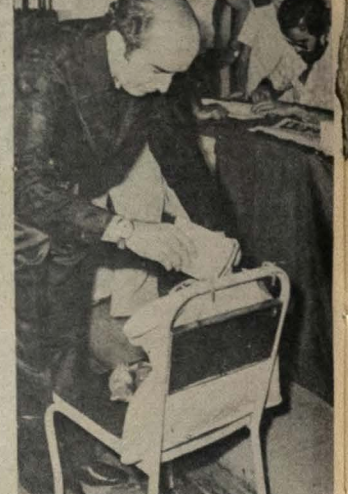
Vital do Rego pode voltar à política