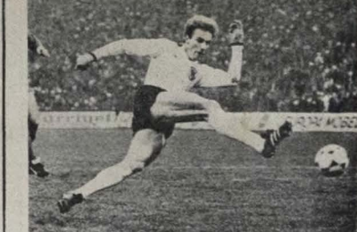
Rommenigge é uma ameaça para a equipe