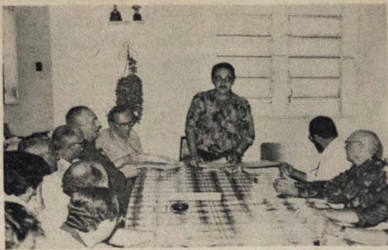
Maranhão traçou seu programa administrativo

Possivelmente ainda esta semana, uma comissão formada pelo coordenador da Sudepe, coordenador do Nordeste para Estações de Piscicultura e pelo engenheiro residente do DNOS, visitarão a área, com o objetivo de fazer um levantamento topográfico.