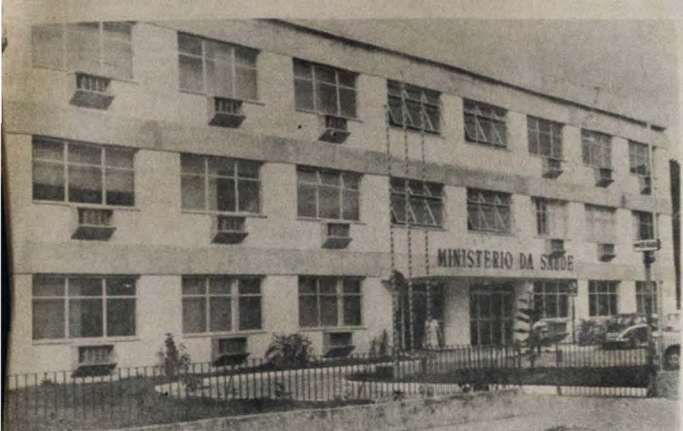
A Unidade Federal de Saúde será inaugurada, em João Pessoa, por Valdir Arcoverde.