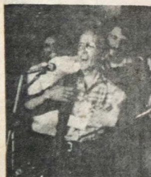
O Bispo de São Félix do Araguaia veste a jaqueta de guerrilheiro sanduista e declara sentir-se como se estivesse paramentado (Foto de "Catolismo" - Agosto/80)

E SALVE À SEMANA DA MARINHA E O SEU PATRONO TAMANDARÉ