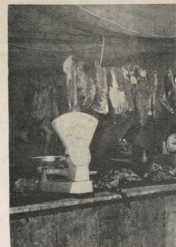
Consumidores reclamam preço da carne

Continua tendo grande repercussão a entrevista do deputado Ernani Sátiro sobre a igreja católica. Os padres da diocese dizem que o político não conhece comunidade de base e afirma coisas sem o devido conhecimento.