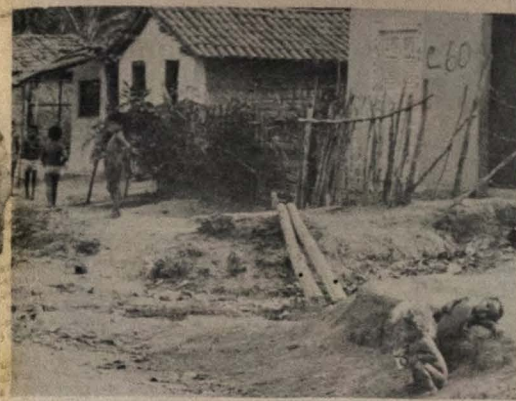
As favelas receberão atenção especial da Setrass