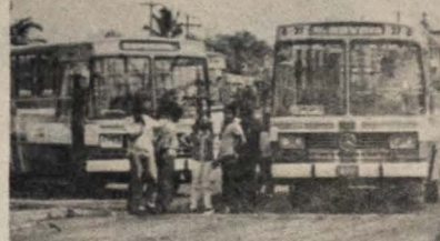
As passagens nos coletivos sofrerão aumento

Por outro lado, o delegado do IBGE afirmou que não há ainda data definida para a divulgação oficial e detalhada dos resultados do Censo Demográfico, já que está sendo realizada na direção geral do IBGE no Rio de Janeiro a "viagem em computador de todos os questionários, faltando ainda dados como a cor, fecundidade, escolaridade e renda familiar. "Tudo indica que em junho já teremos todos os resultados", disse ele.