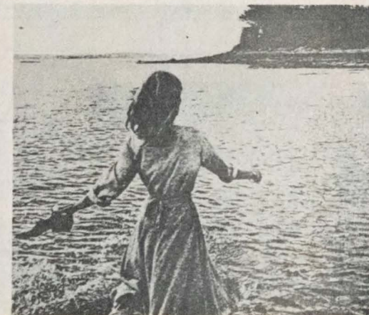
"Mon Oncle d'Amérique"