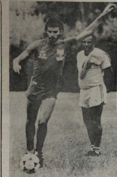
Sócrates comanda o ataque do time brasileiro

A Seleção Brasileira já atingiu 60 por cento do que você esperava? - Eu não gosto de falar em porcentagem em futebol.