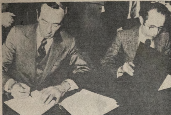
O secretário de Estado americano, W. Christopher, assina o acordo entre os EUA e o Irã