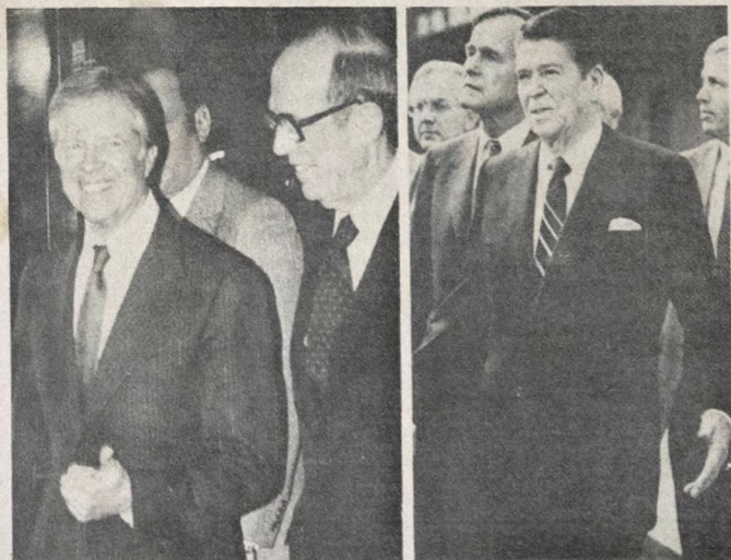
Carter sai e Reagan inaugura novo estilo na Casa Branca

Washington - Ronald Reagan, a poucas horas da posse na presidência dos Estados Unidos, quando proferirá o juramento de 35 palavras, uniu-se ontem ao país na comemoração da esperada libertação dos 52 reféns norte-americanos mantidos no Irã.