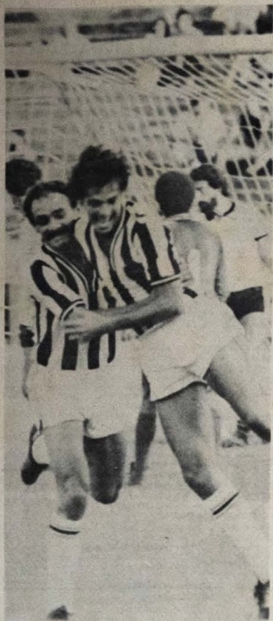
Botafogo pode garantir agora sua classificação