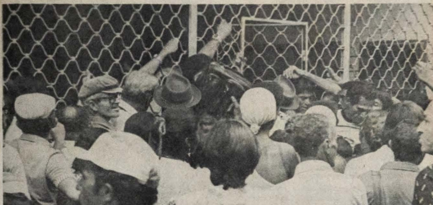
A ausência dos guardas contribuiu para que 500 servidores provocassem tumulto na frente da agência

O porta-voz acentuou, no entanto, que a administração ainda pretende cumprir "com as obrigações assumidas pelos Estados Unidos", presumivelmente incluindo o acordo que conduziu à libertação dos reféns, embora este ainda esteja sob estudo. (Página 7).