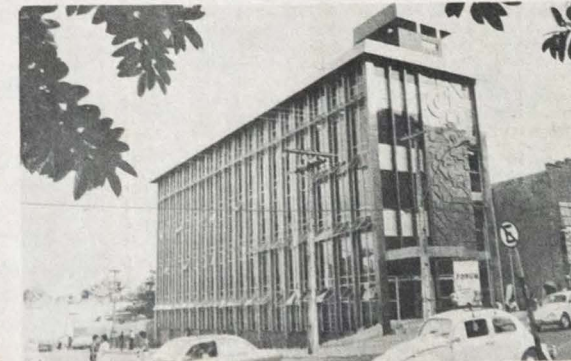
O prédio do Forum da Capital será inaugurado às 17 horas de hoje