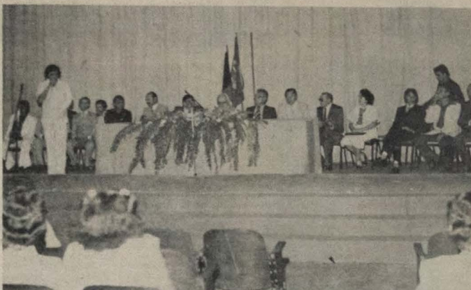
Mesa de honra da solenidade dos "Melhores do Ano"

CHUVAS Mais horas de intensa alegria viveu o povo barrensense, domingo último, quando, por volta de 14:00 horas, fortes chuvas