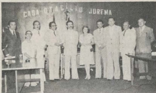
Os dez novos cidadãos de Cajazeiras

Faz parte, ainda, desse trabalho preliminar, a orientação aos prefeitos e demais lideranças, objetivando a apresentação de propostas que dinamizem o setor econômico, e, secundariamente, solicitar providências que digam respeito a equipamentos urbanos. Os funcionários da Seplan/Codel, farão também, nos 19 municípios, reuniões sobre Associativismo Municipal.