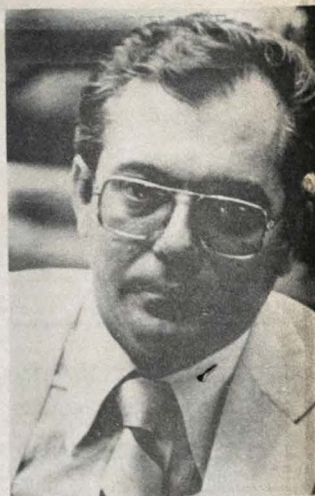
Deputado federal Marcondes Gadelha