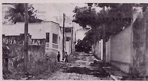
Nas ruas, o tráfego de veículos é quase impossível

Além de inúmeros apelos dos moradores, requerimentos pedindo melhoramentos para as ruas, feitas na Câmara Municipal por vereadores oposicionistas, um abaixo assinado, subscrito pelos moradores das Ruas São Mamede e Feliciano Coelho, já foi enviado à Prefeitura Municipal, porém, até