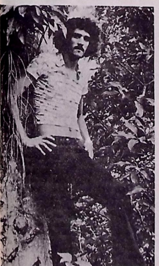
Cantor e compositor Moraes Moreira

Passa ao largo, no neste tempo com brincadeira a respeito dos males e favores que a dioceteca e outras moedas que vêm de fora es-