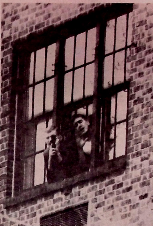
Dois ex-reféns do Irã aproveitaram o lazer para fotografar

TELEFONE Vende-se um, linha 224, 2.915,00. Tratar pelo fone 221.1229 Ramal 27