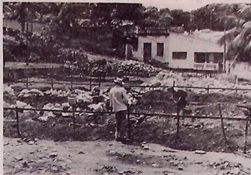
Obras de recuperação da casa do Estudante foram aceleradas