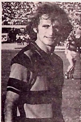
Olimpia tranquila, Gabriel perturba os adversários