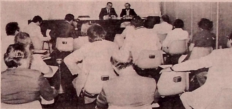
O governador Tarcísio Burity presidiu, ontem, a reunião do Conselho de Desenvolvimento do Estado.

O prêmio Nobel da Paz retornará ao Brasil no dia 9 de fevereiro. Ele justificou a indicação do dirigente dos trabalhadores poloneses para o Nobel da Paz, afirmando que seu trabalho "de solidariedade e na luta por reivindicações sociais na Polónia tem muito a ver com as lutas e reivindicações sociais na América Latina".