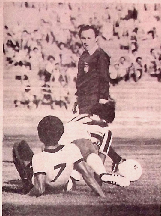
A defesa do Bota tem sido o grande problema nos jogos

Na chave dos clubes brasileiros, estarão este ano as equipes paraguaias do Olimpia e Cerro Portenho. A tabela ficou assim constituída: Dia 3 de julho - Atlético x Flamengo Dia 7 de julho - Olimpia x Flamengo Dia 14 de julho - Flamengo x Cerro Portenho Dia 17 de julho - Olimpia x Atlético Dia 21 de julho - Cerro Portenho x Atlético Dia 24 de julho - Flamengo x Olimpia Dia 28 de julho - Atlético x Olimpia Dia 31 de julho - Atlético x Cerro Portenho Dia 6 de setembro - Flamengo x Atlético.