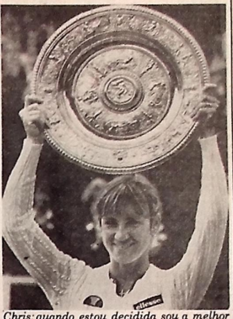
Chris quando estou decidida sou a melhor