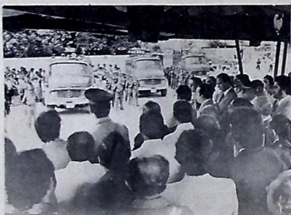
Solenidade marca a entrega de quatro novas viaturas

O dia do sr. Tarcísio Burity em Campina Grande começou com uma visita de inspeção à construção da rodovia pavimentada entre Queimadas, Aroeiras e Umbuzeiro, cujo trecho inicial percorreu de ônibus. Esta estrada (Pb-102) terá 37,9 quilômetros de extensão, tem seu custo estimado, a preços de hoje, em Cr$ 185,6 milhões e é de fundamental importância para a economia da região polarizada por Campina Grande. O presidente da Assembleia Legislativa, Fernando Milanez, acompanhou o governador na inspeção às obras de construção da rodovia.