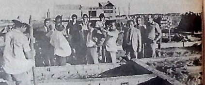
Os Conjuntos residenciais de Campina terão água e esgoto

Essas realizações estão ligadas a melhorias nas estações de tratamento ou estações elevatórias, além de adutoras, incluindo a aquisição de equipamento como floco-decantadores, filtros, conjuntos moto-bombas e outros, além como a recuperação de estruturas. Há, ainda, a construção de adutoras no cronograma concluído pelo Governo nessas municípios, ao lado da implantação de sistemas de dosagem.