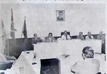
Burity vê principais assuntos de interesse da cidade

ba em Campina, conferindo destaques à ampliação do sistema de abastecimento d'água, à construção de 5 mil casas populares, à pavimentação de rodovias e implantação de estradas vicinais, à construção de grandes escolas de 1ª e 2ª graus, e do Instituto Médico Legal, além dos esforços para a execução do projeto da nova Estação Rodoviária da cidade. Ele disse que nenhum Governo investiu tanto em Campina Grande quanto seu. Na entrevista com os jornalistas e no debate com os vereadores, o governador não deixou indagações sem resposta. O seu encontro com os vereadores do PDS e da Oposição transcorreu num clima de franqueza enaltecido por todos os parlamentares, indistintamente. Os representantes da Oposição, sem exceção, elogiaram o governador pelo seu desempenho durante os debates, reconhecendo o seu esforço em apoiar o desenvolvimento de Campina Grande e municípios vizinhos. Ao final dos debates, depois de ser demoradamente aplaudido pelo plenário e pelas galerias, o governador disse que seu encontro com os vereadores campinenses foi um grande momento de exercício democrático.