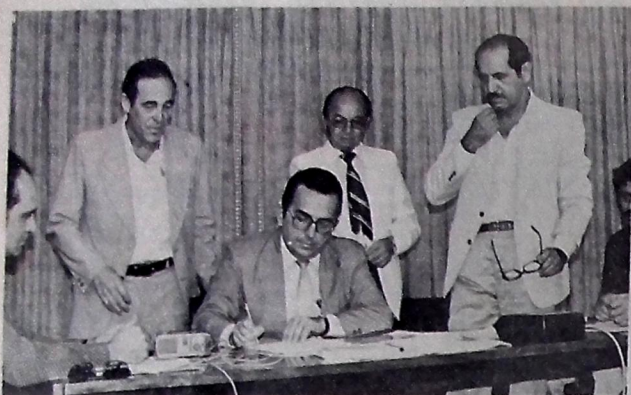
O governador autoriza a Cagepa a contratar mais água para Campina

Burity manda Cagepa abrir concorrência para iniciar no próximo mês a primeira etapa de ampliação do sistema