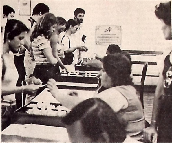
As inscrições do Vestibular este ano obedecerão o mesmo esquema do ano passado

As inscrições serão iniciadas na última semana deste mês e a duração de 15 dias