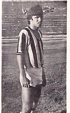
Treze começa treinamentos visando a decisão do primeiro turno