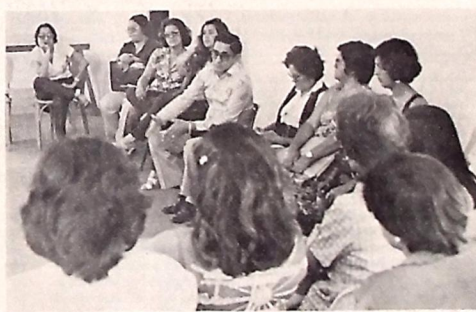
Os preparativos do encontro promovido pelo Mobral e CNBB

Durante mais de vinte anos, as praças Pedro Américo e Aristides Lobo foram ocupadas por comerciantes ambulantes e fotógrafos lambe-lambe. Nesse período, durante alguns anos, serviu também como estação rodoviária.