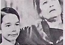
Cena de "Jim Jones"

ASSALTO AO BANCO (A). - A cores. 18 anos. No Rex. 14h30m, 16h30m, 18h30m e 20h30m.