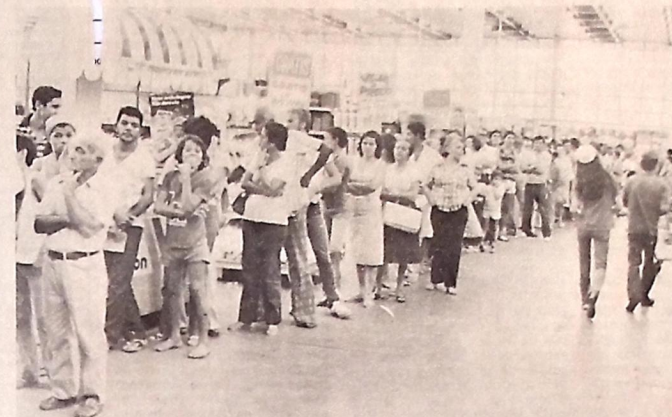
Filas nos supermercados de João Pessoa para a aquisição de pães e bolachas