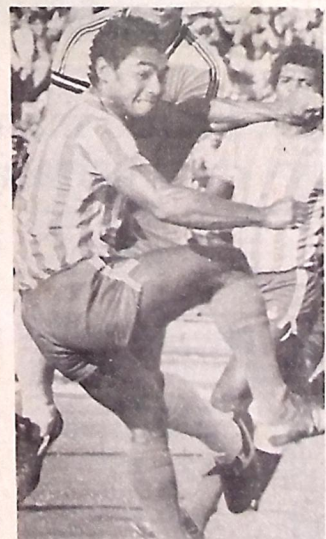
Nacional-C poderá sair do campeonato

Terminou ontem a fiscalização do Ministério do Trabalho na FPF, onde foram constatadas várias irregularidades, que, contudo, não foram fornecidas à Imprensa. Fontes ligadas à própria Federação dão conta ainda que será iniciada esta semana outra fiscalização na entidade.