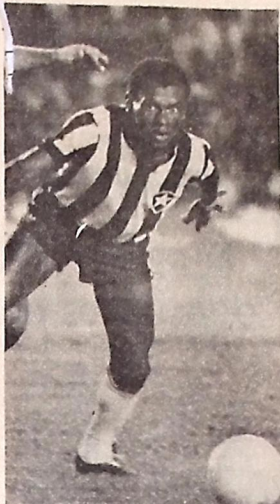
Perivaldo entra no segundo tempo, mas Zico entra de primeira no amistoso da Seleção

Carlos Alberto foi acusado de incompetente. Tinha as peças base e não fazia um bom trabalho - e olhem que ele foi escolhido o melhor treinador do futebol brasileiro em 80 - e o que tem Ibiapino? Um time mamulengo para fazer milagres. Para que ele não tenha a estrela de Caicenas, o famoso treinador que consegue transformar os pequenos em assombrosos grandes, pelo menos por instantes.