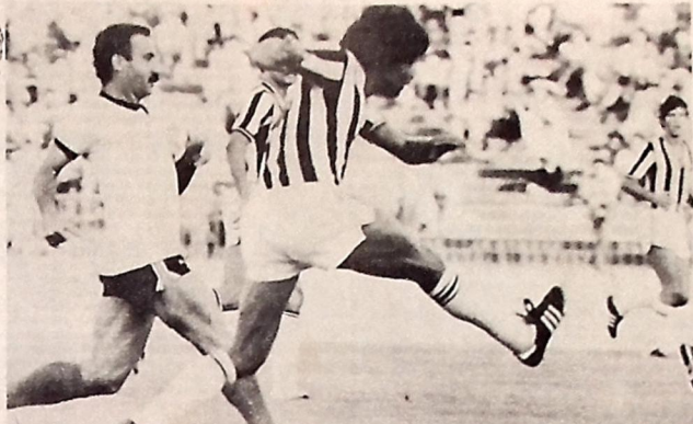
Treze e Botafogo decidem hoje em Campina, o primeiro turno do campeonato

Jogando em casa e beneficiado pelo empate, o Galo é apontado favorito ao título do turno