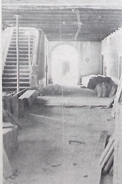
Depois da reforma, museu expõe arte sacra

Somente em julho do próximo ano o Museu Escola e Sacra, que faz parte do complexo arquitetônico da Igreja de São Francisco, atualmente em reforma, será aberto a visitação pública. Segundo informou ontem o presidente da Fundação Cultural do Estado da Paraíba, Hidelbrando Assis, a intenção do órgão é a de concluir os trabalhos antes do término do mandato do atual governador Tarcísio Burty. As obras de reforma do complexo arquitetônico de São Francisco, envolvendo convento, museu, três capelas e duas sacristias, além do adro, foram iniciadas no final do mês de maio de 79, através do Programa de Cidades Históricas do Governo Federal, que participa com cerca de 80 por cento das verbas alocadas no total. O Governo do Estado participa com 20 por cento do total do orçamento a ser gasto. Segundo adiantou Hidelbrando Assis, até o momento já foram gastos cerca de Cr$ 20 milhões e até a conclusão da obra, a aplicação de recursos financeiros deverá ter chegado a casa dos Cr$ 30 milhões aproximadamente.