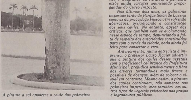
A pintura a cal apodrece o caule das palmeiras