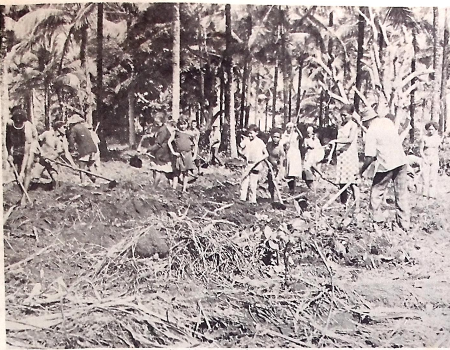
Em Camucim, os trabalhadores liquidaram a plantação de cana realizada ante-ontem

Para o início do Proase já foram liberados cerca de cem milhões de cruzeiros. A liberação dos empréstimos deverá atender às normas do crédito rural, devendo atuar na faixa de mini e pequenos produtores.