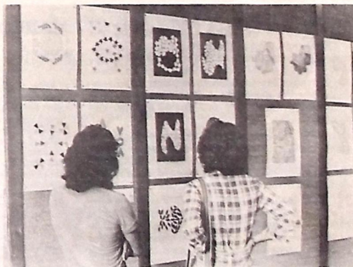
Exposição de artes plásticas aberta no Centro de Reabilitação