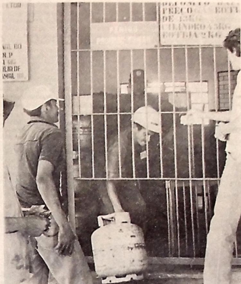
O gás só era encontrado ontem no posto distribuidor de Bayeux