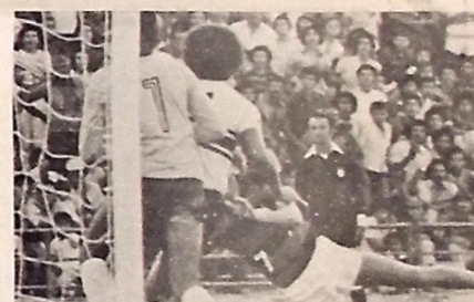
O rubro-negro diz que o segundo não é de ninguém