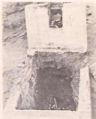
Velha couva para reposição de cadáveres

Setenta e nove salas de aulas estarão re-