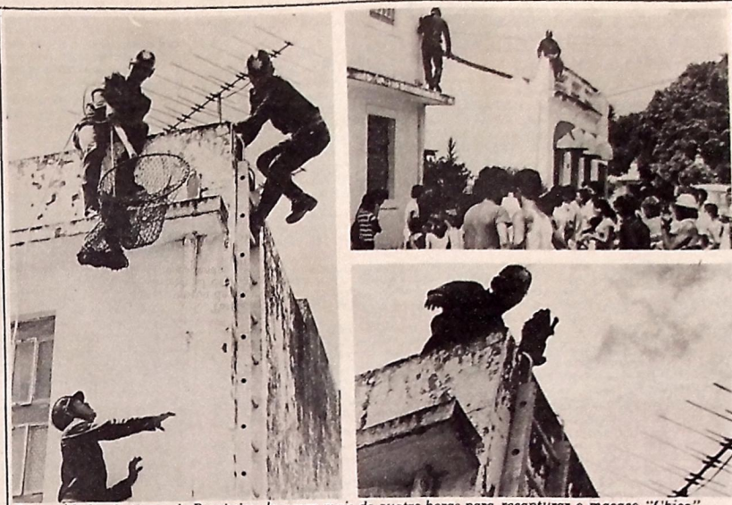
Doze soldados do Corpo de Bombeiros levaram mais de quatro horas para recapturar o macaco "Chico"