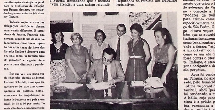
Burty propõe à AL aposentadoria especial para professores