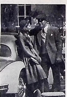
"Granda de Pedra"