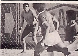
O Naça de Patos, pensa em vitória

Galo motivado quer faturar dois pontos sobre o Naça de Cabedelo