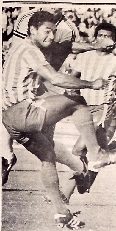
O Nacional de Cabedelo entrou na jogada do bingo e pensa fazer o mesmo sucesso que o seu homônimo de Patos, faturando um bom dinheiro para melhorar de vida.

A exemplo do que ocorreu neste último fim de semana, a rodada de domingo no estádio Almeida, pelo Campeonato Parabaiano, poderá ser antecipada para a noite do sábado, em virtude de outro bingo, que será realizado na praça de esporte, promovido pelo Nacional de Cabedelo.