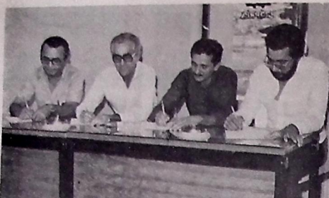
Assinatura do contrato entre a Própria e construtora Habitat

Entrega dos Trabalhos: No Estado da Paraíba, na 23ª CSM, até o dia 20 de Agosto de 1982.