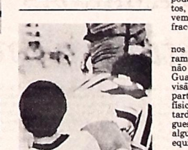
E o Galo treina hoje no PV

prir jogos fora de casa, numa maratona cansativa para o elenco. Mesmo assim, nossa equipe jogará contra o Santos pensando em garantir dois pontos, o que será muito importante com relação às pressões de disputar o quadrangular".