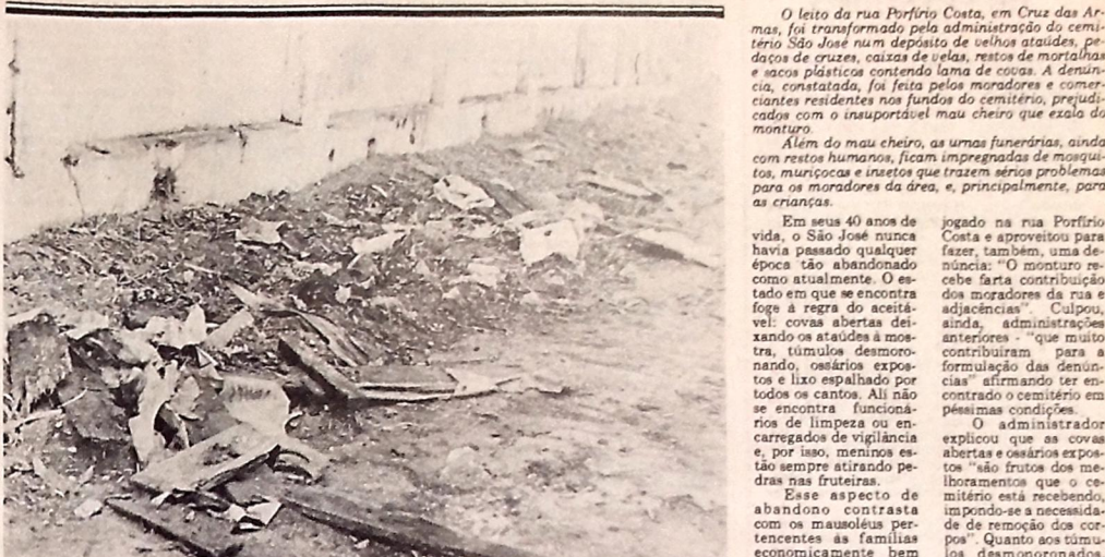
Administração do cemitério põe na rua atoudeas, mortalhas, cruzeiros e até restos humanos

Em Cruz das Armas, o leito da Porfírio Costa é ocupado por restos humanos