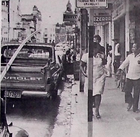
Quem quiser estacionar agora na Rua Maciel Pinheiro, nos dias úteis e no horário comercial terá que pagar: a Empresa Municipal de Urbanização acaba de implantar ali a chamada Zona Azul, que anteriormente já havia implantado na Rua Duque de Caxias. A princípio, a medida causou algum constrangimento e alegações não muito procedentes, mas muitos estão se acostumando com a ideia. A alegação de que impossibilita o movimento de carga e descarga em estabelecimento comercial não tem a menor valia, considerando-se que em todas as cidades de médio e grande porte esse movimento se faz principalmente no período da noite ou, no máximo, antes das 7 horas da manhã. Também, em outras cidades, a Zona Azul está sendo plenamente aceita.

No mesmo local, será ministrado no dia 27 deste mês, o Curso de Atualização de Professoras da Zona Rural, para professoras de Lucena, Itatuba, Alhandra, Casporá, Araçagi, Duss-Estradas, Juarez Távora, Mamanguá, Rio Tinto, Itapororoca, Alagoa Grande, Santa Rita, Cruz do Espírito Santo, Alagoinha, Mulungu, Matacará, Conde, Pitumbu, Jacarú, Baía da Tração, Pedras de Fogo, Belém, Guarabira, Lagoa de Dentro, Pilóezinho, Cutigi, Caieira, Gurinhatã e Inzá.