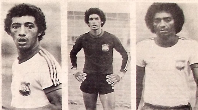
O Auto treina com vistas ao jogo contra o Campinense, que pode ser disputado sábado

Querendo repetir o feito do seu homônimo - Nacional de Patos - o Nacional de Cabedelo espera obter grande sucesso no seu bingo, porque, somente assim, poderá partir para a construção do seu patrimônio, sobretudo que atualmente, são péssimas as condições do estádio Francisco Figueiredo de Lima, deficiente até para as promoções de jogos amistosos.