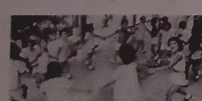
"A criança é uma edificação espiritual dos responsáveis por ela. Não existe criança - nem uma só - que não solicite amor e auxílio, educação e entendimento." (ANDRÉ LUTZ)