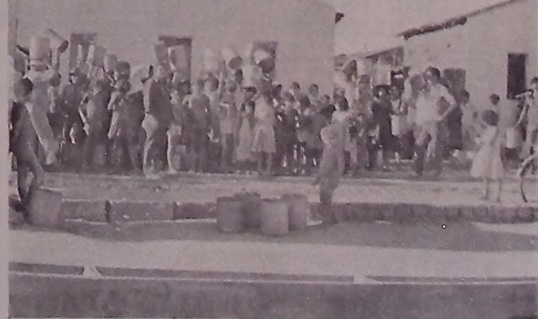
Com luta na cabeça, povo de Brejo dos Santos pede abastecimento