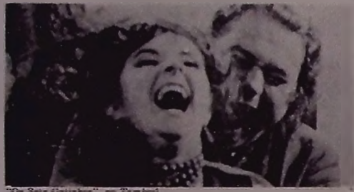
"De Seis Gatinhos", no Tibaldi