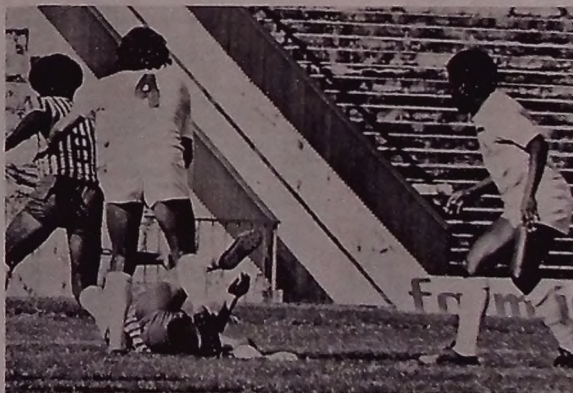
O Santos não é mais esse time fraco. Reforçado, não quer a lanterna

Depois de várias controvérsias em torno de sua participação no Campeonato Paraibano deste ano, em razão da ameaça de rebatimento por ter sido o vencedor do certame estadual do ano passado, o Santos estréia amanhã, no Campeonato - pelo menos é o que marca a tabela - contra o Guarabira, no estádio Presidente Vargas, em Campina Grande, na preliminar de Treze e Santa Cruz de Santa Rita.