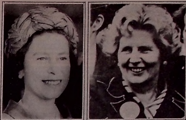
A Rainha quase é atingida em atentado do IRA, mas Thatcher não cede às exigências.