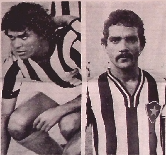
Israel estreia no time do Bota, e Nelson tem presença no meio