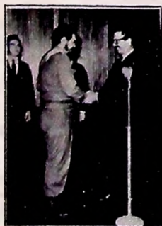
Jânio e o Grande "Che" Guevara

Comçaram os trabalhos de produção de Os Trapalhões Especial , que irá ao ar no dia 28 de junho, substituindo os 15 anos de Jânio e o Grande "Che" Guevara