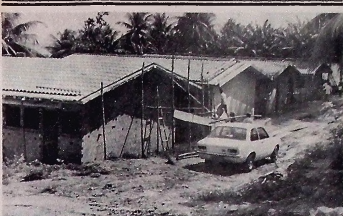
A conclusão dos serviços de reforma da Casa do Estudante é anunciada para junho

Os preços das passagens de coletivos serão majorados em mais de 10% a partir de junho