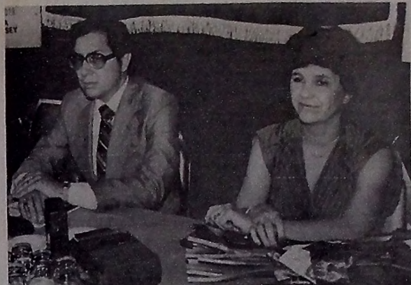
O presidente do Equador e sua mulher morreram na explosão do avião