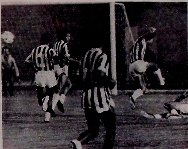
Santos tenta, novamente em Campina, surpreender o Campinense na "Amiãõ"