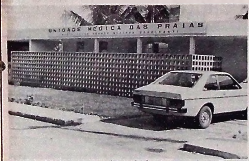
Unidade Médica funciona há mais de ano na praia de Tambá

Desde um simples corte no corpo, até cirurgias e outros tipos de tratamentos mais delicados podem ser feitos na Unidade Médica das Praias, sem precisar recorrer a outro local mais distante. A dificuldade maior, portanto, está apenas em locomoção em ambulância, se for necessário, pela falta de transporte no órgão.