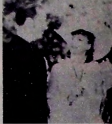
"Anna Karenina", de 23h20.

O ESPADACHIM - Produção americana de 1949, com direção de Joseph H. Lewis. História, no século XVIII. O nobre (Larry Parker) de uma família tradicional se apaixona pela filha (Ella Drew) do líder de um clã rival. Em preto e branco. No Canal 10, 14h30.