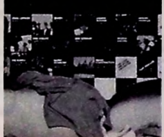
Medo de Voar

MEDO DE VOAR , Erico Jong - Primeiro romance de Erico Jong, Medo de Voar trata essencialmente das fantasias sexuais de uma mulher, Ingrid Wieg. Abandonando o marido (aquela em Viena, Isadora viaja pela Europa com um desiluído analista e praticamente cai na libertagem. Fiel ao Capeta do Livro S.A., A. Ministro Rocha Azevedo, 345 - CEP 01410 - São Paulo, SP.