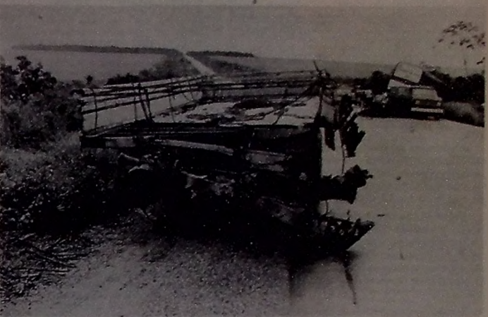
Os destroços do ônibus dão bem uma idéia da violência da colisão. A cabine do caminhão simplesmente desapareceu. Peças foram encontradas num raio de até vinte metros