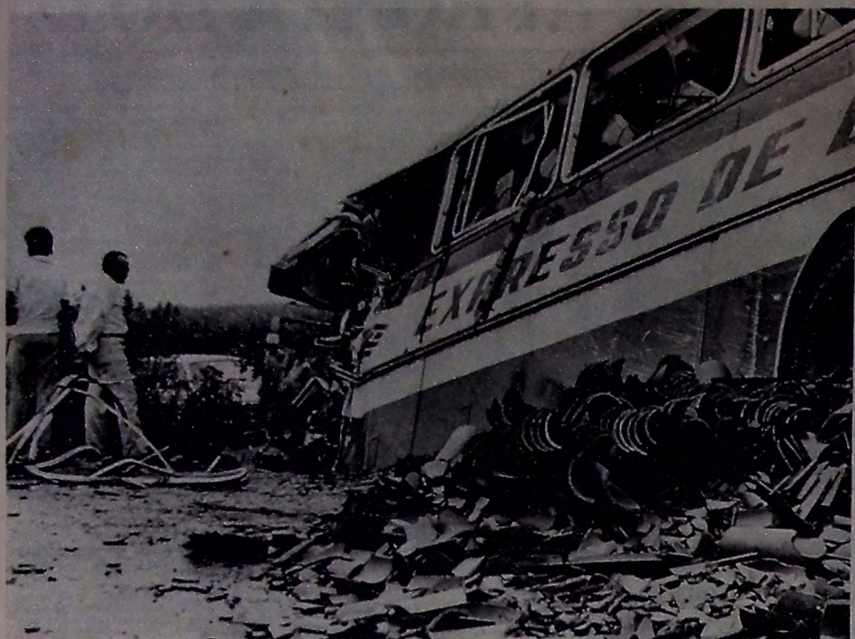
A violência do choque com o caminhão deixou à dianteira do ônibus da Expresso de Luxo inteiramente destruída

Um ônibus da Expresso de Luxo chocou-se com caminhão carregado de telhas e os dois motoristas morreram na hora