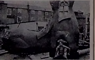
Gostava tanto de sapato, que terminou indo morar num deles

REGULAMENTO: 1) Os contos deverão ser de réis. 2) Não aceitamos versos de cem contos. 3) Devemos morrer de rir com os contos. 4) Os foneças pagos serão pela Funerária Santa Mônica, onde você morre com prazer. 5) Os contos deverão iniciar-se com letra maiúscula e terminar com um ponto. 6) Quem conta um conto aumenta um ponto. 7) Os originais deverão ser entregues em 6.854 vias em papel datilografado em espaço 2 1/2. 8) Damos o prazo de até Dezembro de 69. 9) Os prêmios serão simbólicos. P) Um símbolo, 2) Dois símbolos. 10) Tanho dito.