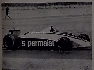
Nelson Piquet otimista para o Grande Prêmio de hoje

Para este ano, Reutemann e Laffite também podem ser incluídos entre os possíveis favoritos. Reutemann por causa da excelente fase que atravessa, liderando o Campeonato Mundial e tendo marcado pontos nas últimas 15 provas. O francês Jacques Laffite tem a seu favor a boa adaptação do motor Matra V-12 ao circuito, que requer potência e torque em baixas rotações, principais características dessa máquina. Além destes dois nomes, o australiano Alan Jones e irlandês John Watson são dois concorrentes com chances maiores. Uma situação que não acontece com as Ferrari de Gilles Villeneuve e Didier Pironi e com os Renault de Alain Prost e René Arnoux, ambos carros com turboalimentadores no motor. Para a equipe Renault, além do fato de que os circuitos de baixa velocidade não são ideais para carros com motores deste tipo, Prost e Arnoux ainda terão de usar o modelo mais antigo, o RE-20, já que o RE-30 ainda não foi totalmente aprovado para corridas.