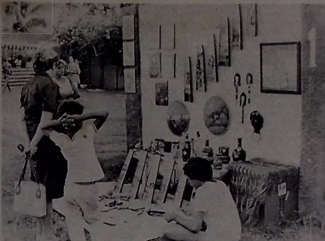
A feira típica da praia venderá semanalmente produtos do artesanato paraibano