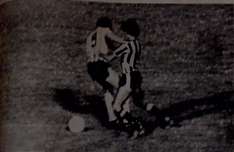
O choque dos líderes, hoje, no Almeidão, pode ter recorde de renda no Campeonato Paraibano 81