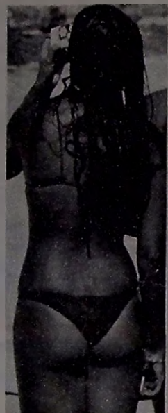
Pra ilustrar o domingo. Podem crer, Ra, ra!

Professor Eis Té Tico Quando Mestre - Sou muito moço, 25 anos apenas. No entanto tenho bravetas pá de galinha. Pelo amor de Deus, me ajuda! ESTERPE RESPONDE - Quando Ester - Não se desespera. Ter pá de palha num é o fim do mundo. A galinha tem, e nunca, nunquinha em minha vida profissional, recebi carta de reclamação, se quiseram! Ditem elas que ce galas adoooooooooooo milibões! O Ester, pensa nas bobas bonacas que num têm um coberto nem de Deus Namorados. Seja menos desumano, ó Desumano malucoooooooooooooo... ***** Quando Mestre - Tenho rugas. Sou jovem. Trezeandassete jovent, 25 anos. Mesmo assim meu chato de rugas. O senhor certamente já sabe, sou um prodigioso, e por isso mesmo um voador, um homem que curta a vida. Responde com urgência. ROMÉRIO/RO. RESPOSTA - Homen! Hoooooooooooo! Deixem-me lá. - Ra, só, só, só, só, só, só Canal. Quando da maná! Mas rugas do que tu, tem a senão, que é acarada pelas mãos maciúlas e magras do Dominguinhos. Quem sêdas via? "Cuspi" Despreze! Odeio-te! Cuida do corpo de tua maná.