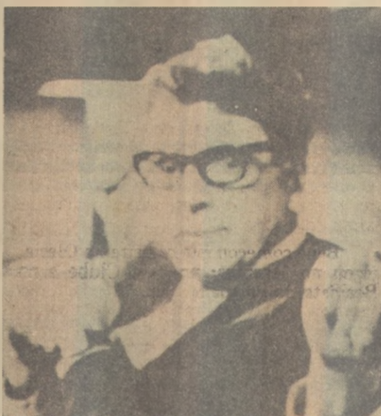
"O Assassino de um Presidente"

TRINITY E SEUS COMPANHEIROS - Produção italiana. Mais um western narrando as peripécias do personagem lançado com grande sucesso comercial na década passada. Estrelado por Terence Hill. A cores. Livre. No Plaza. 14h30m, 16h30m, 18h30m e 20h30m.