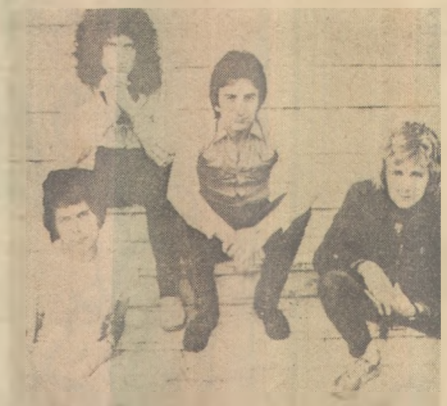
O Queen toca hoje em São Paulo

O projeto seguinte foi um álbum ao vivo, chamado Live Killers , virtualmente o show inteiro em disco. O pacote foi muito bem sucedido no mundo inteiro, tanto como souvenir para os milhares que viram o show, como uma iniciação no poder e energia do Queen ao vivo para aqueles que nunca os viram. O fantásti-