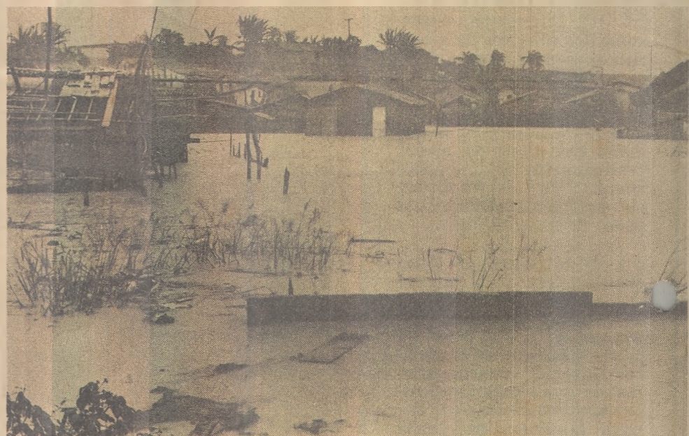
As chuvas inundaram ruas dos principais bairros de João Pessoa

Bairro do Rangel, Cristo Redentor, Marés, Bairro dos Novais, Costa e Silva e Ernesto Geisel são os setores mais atingidos e até a Câmara Municipal de João Pessoa, que fica no centro da cidade, não realizou sessão porque, apesar dos últimos consertos realizados, a água vasava pelos vários setores do prédio.