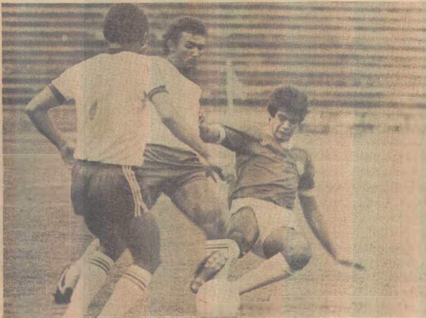
Automobilistas estão prontos para enfrentar o Botafogo amanhã