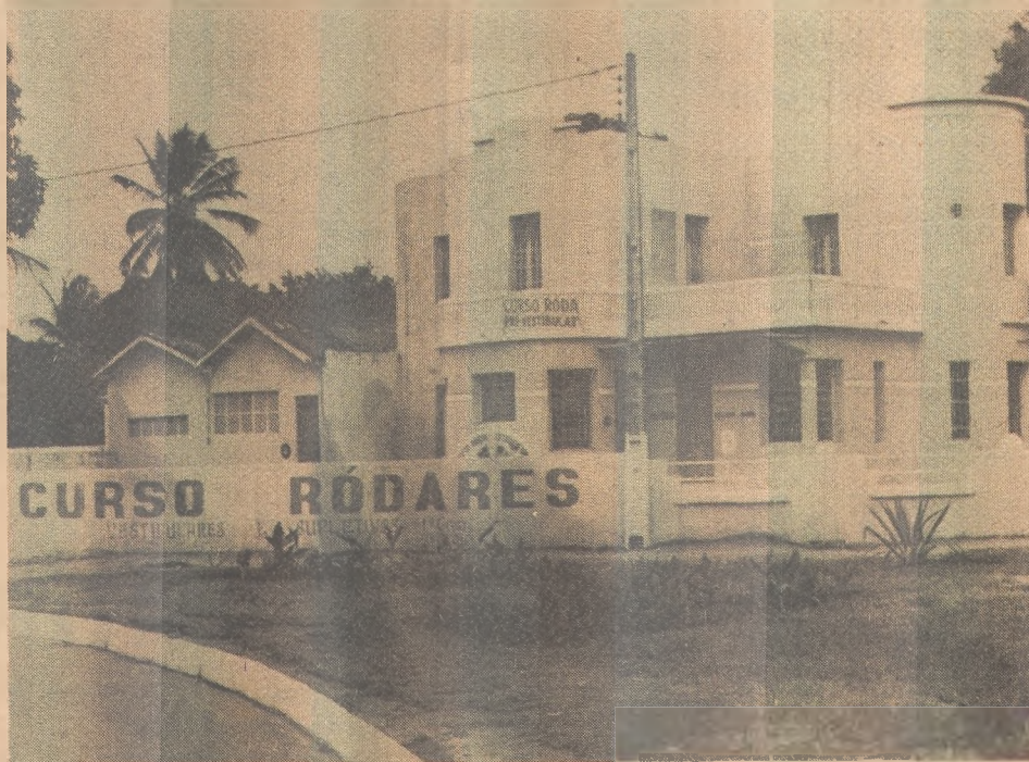
O prédio do Curso Ródares só abriu para receber matrículas

Cerca de cem estudantes foram ludibriados pelo Curso Ródares, instalado na Avenida Epitácio Pessoa. A equipe responsável pelo funcionamento do cursoinho pré-vestibular fechou o estabelecimento sem dar qualquer tipo de satisfação aos matriculados, e entregou o prédio ao seu proprietário.