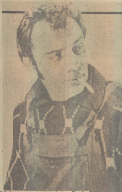
Volonté: um ótimo Lulu

Ao diretor italiano - em A Classe Operária vai ao Paraíso (hoje, no Tambaú, em último dia de exibição) - interessa o homem, vítima e ao mesmo tempo colaborador da industrialização. Que, na engrenagem da fábrica, sufoca seus problemas, suas exigências pessoais e até a sua personalidade. O tema foi proposto muitos anos atrás no cinema por Charlie Chaplin, num dos seus filmes melhores, Tempos Modernos ,