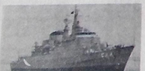
A "Independência" - a fragata mais moderna incorporada à Força de Fragatas.

"O sorriso da fraternidade, a ajuda silenciosa, a humildade sem alarde, a flor da gentileza e o gesto amigável, prodigiosamente, em qualquer parte" (EMMANUEL).