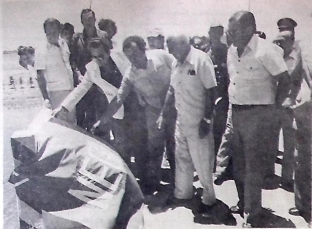
O governador Burity inaugurou o contorno rodoviário na cidade de Boqueirão

Os ganhadores do concurso, cujo resultado será publicado até o dia 31 de dezembro de 1981, receberão prêmios de Cr$ 15.000,00 Cr$ 10.000,00 e Cr$ 5.000,00 respectivamente, para os 1º, 2º e 3º lugares. A entrega dos prêmios será no dia 10 de janeiro de 82.