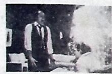
"Scanners", cartaz do Plaza