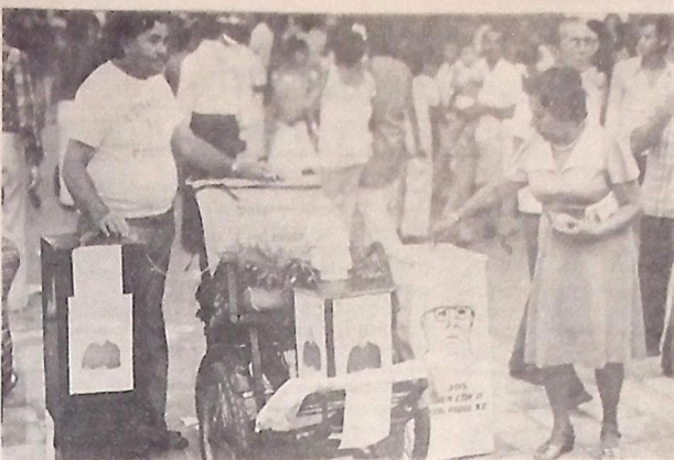
As caixas coletoras foram distribuídas por todos os cemitérios de João Pessoa

Durante aproximadamente 20 anos, as praças Aristides Lobo e Pedro Américo, serviram para outras finalidades: a primeira comportou mais o ramo de fotografias ambulantes, mais conhecidos por lambe-lambe; a outra, serviu de estação rodoviária e também destinou-se ao mercado ambulante de bijuterias, lojas de roupas e sapatos que funcionavam em barracas.