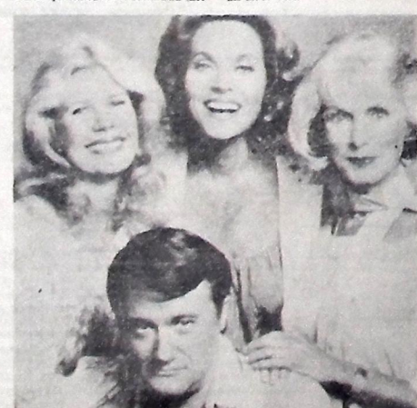
Os quatro do "Jogo de Vaidade", no Canal 10, às 21h15m.

Remick). Também no elenco, Arthur O'Connell, Eve Arden, Kathryn Grant e George C. Scott. Trilha sonora composta por Duke Ellington. Em preto-e-branco. No Canal 10: 23h20m.