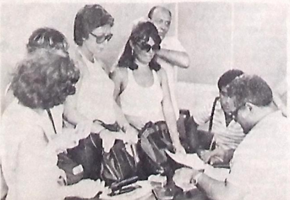
Mais de 800 funcionários se inscreveram para crédito

Ocupando uma área construída de 294 metros quadrados, a Unidade Básica de Saúde de Solânea, de estrutura física e de suas modernas do Estado, tanto pela sua moderna linha arquitetônica como pelos serviços que serão ali prestados.