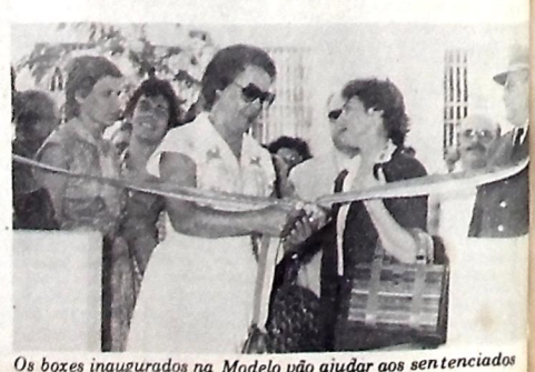
Os boxes inaugurados na Modelo vão ajudar aos sentenciados