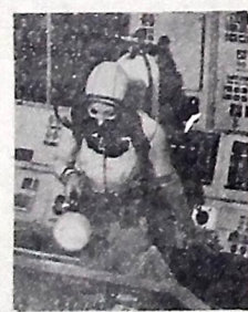
"Posto M3 Havaí"

ANATOMIA DE UM CRIME (****) - Produção americana de 1959, com direção de Otto Preminger. Um advogado (James Stewart) defende o tenente do Exército (Ben Gazzara) acusado de assassinar um homem que tentou atacar sua mulher (Lee