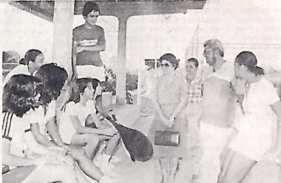
SECRETÁRIA DE EDUCAÇÃO VISITA ACADEMIA DE TÊNIS

□ Os ingressos estão sendo vendidos ao preço de 500 cruzeiros e muita gente já tem presença assegurada.