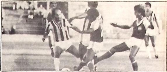
O empate com o Auto deixou o Treze mais perto do título deste ano