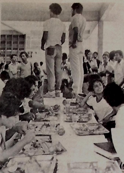
No restaurante, os estudantes fazem ato de apoio à greve