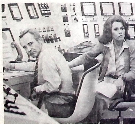
Síndrome da China: exibição na televisão

Síndrome da China ( The China Syndrome ) conquistou o público e a crítica internacionais em 1979 com a história de cobertura por uma equipe de repórteres de televisão de um acidente nuclear em uma usina na Califórnia. Dirigido por James Bridges ( O Assaltado ) este filme tenso, que dispensa até o ritmo da música para sublinhar suas ações, tem excelentes interpretações de seus protagonistas: Jane Fonda, Jack Lemmon, Michael Douglas (que foi o produtor) e Scott Brady.